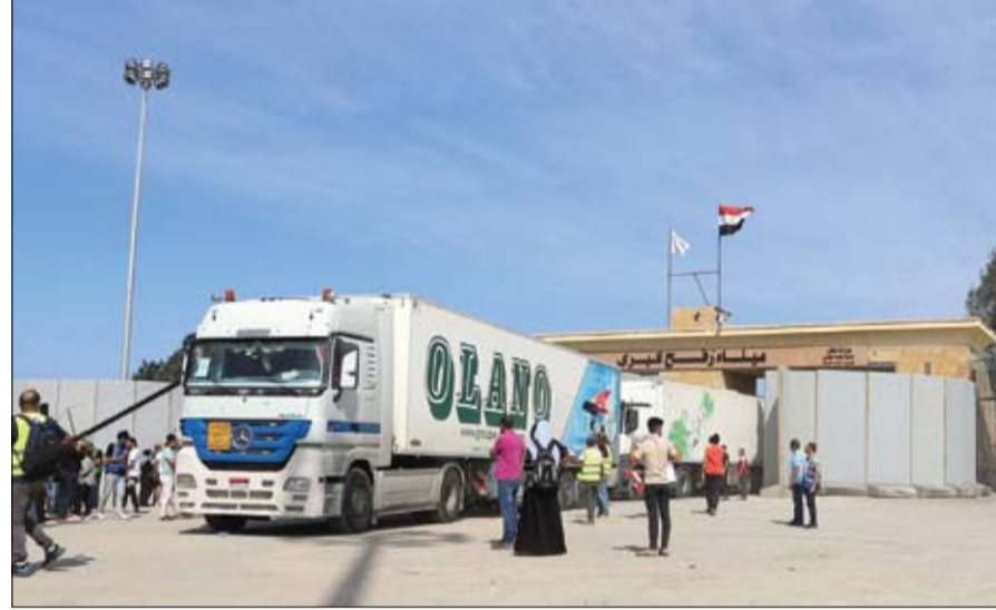
شاحنات تعبر معبر رفح الحدودي الى جنوب قطاع غزة

الأوروبي، جوزيب بوريل، إن الوزراء ناقشوا دعوة الأمم المتحدة لإقرار وقف إطلاق نار إنساني بين إسرائيل وحماض في قطاع غزة وأضاف: الأولوية الآن لوقف القتال وادخال المساعدات إلى غزة. وحظيت الدعوة بدعم بعض الدول الأوروبية من بينها إسبانيا وإيرلندا وهولندا، في حين عارضتها دول مثل ألمانيا والنمسا، وأكدت على حق إسرائيل الدفاع عن نفسها. وقالت وزيرة الخارجية الألمانية أنالينا بيربوك، «لن يكون هناك سلام وأمن لإسرائيل والفلسطينيين، إلا إذا تمت مكافحة الإرهاب». وقال وزير خارجية إيرلندا مايكل مارتن: إن وقف إطلاق النار يتيح توصيل المساعدات الإنسانية، والعدوات الطبية، يمثل مسألة ملحة للغاية. وأضاف، «الخسائر في الأرواح هائلة، ووصلت لنطاق يجب وقفه»، وقال، «معاناة المدنيين الأبرياء وخاصة الأطفال، وصلت لستوى يتطلب وقف إطلاق نار فوري».