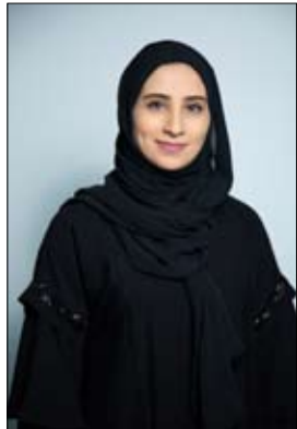
دبي - وام

نظمت الهيئة الاتحادية للموارد البشرية الحكومية، مؤخراً، الجلسة الافتراضية الثالثة لنادي الموارد البشرية خلال العام 2023، تحت عنوان «COP28.. آفاق واعدة لمستقبل مستدام»، والتي تابعها أكثر من 300 موظف ومنتسب للنادي من داخل الدولة وخارجها. واستضافت الجلسة، السيدة ضحى الملا، رئيسة قسم الشؤون المحلية للتغير المناخي بوزارة التغير المناخي والبيئة، التي أطلعت المتابعين على مسيرة الإمارات نحو الاستدامة البيئية والمناخية، وأهداف مؤتمر الأطراف «COP28»، الذي تستضيفه الدولة خلال الفترة ما بين 30 نوفمبر و12 ديسمبر المقبلين. واستعرضت الجلسة دور دولة الإمارات العربية المتحدة في تحقيق التنمية