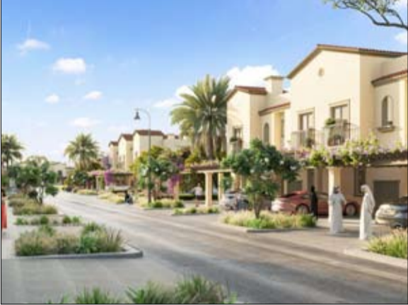
علق ستيوارت شيلد، رئيس جوائز العقارات الدولية:

أود أن أقدم بأحر التهاني للشركات الفائزة على الجهود الرائعة المبذولة من أجل تحقيق هذا النجاح. هذه الجائزة هي واحدة من الجوائز الأكثر شهرة في المنطقة، ويعتبر هذا النجاح امتيازاً معترف به لأفضل الشركات العقارية. وتعتبر جوائز العقارات العربية جزءاً من جوائز العقارات الدولية، وهي أحد أهم الجوائز المرموقة في المنطقة. حيث يشارك بها العديد من الشركات العقارية في المنطقة لاستعراض أبرز إنجازاتهم والمنافسة ضمن فئات الجوائز المختلفة.