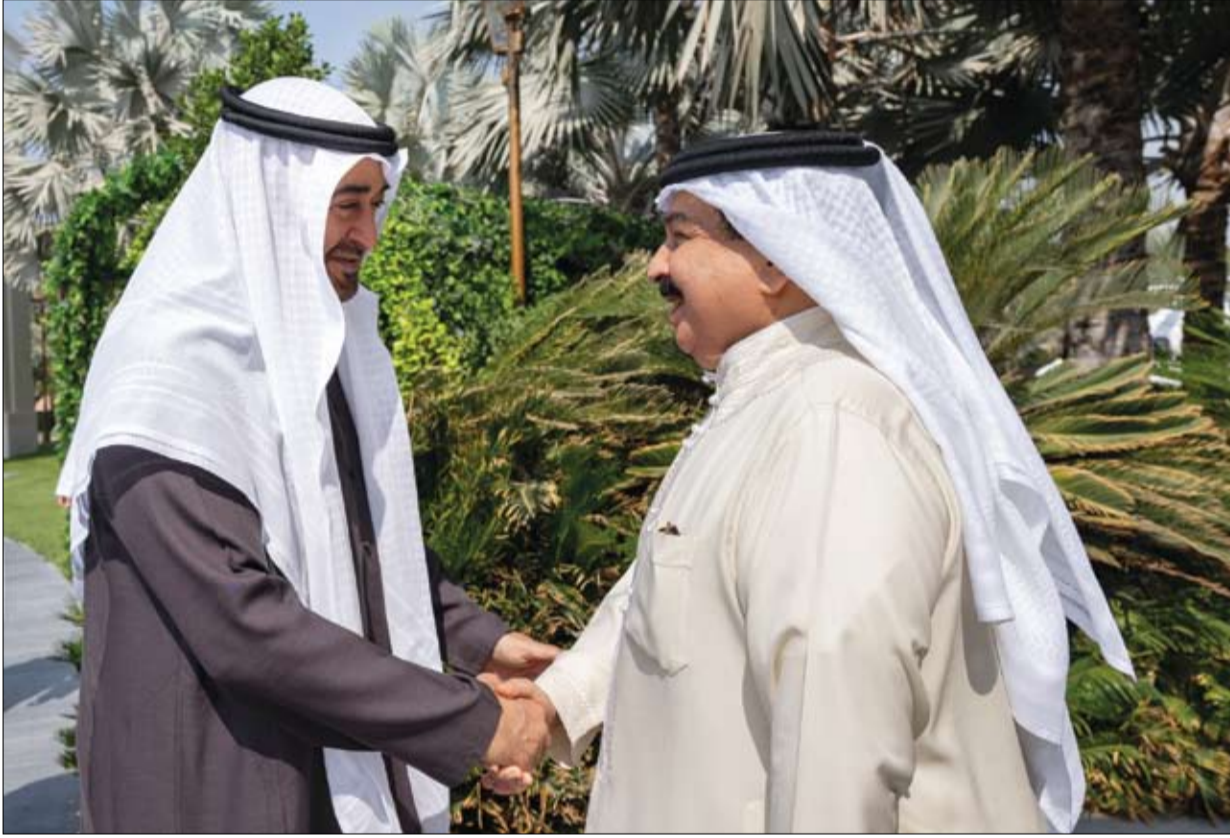
رئيس الدولة خلال زيارته ملك البحرين بمقر إقامته في أبوظبي

زار صاحب السمو الشيخ محمد بن زايد آل نهيان رئيس الدولة بحفظه الله، أخاه صاحب الجلالة الملك حمد بن عيسى آل خليفة عاهل مملكة البحرين الشقيقة في مقر إقامته في أبوظبي. وتبادل سموه وجلالة الملك حمد بن عيسى خلال اللقاء، الأحاديث الودية التي تعبر عما يجمع دولة الإمارات ومملكة البحرين الشقيقة من أواصر أخوية متجددة والحرص المشترك على تعزيز التعاون والتنسيق بينهما على جميع المسارات بما يخدم مصالحهما المتبادلة ويوليى تطعات شعبيهما إلى التنمية والازدهار. وأعرب صاحب السمو رئيس الدولة وجلالة الملك حمد بن عيسى خلال اللقاء .. عن اعتزازهما بالعلاقات الأخوية الراسخة التي تجمع دولة الإمارات العربية المتحدة ومملكة البحرين وشعبيهما الشقيقين والتي تجسدها مواقف المشتركة للبلدين تجاه مختلف القضايا. كما تطرق اللقاء إلى التطورات الخطيرة في المنطقة والأوضاع الإنسانية المتفاقمة التي يشهدها قطاع غزة وضرورة الدفع نحو مسار السلام لتحقيق الاستقرار والتنمية لشعوب المنطقة. حضر اللقاء.. سمو الشيخ حمدان بن محمد بن زايد آل نهيان ومعالي الشيخ محمد بن حمد بن طهون آل نهيان مستشار الشؤون الخاصة في ديوان الرئاسة ومعالي علي بن حماد الشامسي الأمين العام للمجلس الأعلى للأمن الوطني ومعالي الدكتور سلطان بن أحمد الجابر وزير الصناعة والتكنولوجيا المتقدمة. (التفاصيل ص2)