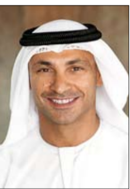
مديري المدارس والمعلمين وأولياء الأمور والطلاب وقد أصبحوا صانعين لثقافة مدرسية تشتهر عالمياً بتنوعها وجودتها، كما سئرى التعليم في دبي يشغل موقعه من بين الأفضل في العالم". وتضم إمارة دبي 220 مدرسة خاصة توفر 17 منهاجاً تعليمياً متنوعاً لأكثر من 180 جنسية وثقافة ويتلقى أكثر من ثلاثة أرباع الطلبة تعليماً ضمن فئة جيد أو أفضل، كما يتلقى 76% من الطلبة الإماراتيين تعليماً ضمن فئة جيد أو أفضل.

لديهم، وقال سعادة ضرار بالهول الفلاسسي، المدير التنفيذي لمؤسسة وطني الإمارات "تطلق فعاليات مبادرة «حماة العلم» لتطلق للسنة الحادية عشرة على التوالي وتضخ المؤسسة بالتزام المجتمع الإماراتي بالقيم والمبادئ الوطنية، ويدورها الفعاليات في تعزيز هذه الثقافة وحث جميع المواطنين والقيمين على أرض دولتنا الحبيبة على المشاركة الفعالة في هذا الجهد الوطني للحفاظ على هويتنا الوطنية، ونوجه الشكر إلى كل من شارك ويشارك في هذه المبادرة الوطنية مؤكداً عزمنا على مواصلة السعي للوصول إلى مجتمع يعي قيمنا الوطنية".