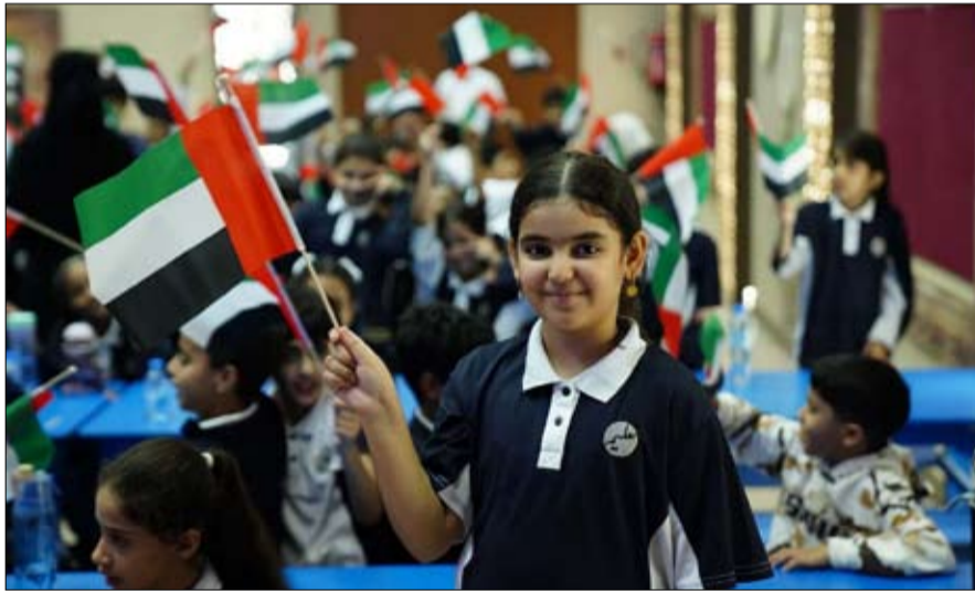
ورايته ومكتسبات الاتحاد. وانطلقت فعاليات المبادرة في آخر أسبوع من شهر سبتمبر الماضي وتنتهي في نوفمبر المقبل بالزيارات الميدانية لتوزيع الأعلام وتقديم ورشة العلم في أنحاء الدولة للفتيات المستهدفة. وتهدف الحملة إلى نشر وتعزيز ثقافة احترام العلم والحفاظ عليه من خلال توعية الأفراد بمختلف شرائحهم حول بروتوكول العلم والطرق الصحيحة للحفاظ عليه والتعامل معه دون تعريضه للإهانة أو التلف. وتشجع الحملة التي تستهدف المدارس الحكومية والخاصة والجامعات الحكومية والخاصة والشركاء والجهات المتعاونة ومراكز الرعاية الصحية ومجالس الأحياء على تعزيز التعاون بين أفراد المجتمع في رفع راية الوطن بشكل لائق ما يسهم في تعزيز حس المسؤولية الوطنية

أطلقت مؤسسة وطني الإمارات مبادرة «حماة العلم» للسنة الحادية عشرة على التوالي، في إطار حرصها على نشر ثقافة احترام العلم والحفاظ عليه بصفته رمزا وطنيا لدولة الإمارات وسيادتها واستقلالها وهويتها وتاريخها. وتعد «حماة العلم» إحدى مبادرات يوم العلم التي اعتمدها صاحب السمو الشيخ محمد بن راشد آل مكتوم، نائب رئيس الدولة، رئيس مجلس الوزراء، حاكم دبي، رعاه الله، لتغدو مناسبة سنوية يشارك فيها جميع أفراد المجتمع للتعبير عن فخرهم واعتزازهم بالوطن