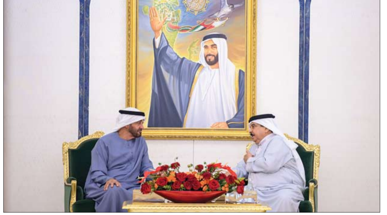
قدم لسموه التعازي بوفاة سعيد بن زايد