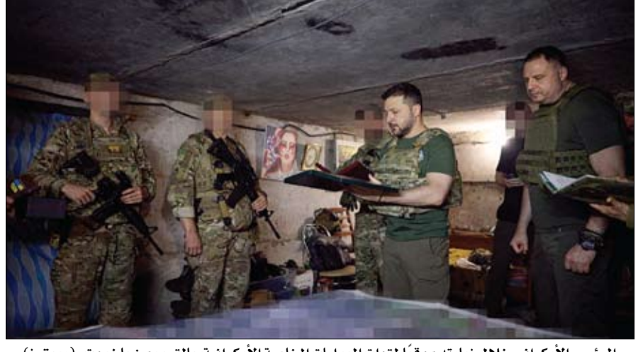
الرئيس الأوكراني خلال زيارته موقفاً لقوات الخاصة الأوكرانية، بالقرب من باخموت.

تونس تؤكد وجود 80 ألف مهاجر أفريقي على أراضيها تونس-وكالات: كشفت تونس لأول مرة عن عدد المهاجرين الأفارقة على أراضيها، في تصريح بثته وزارة الداخلية، إن 80 ألف مهاجر من دول جنوب الصحراء يتواجدون في البلاد. يتواصل في مدن الجنوب التونسي إيواء مئات المهاجرين غير النظاميين وقال وزير الداخلية التونسي كمال الفتحي، إن 80 ألف مهاجر من دول أفريقيا جنوب الصحراء يتواجدون في البلاد، وهو أول رقم رسمي يصدر عن السلطات في ظل الأزمة المتفاقمة للمهاجرين غير النظاميين في تونس. وأفاد الوزير بتصريح تلفزيوني، أن نحو 17 ألف من المهاجرين الوافدين على البلاد يتواجدون في مدينة صفاقس، التي تمثل نقطة استقطاب في مسعى للعبور انطلاقاً من سواحلها إلى الجزر الإيطالية القريبة عبر قوارب المهاجرين. أكد المتحدث باسم الكرملين، أمس الاثنين، أن هجوم أوكرانيا المضاد الذي أطلقته كييف مطلع يونيو الفائت فاشل، مبيّناً أنه يهدر موارد حلف الأطلسي العسكرية. وقال دميتري بيسكوف للصحفيين إن مساعدات الناتو التي تقدر بمليارات الدولارات تنفذها أوكرانيا بشكل غير فعال وبلا هدف، مشيراً إلى أن هجوم أوكرانيا المضاد لا يعمل كما هو مخطط له. كما بين أنه تم اتخاذ إجراءات لمنع ضربات الميقات الأوكرائية في موسكو ومناطق أخرى. كذلك وصف الكرملين الضربات الأوكرانية على أراضي روسيا بأنها أعمال يائسة، وقال إن موسكو ستكافح هذه الأعمال الإرهابية. هذا وأكد الكرملين، أمس