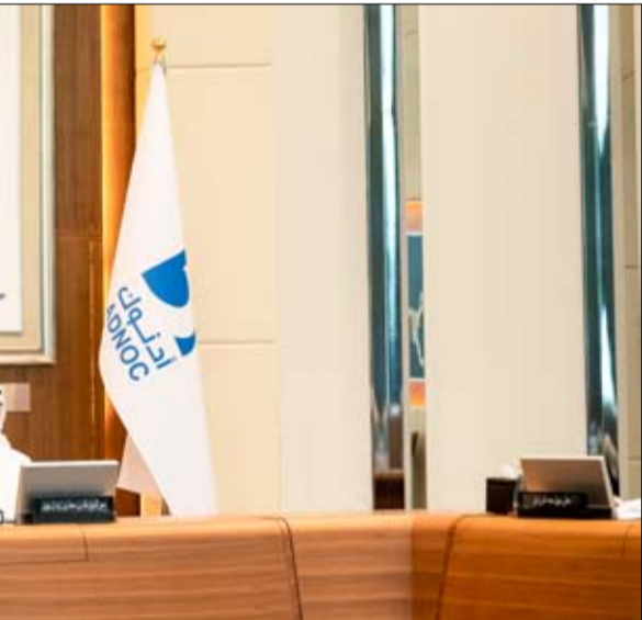
ترأس اجتماع اللجنة التنفيذية لمجلس إدارة أدنوك

شركات الطاقة الرائدة والمعلماء وقادة التكنولوجيا للتعاون في تنفيذ خطتها لخفض الانبعاثات. وأطلع سموه وأعضاء اللجنة التنفيذية على نتائج أداء "أدنوك" في مجال خفض الانبعاثات الكربون لعام 2022 في أعمال الشركة في مجال الاستكشاف والتطوير والإنتاج، والذي بلغ نحو 7 كيلوجرامات من مكافئ ثاني أكسيد الكربون لكل برميل من المكافئ النشط، وذلك ضمن جهودها للإسهام في مواكبة الطلب العالمي المتنامي على الطاقة بشكل مسؤول. وحققت "أدنوك" في عام 2022 نتائج رائدة، حيث بلغت نسبة كثافة انبعاثات الميثان قرابة 0.07%، وتم منحها "مسار المبحر الذهبي" لإطار عمل "شركة النفط والغاز والميثان 2020". كما حققت "أدنوك" في عام 2022 خفضاً في انبعاثات غازات الاحتباس الحراري بلغ 4 ملايين طن تقريبا، وذلك من خلال الحصول على 100% من احتياجات الشبكة الكهربائية لمعاملاتها البرية من مصادر الطاقة الشمسية والنووية، كما حققت كذلك خفضاً بلغ نحو 1 مليون طن متري من خلال تنفيذ مشاريع لرفع كفاءة الطاقة والحد من عمليات حرق الغاز، وتعكس هذه النتائج التي تم تأكيدها بشكل مستقل من قبل شركة "دي إن إي"، مكانة "أدنوك" الرائدة ضمن منتجي النفط والغاز الأقل