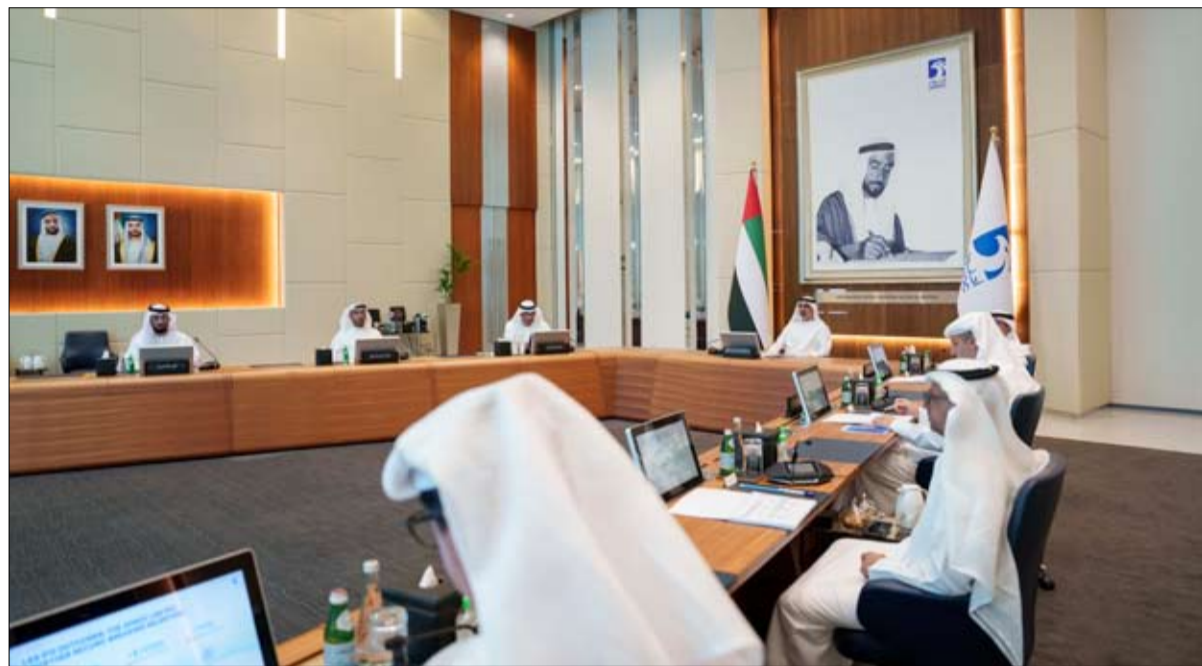
ترأس اجتماع اللجنة التنفيذية لمجلس إدارة أدنوك