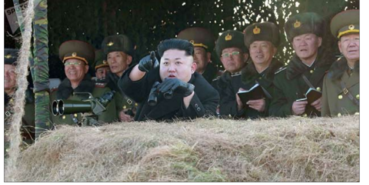
كيم جونج أون يرغب في صفقة