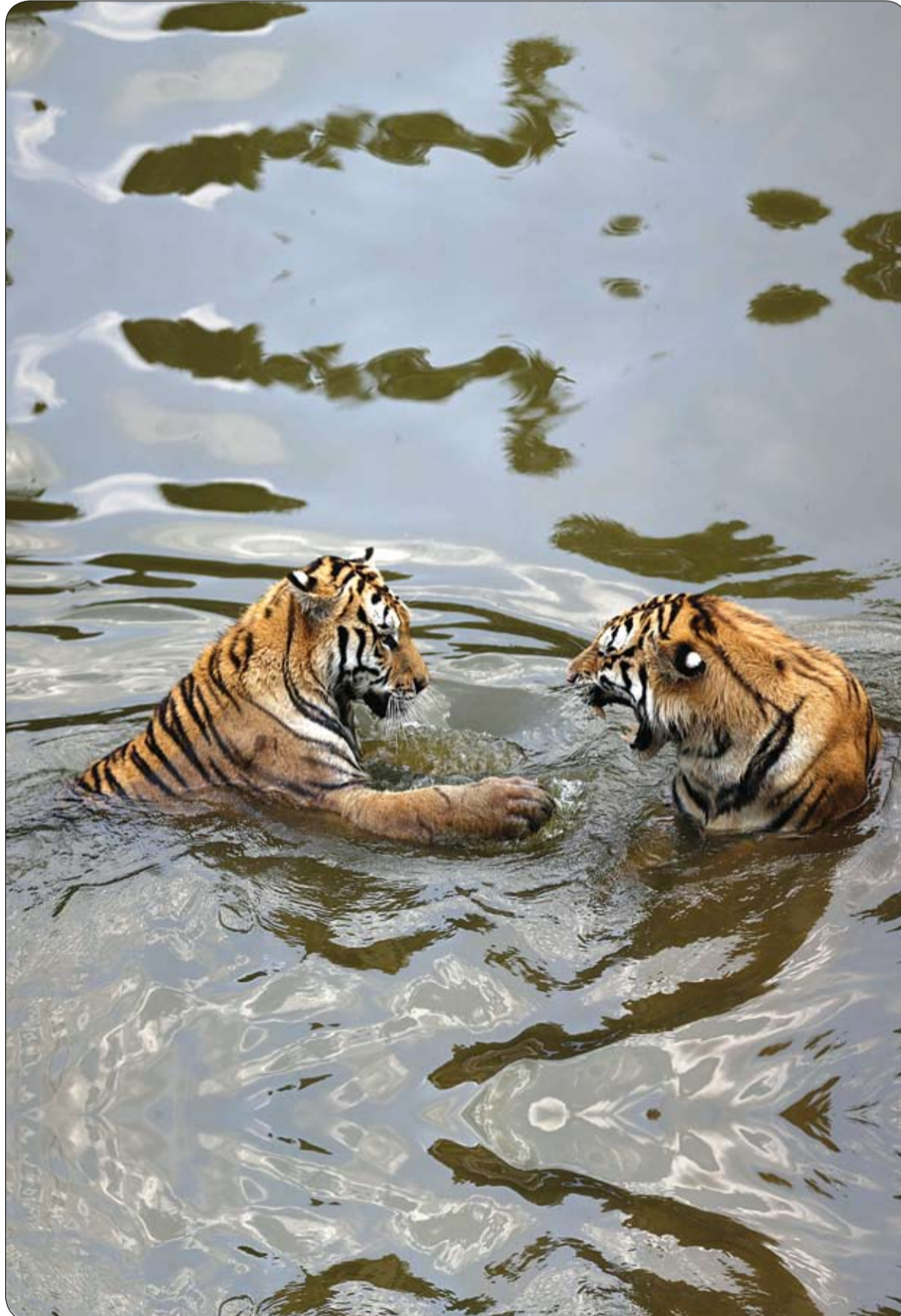
نمران سيبيريان يلهوان في الماء خلال يوم حار في حديقة حيوان النمر في هوانغشان بمقاطعة انهوي، الصينية.