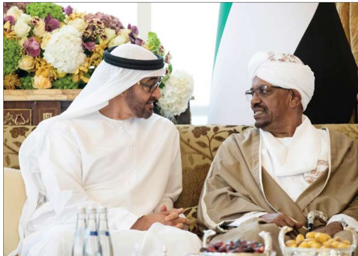
محمد بن زايد خلال استقباله الرئيس السوداني