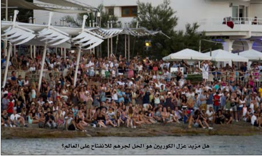
هل مزيد عزل الكوريين هو الحل لجرهم للانفتاح على العالم؟

- لا تأثير للانتقام الاقتصادي على تطوير البرامج المثيرة للجدل في كوريا الشمالية