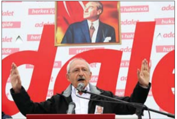
كمال قليتش دار أوغلو عنقاء تنهض من رماها

حدود 25 بالمانه. رقم لا يمكن تجاوزه لتنظيم مهووس بالدفاع عن علمانية صارمة، عاجز على التحدث إلى الجماهير الحضريه شامل حزب الشعب الجمهوري، بحلم مجددا: سننوز في انتخابات عام 2019 الخارجية الكوييتي - ان هذا وسننقط الرئيس أردوغان من قصره، وعد لن يبريد الاستماع اليه هذه الأيام.