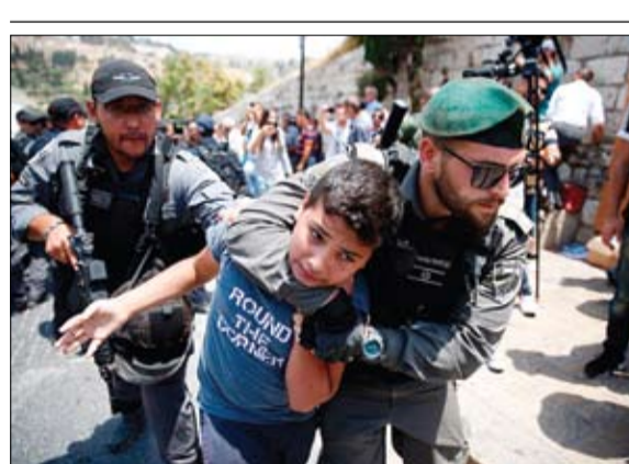
قوات الاحتلال تمسك على طفل فلسطيني خلال الاحتجاجات خارج الأقصى

القرن الماضي وتلمس دولة الإمارات لخطر التطرف الإسلامي والجهادي منذ الثمانينيات وقيامها بوضع سياسات وتدابير لتكافحه. وأشار إلى أن الأزمة الحالية ذات أبعاد تتجاوز الساحة المحلية لدول التعاون .. منوها إلى ضرورة وضع حد للدعم الرسمي للتطرف والجهادية والإرهاب في مختلف أرجاء العالم العربي. وذكر معالي الدكتور قرقاش أن الأزمة الحالية ليست مرتبطة بإيران بشكل رئيسي وإن كانت مستفيدة منها .. وقال: إن المشكلة الأساسية مع قطر هي تحالفها مع الفكر المتطرف وقيامها بإنفاق المليارات لدعم أفراد ومنظمات إرهابية بعضها مرتبط بتنظيم القاعدة .. مشيرا إلى سعي دولة الإمارات لحل