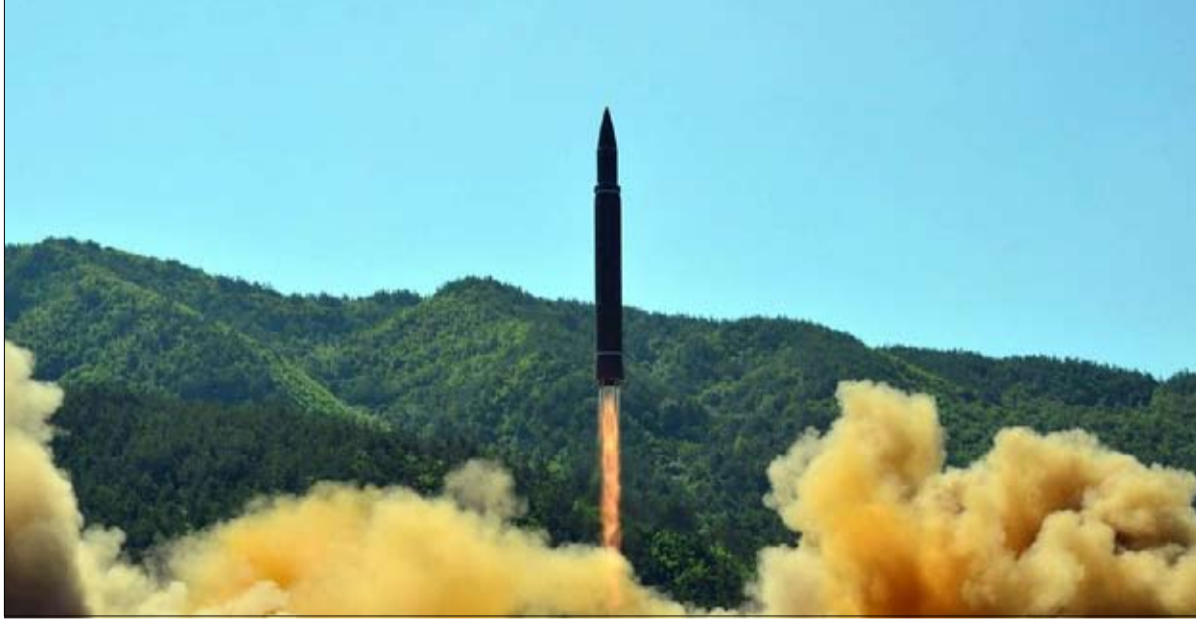
اية حلول لهذا السباق المحموم