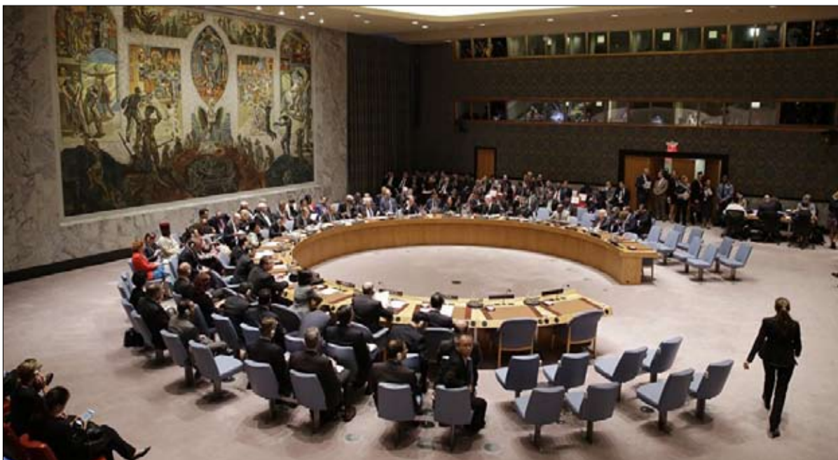
العقوبات الدولية لا تأثير لها

باحث في معهد شرق آسيا (مدرسة المعلمين العليا في نيون) وجامعة فيينا