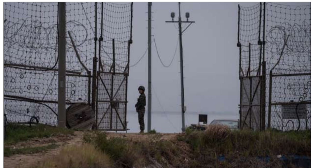
حدود قد تتحول الى برميل بارود

•• الفجر - ثيو كليمنت - ترجمة خيرة الشيباني