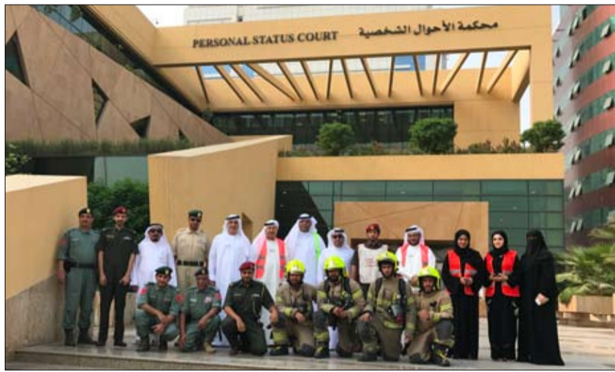
الإخلاء والإسعاف، بالإضافة إلى الجهود المتميزة من قبل مرشدي الأمن والسلامة والحماية المدنية، وشرطة دبي، والمواطنين ووصولهم إلى نقاط التجمع.