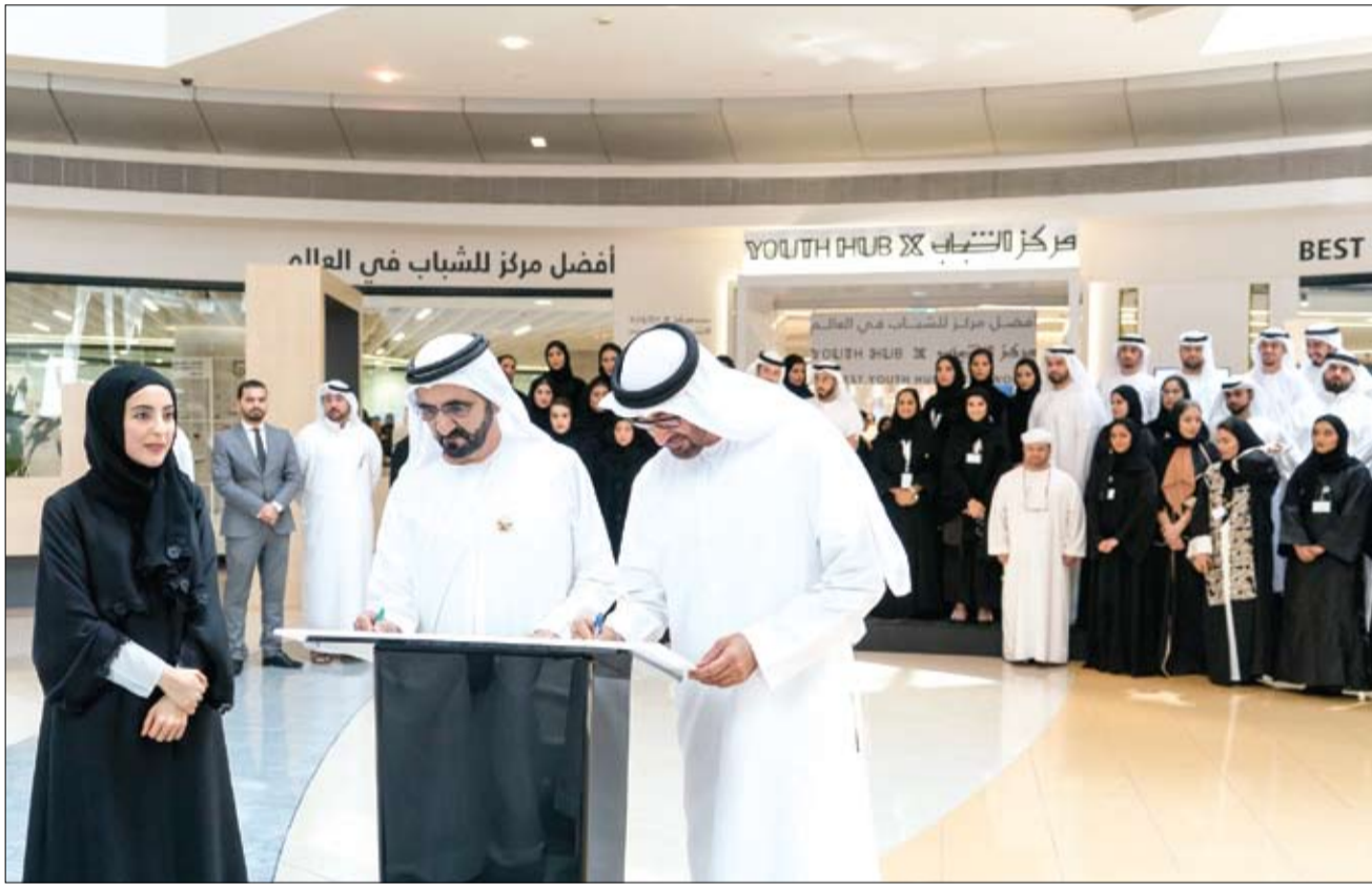
محمد بن راشد ومحمد بن زايد يوقعان خلال تدشينهما مركزاً للشباب يعتبر الأفضل عالمياً والأكثر شمولاً لمتطلبات الشباب (وام)

دبي-وام: افتتح صاحب السمو الشيخ محمد بن راشد آل مكتوم نائب رئيس الدولة رئيس مجلس الوزراء حاكم دبي وصاحب السمو الشيخ محمد بن زايد آل نهيان ولي عهد أبوظبي نائب القائد الأعلى للقوات المسلحة - في دبي امس- مركزاً للشباب يعتبر الأفضل عالمياً والأكثر شمولاً لمتطلبات الشباب دون الثلاثين عاماً ويضم مساحات للإعلاميين الشباب وأصحاب الأعمال والباحثين والمبرمجين وهواة الألعاب الشباب وله أجندة سنوية مليئة بالفعاليات والبرامج. كما يضم المركز - الذي صممه الشباب دون الثلاثين عاماً وجاء نتيجة لأفكارهم - قاعات لاجتماعاتهم ومساحات للاحتضان مشاريعهم ومكتبة لتنمية معارفهم ومسرحاً ومرسماً واستوديو لإنتاجاتهم الإبداعية. ويوفر المركز - الذي يقع في أبراج الإمارات - حصصاً وورش عمل في مختلف مهارات الحياة ومساحات للاحتضان مشاريع رواد الأعمال والشباب ويضم مكاتب للشباب وفرصاً للتطوع والتدريب ومختبراً لايتكار الحول وعقد جلسات العصف الذهني ومقهى شبابياً يتغير كل عام ومنصة ومسرحاً للفعاليات الشبابية. ووجه صاحب السمو الشيخ محمد بن راشد آل مكتوم وصاحب السمو الشيخ محمد بن زايد آل نهيان بتعميم نموذج المركز على كافة أنحاء الدولة لتكون مراكز الشباب الجديدة ملتقيات لتنمية الشباب ومنصات ينطلقون منها لخدمة الوطن ومساحات تساعدهم في بناء مستقبلهم وصناعة إبداعات ومشاريع تغير مستقبل وطنهم. (التفاصيل ص2)