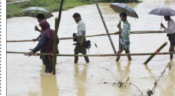
اللاجئون الروهينغا يسرون عبر مياه الفيضانات في معسكر للاجئين في بنغلادش

عواصم-وكالات: سيطر الجيش الوطني على عدد من المرتفعات الاستراتيجية في جبهة هيلان والمضج في صروح حيث سيطر على ثلاثة مرتفعات هامة، وفق موقف القوات. كما صدت قوات الشرعية بالمنطقة العسكرية الثالثة هجوماً للميليشيات على جبهة جبال الشجج وهيلان قبل أن تتقدم للسيطرة على ثلاثة مرتفعات في تبة العلم والثبة الحمراء ووادي جهم، ما يجعل منطقة جبال هيلان تحت السيطرة شبه الكاملة لقوات الشرعية. من جهة أخرى، أفاد مصدر عسكري بأن أكثر من 20 عنصراً