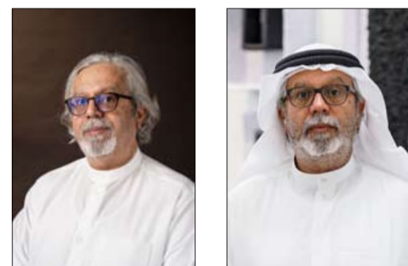
•• أبو ظبي - الفجر: