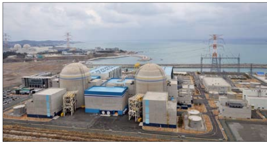
الخروج من عالم الطاقة النووية

هذا ما قد يُسمّى هزيمة قوية. بعد خمسة أسابيع من وصوله الى الرئاسة الكورية الجنوبية، أعلن مون جاي اين، الاثنين، وقف جميع مشاريع بناء مفاعلات نووية جديدة. كما تعهد بعدم تمديد تشغيل تلك تقترب من نهاية دورتها الأولية بين ثلاثين وأربعين عاما