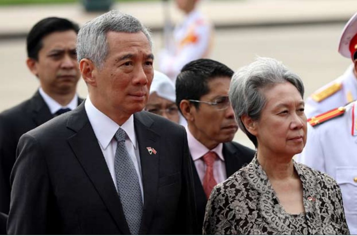
رئيس الوزراء وزوجته في حفل الافتتاح