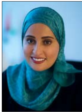
معالي عهد الرومي