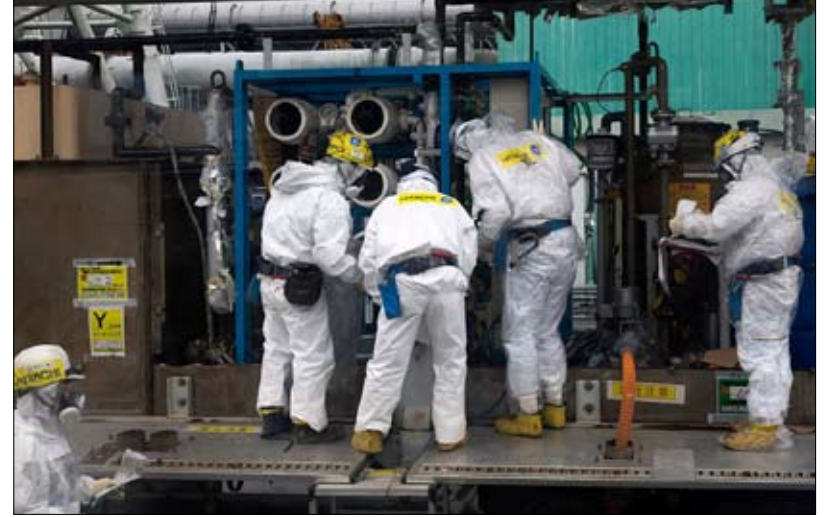
حياة الناس والسلامة النووية