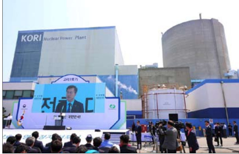
تقديم النووي الكوري الجنوبي