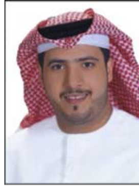
شبيخة آل علي