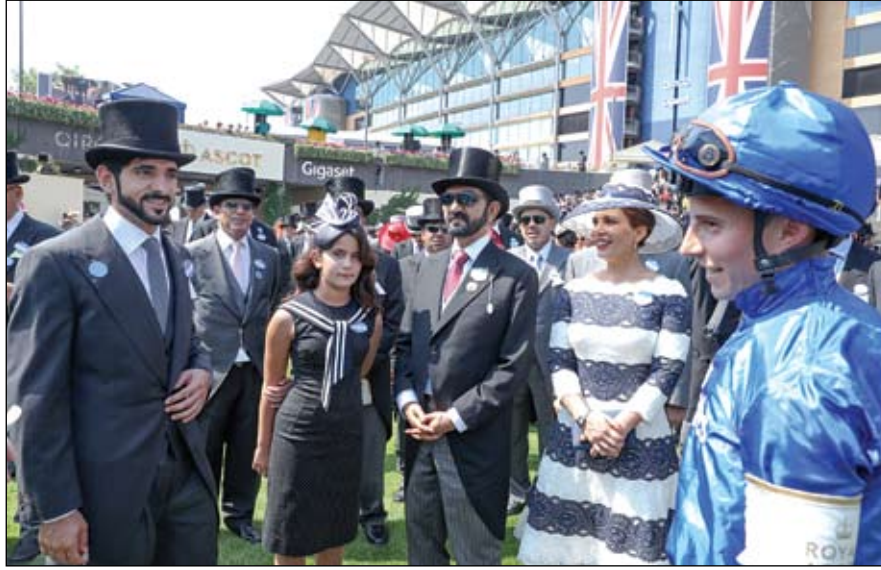
محمد بن راشد خلال حضوره مهرجان رويال اسكوت في بريطانيا

باريس - وام: وصل صاحب السمو الشيخ محمد بن زايد آل نهيان ولي عهد أبوظبي نائب القائد الأعلى للقوات المسلحة الى باريس امس في زيارة عمل للجمهورية الفرنسية تستغرق يومين . ويجري سموه خلال الزيارة محادثات مع إيمانويل ماكرون رئيس جمهورية فرنسا وكبار المسؤولين في الحكومة الفرنسية حول تعزيز وتطوير التعاون الاستراتيجي المشترك بين البلدين وبحث مجمل القضايا الإقليمية والدولية ذات الاهتمام المشترك. وكان صاحب السمو الشيخ محمد بن زايد آل نهيان ولي عهد أبوظبي نائب القائد الأعلى للقوات المسلحة قد غادر القاهرة امس بعد زيارة أخوية لجمهورية مصر العربية الشقيقة. كان في وداع سموه لدى مغادته مطار القاهرة الدولي فخامة الرئيس عبدالفتاح السيسي. (التفاصيل ص2)