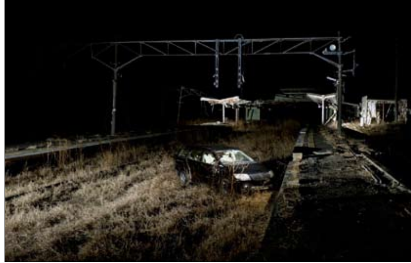
كارثة فوكوشيما اربعبت الشرق الاقصى