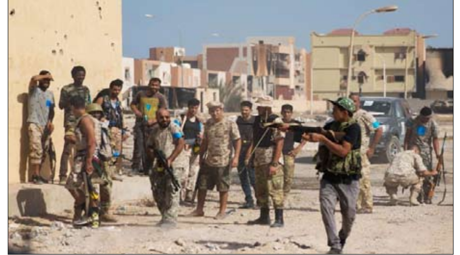
الليبية المقاتلة، تسعى الى اشعال فتيل طرابلس

الغارين من مدينتهم، وعدد من الإرهابيين، يقومهم عدد من القيادات ذات العلاقات القطرية والجماعات الإرهابية، وهي الذراع المسلح لحزب الوطن الإسلامي الذي يتزأسه عبدالحميد بلحاج، ومدعومين من علي الصلابي أحد قيادات الإخوان المسلمين، للانطلاق والهجوم على مطار طرابلس من تمركزات في منطقة سوق الأحد والتجهيزات عبر الطرق الفرعية القادمة من مدن مسلاتة وزليتن والخمس ومصراتة، حيث تحركت عشرات الآليات الثقيلة والدرعة لتلا، عبر