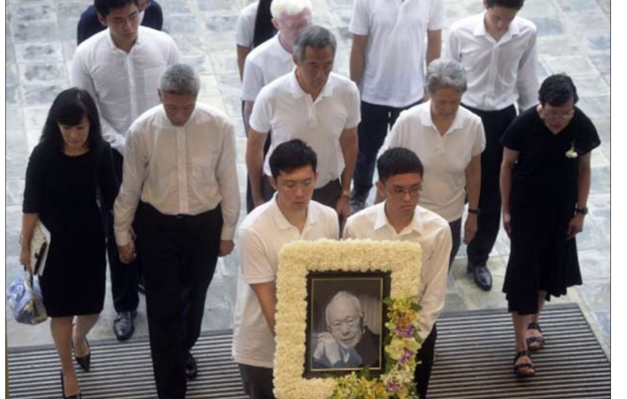
الفرقاء في جنازة الوالد