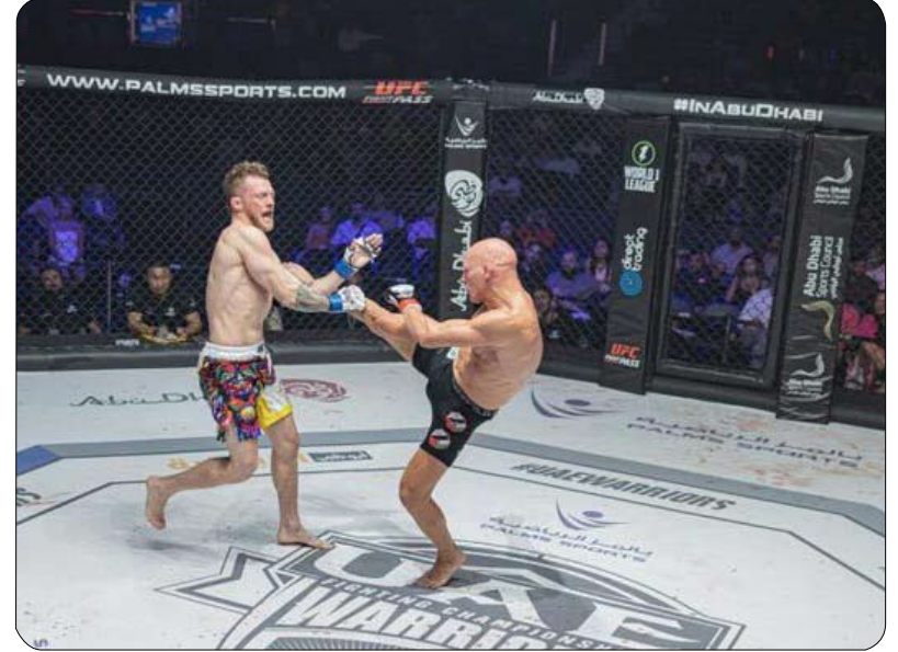
استضافت عشرات البطولات العالمية