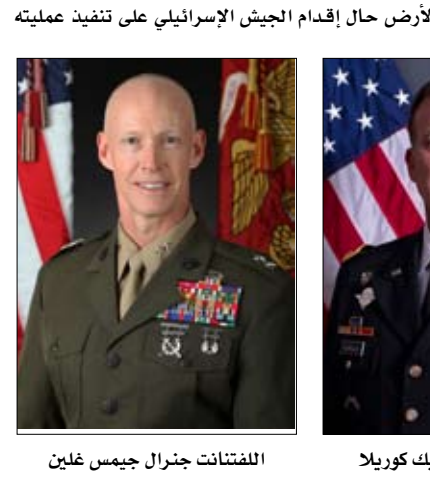
الجنرال مايكل إريك كوريلا الفتنات جنرال جيمس غلين

من معلومات عن أرض الحركة. ويبين حسن أنه مع قدوم جزء كبير من البحرية الأمريكية لشرق المتوسط في سياق تطورات الأوضاع في قطاع غزة وعمليات تقادم الصراع لستوى الحرب الإقليمية، حتم على الولايات المتحدة توفير مظلة حماية للمجموعات القتالية لحاملي الطائرات أيزنهاور وجيرالد فورد، فضلاً عن توفير وسائل الدفاع الجوي للحماية من موجات الإغراق الصاروخي التي اشتهرت بها صراعات الشرق الأوسط خلال العقدين الماضيين.