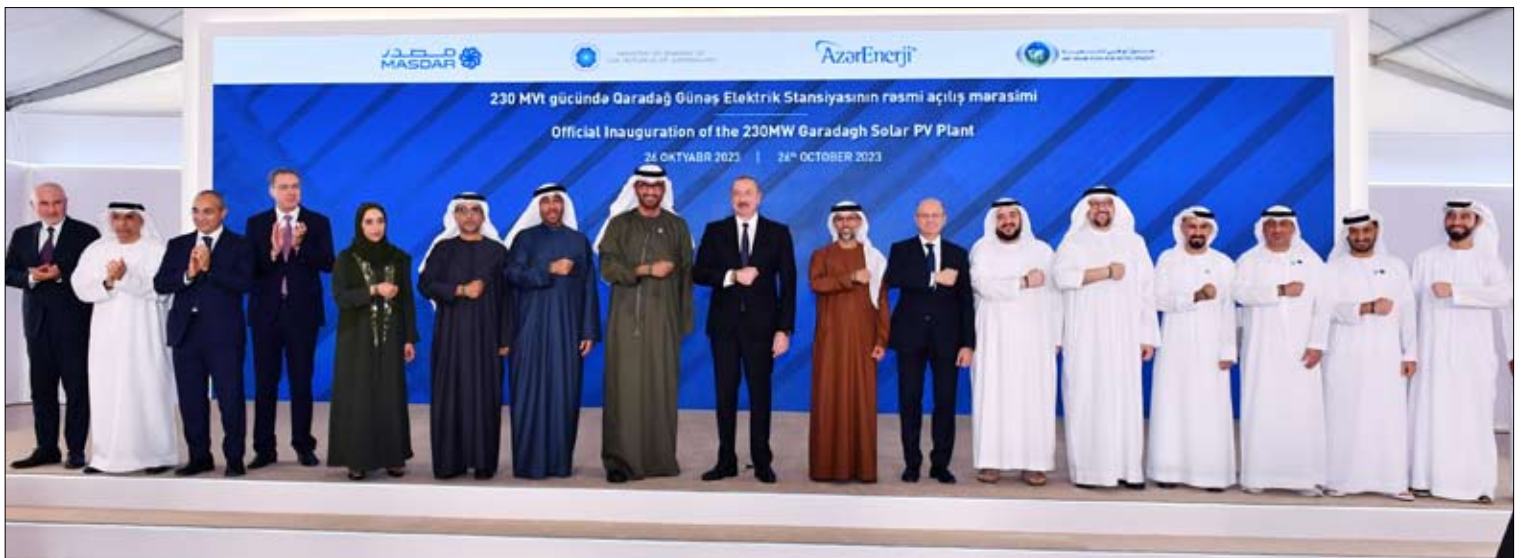
بحضور رئيس أذربيجان، وسلطان الجابر، رئيس مؤتمر الأطراف COP28