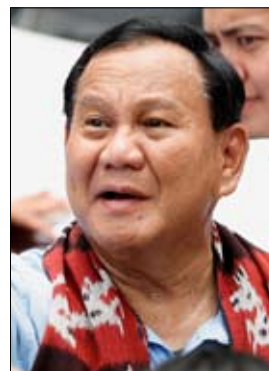
•• جاكارتا- رويترز

سجل وزير الدفاع الإندونيسي برابو سوبيانتو أمس الأربعاء نفسه لدى هيئة الانتخابات في البلاد كمرشح رئاسي في الانتخابات المقررة العام المقبل. كما ترشح معه لمنصب نائب الرئيس جبران راكابومينج رাকা، الابن الأكبر للرئيس المنتهية ولايته جوكو ويدودو. وتعد برابو، وهو قائد سابق للقوات الخاصة، بمواصلة الجهود لتطوير الصناعات التحويلية وبناء عاصمة جديدة بالإضافة إلى إنشاء وكالة معنية بالإيرادات الحكومية إذا فاز في الانتخابات العام المقبل. وسيسمى، وفقاً لوثيقة اطلعت عليها رويترز، أيضاً إلى تحقيق الاكتفاء الذاتي من الغذاء والطاقة والمياه.