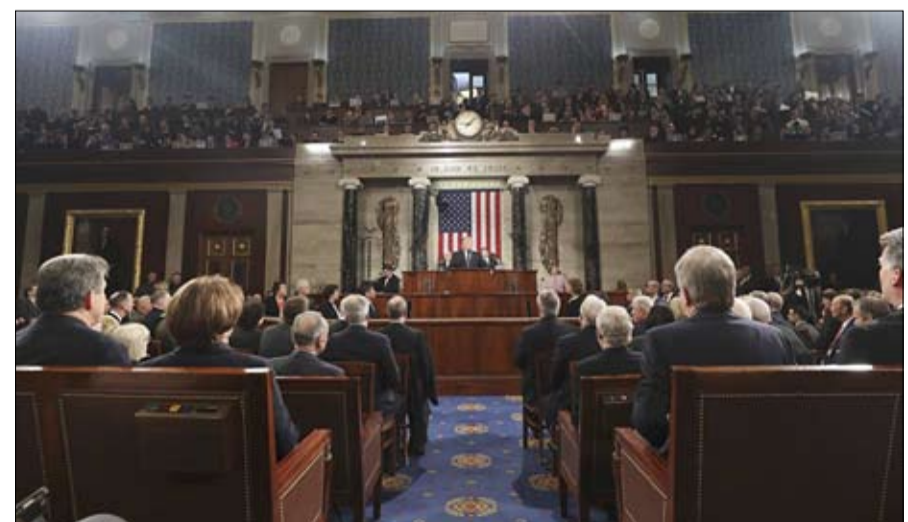
الكونغرس يجهض حلم التطبيع بين روسيا وأمريكا