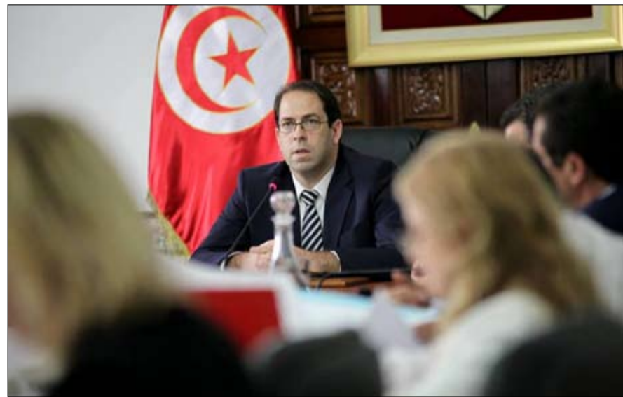
اي طبخة تعد لرئيس الحكومة؟

- وثيقة قرطاج لا تمنع أحدا من داخل الحكومة او خارجها من ان يكونوا مستقبلا من المنافسين