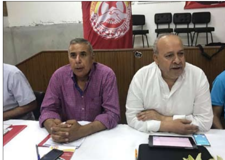
الطاهري - يمين: ما يحدث تحضير لانقلاب