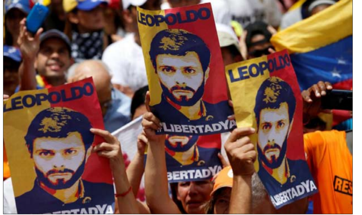
المعارضة تحتل الشارع