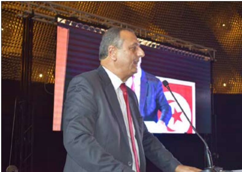
عصام الشابي الغنوشي مرشح للرئاسة

2019 وأنه ليس معنيا إلا بإدارة الشأن العام في تونس، خاصة الاقتصادي وتنظيم انتخابات بلدية ثم تشريعية ورئاسية. كما أشار الغنوشي إلى أنه لا بد من توحيد وزاري، كما أشار إلى وجود مناصب شاغرة ووزارات دون وزراء على حد تعبيره. وأضاف أن لقاء قريبا سيعقد في إطار تنسيقية الأحزاب الحاكمة من أجل اتخاذ قرار في هذا الشأن.