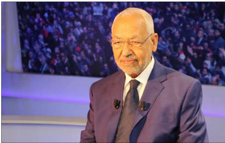
راشد الغنوشي في بدلة رئاسية

- عصام الشابي: أصبح واضحا أن الغنوشي سيترشح للانتخابات الرئاسية