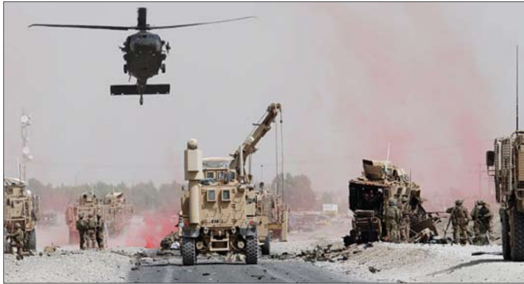
قوات أمريكية تعانين موقع الانفجار وحجم الأضرار في قافلة النانو

عواصم-وام: أكد الرئيس المصري عبد الفتاح السيسي أن سياسة بلاده الخارجية تقوم على التعاون من أجل البناء والتنمية وليس التآمر أو التدخل في شؤون الدول الأخرى. جاء ذلك خلال استقبله أمس بشارع عيسى جاد الله وزير الدفاع التشادي. وقال السفير علاء يوسف المتحدث باسم الرئاسة المصرية إن الجانبين ناقشا سبل الارتقاء بالتعاون العسكري والأمني خلال الفترة المقبلة وتطرقا إلى بعض الملفات الأفريقية ذات الاهتمام المشترك. وأعرب المسؤول التشادي عن تقدير بلاده لدور مصر على الساحتين العربية والأفريقية.. مشيرا إلى حرص تشاد على تكثيف التعاون العسكري والتنسيق مع القاهرة في مجال مكافحة الإرهاب وتأمين واحكام السيطرة على الحدود والاستفادة من الخبرة المصرية في هذه المجالات. خاصة في ضوء التحديات المشتركة التي تواجهها الدولتان أخذا في الاعتبار ما تشهده ليبيا ومنطقة الساحل من عدم استقرار.