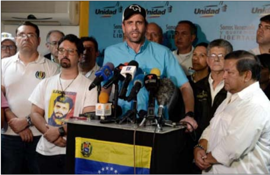
هنريك كابريليس الانتخابات باطلة ولاغية

والدليل، رة خليفة هوغو شافيز في خطاب متلفز على الإجراءات الأميركية؛ لن انصاع لأوامر الإمبريالية، ولا الحكومات الأجنبية، أنا رئيس حر. وحسب الرئيس الفنزويلي، تؤكد قرارات الحكومة الأميركية عجزها وأنها وكراهيتها" إثر تصويت الأحد 30 يوليو. وأضاف الرئيس الاشتراكي، انهم يعاقبونني لأنني لا انصاع لأوامر الحكومات الأجنبية، وليتخذوا ما يحلو لهم من عقوبات، إلا ان الشعب الفنزويلي قرر أن يكون حراً. والسؤال.. هل مازال بالإمكان تفادي احتضار فنزويلا؟