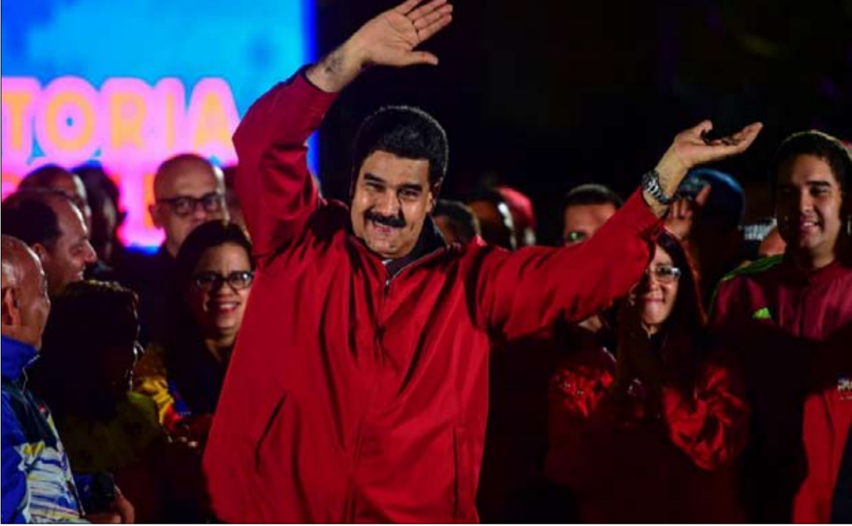
مادورو الرقص على الجراح