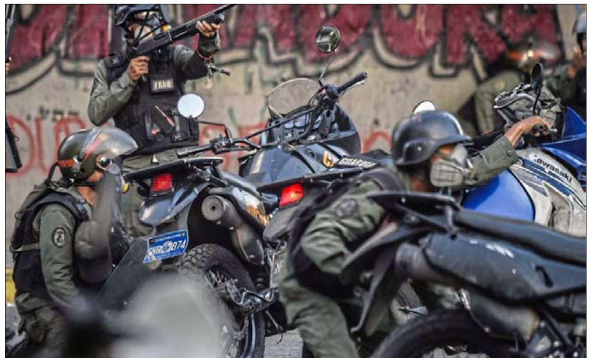
السلطة ترد بعنف على الحركة الاحتجاجية