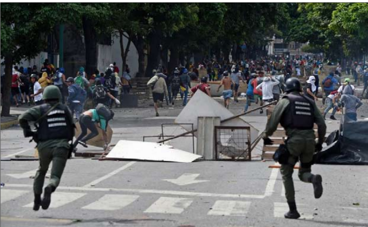
اقدام اسوا من هذه المشاهد

في الواقع، ستمنح الجمعية التأسيسية المزيد من الصلاحيات لرئيس الدولة، وستختلف على برلمان يملك الاغلبية فيه نواب المعارضة التي كانت دعت إلى مقاطعة الانتخابات. "أنا لا نعترف بهذه العملية الاحتياطية، أكد هنريك كابريليس زعيم المعارضة، انها لاغية وباطلة،