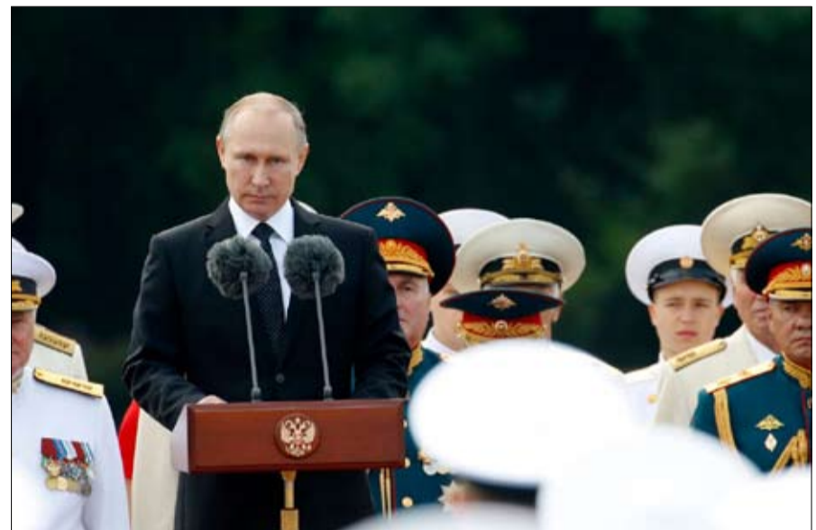
بوتين في استعراض للقوة البحرية