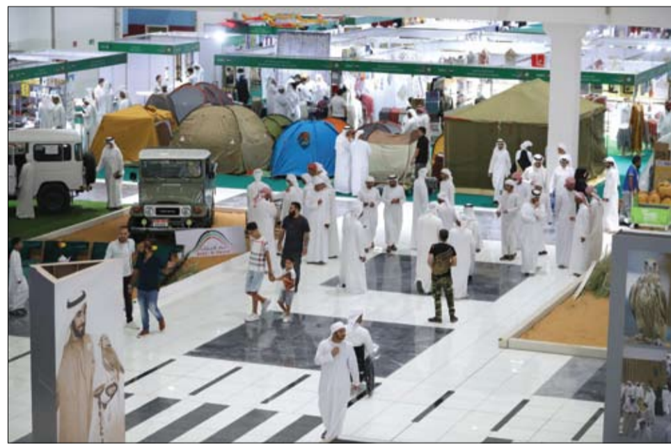
متجددة"، وذلك برعاية رسمية من هيئة البيئة - أبوظبي، الصندوق الدولي للحفاظ على الحبارى، مركز أبوظبي الوطني للمعارض حيث يُقام الحدث، الراعي الذهبي شركة SCHIWI الألمانية، شريك القطاع "كراكال"، وشريك

صناعة السيارات ARB الإمارات. والشركاء الداعمون للحدث الداخلية، شرطة أبوظبي، لجنة إدارة المهرجانات والبرامج الثقافية والتراثية، نادي تراث الإمارات، جمعية الإمارات للخيول العربية، غرفة أبوظبي، وغرفة التجارة البريطانية بأبوظبي. وشركاء الصناعة كل من الاتحاد العالمي للصفارة والمحافظة على الطيور الجارحة، المؤسسة الأوروبية للصفارة والمحافظة على الطبيعة، اتحاد الإمارات للفرسية والسباق، معرض دبي الدولي للخيول، ومعرض The Game Fair في فرنسا، ومعرض JAGD & HUND بألمانيا، وغرف التجارة الأمريكية في الإمارات. وشركاء تعزيز تجربة الزوار مدرسة محمد بن زايد للصفارة وفراسة الصحراء، ومركز السلوقي العربي بأبوظبي. وتمثل شروط ومعايير منح جائزة المعرض للمنتج المميز، في أن يكون المنتج مُبتكراً يُبني حاجة السوق ومُتطلبات المستهلك، ومن إنتاج العام 2023. أن يتم عرضه في جناح الشركة خلال فعاليات الدورة الـ 20 من المعرض. وأن يُراعى مدى الإقناع والجودة في التصنيع، وملائمة المنتج للمستهلكين ولغرض الصنَع من أجله. الحرفية والدقة في التصنيع، وقدرة المنتج على المنافسة في السعر وكفاءة وأمان الاستخدام. أن يكون بأسعار مناسبة في حال تم إنتاجه