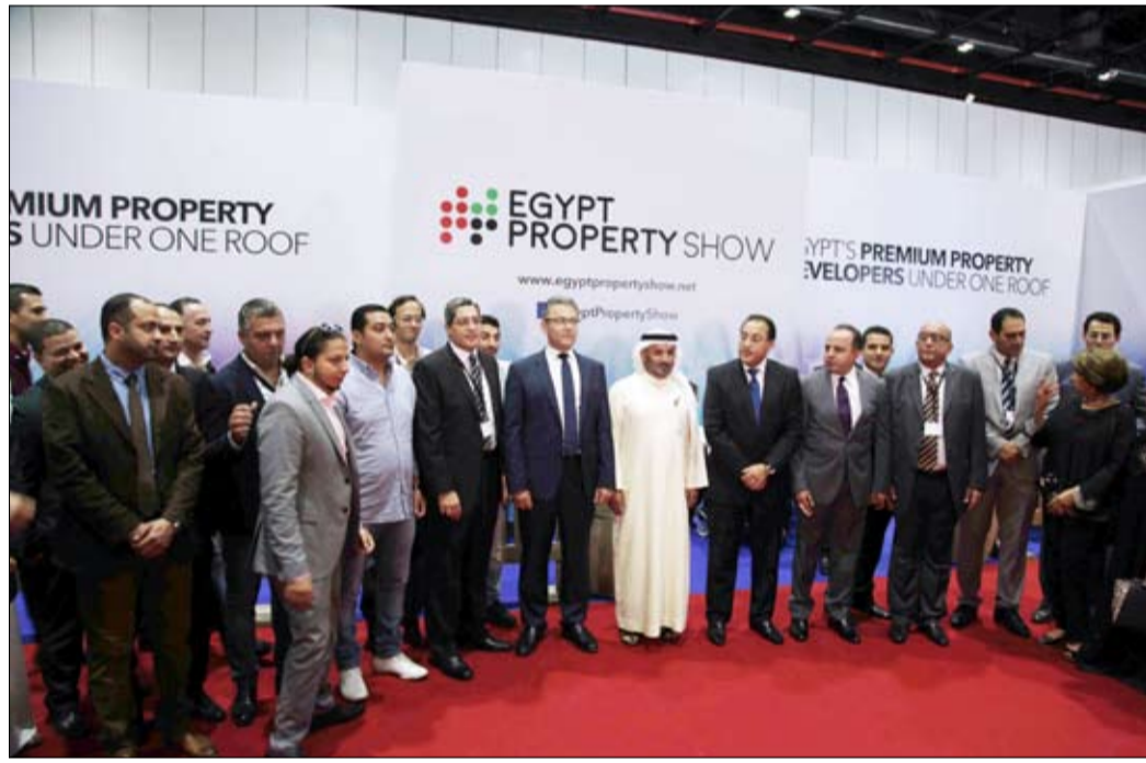
•• دبي -وأم:

افتتح سعادة سلطان بطي بن مجرن مدير عام دائرة الأراضي والأملاك في دبي امس الاول بحضور الدكتور مصطفى مدبولي وزير الإسكان في مصر معرض عقارات مصر في مركز دبي التجاري العالمي بمشاركة نخبة من أبرز الشركات الإقليمية والدولية.