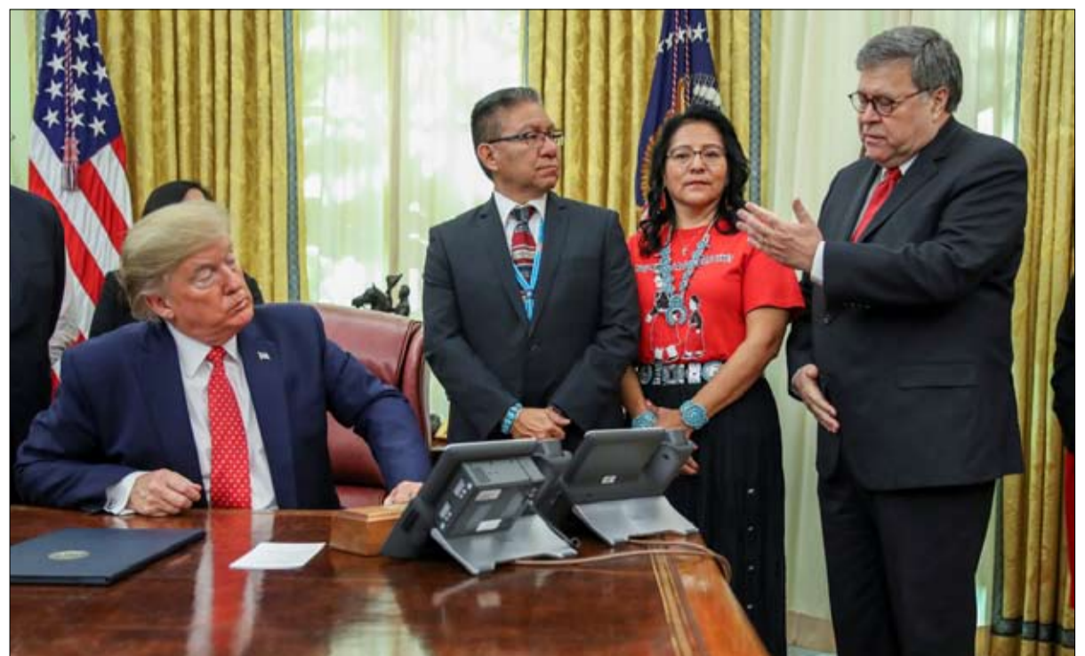
دونالد ترامب يستمع إلى وزير العدل بيل بار