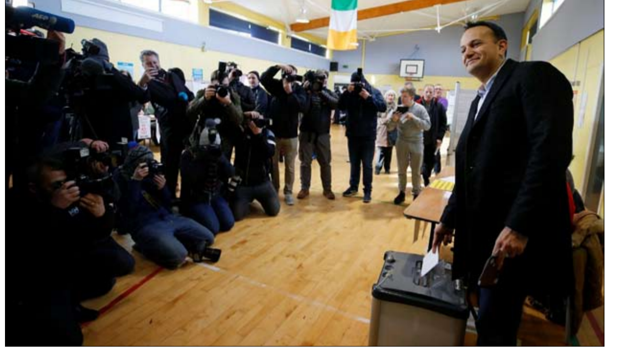
الأحزاب التقليدية في تراجع