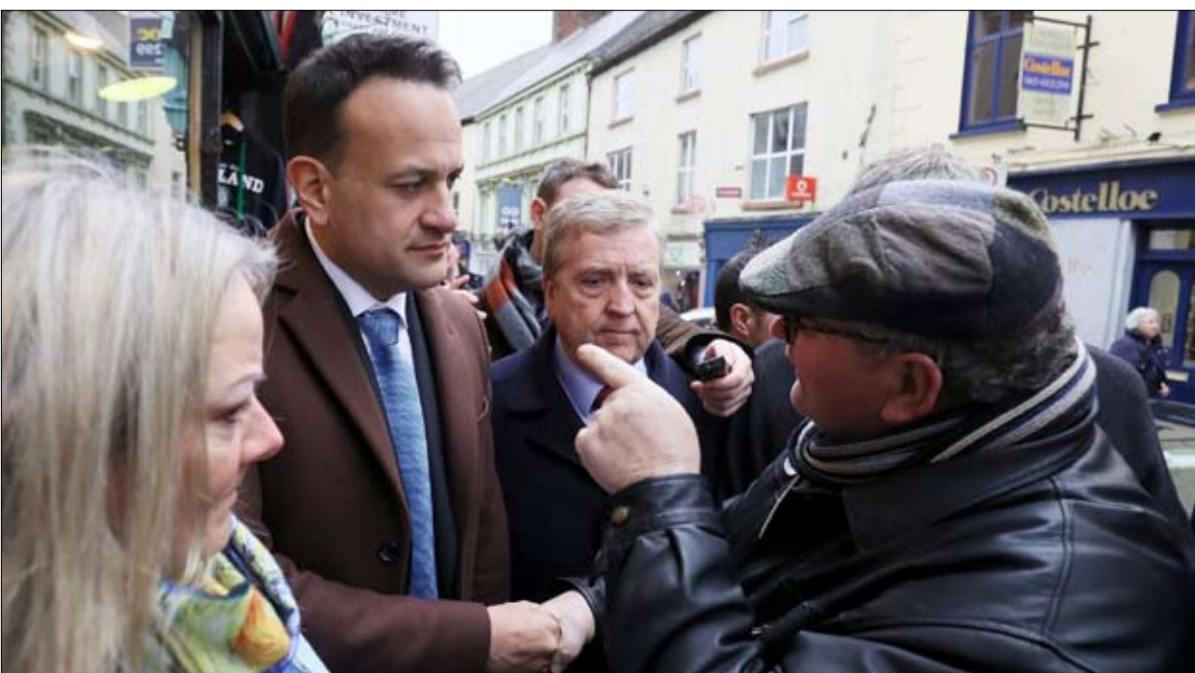
رئيس الوزراء المنتهية ولايته ليو فارادكار