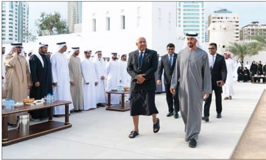
التنمية الحضارية في دول العالم المختلفة. حضر مجلس قصر الحصن سمو الشيخ عبدالله بن راشد والملح نائب حاكم أم القيوين وسمو الشيخ طحنون بن محمد

آل نهيان ممثل الحاكم في منطقة العين وسمو الشيخ سيف بن محمد آل نهيان والفريق سمو الشيخ سيف بن زايد آل نهيان نائب رئيس مجلس الوزراء وزير الداخلية وسمو الشيخ منصور بن زايد آل نهيان نائب رئيس مجلس الوزراء وزير شؤون الرئاسة وسمو الشيخ حامد بن زايد آل نهيان عضو المجلس التنفيذي وسمو الشيخ خالد بن زايد آل نهيان رئيس مجلس إدارة مؤسسة زايد العليا لأصحاب الهمم وسمو الشيخ خالد بن محمد بن زايد آل نهيان عضو المجلس التنفيذي رئيس مكتب أبو ظبي التنفيذي ومعالي الشيخ نهيان بن مبارك آل نهيان وزير التسامح.