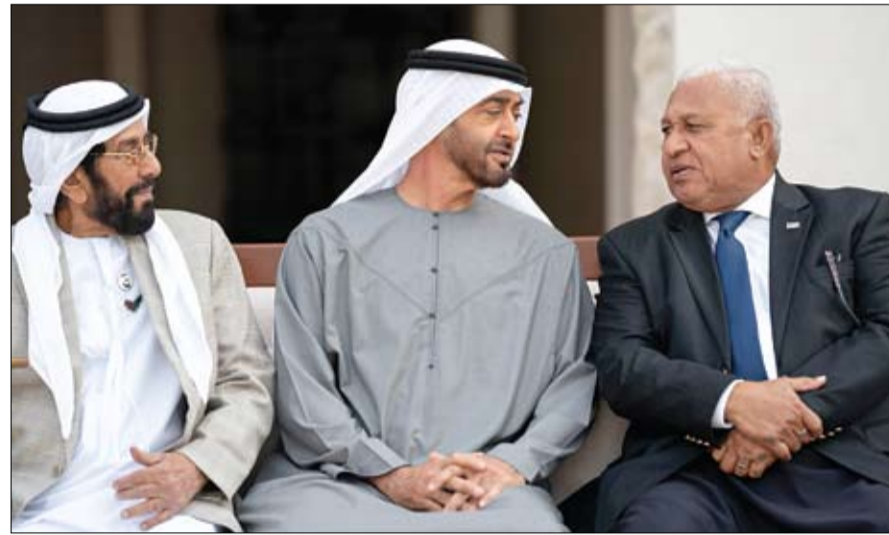
المجال التنموي، فضلا عن عدد من القضايا الإقليمية والدولية محل الاهتمام المشترك، والموضوعات المطروحة على جدول أعمال المنتدى الحضري العالمي، وأهمية المنتدى في تعزيز

•• أبو ظبي-وام: استقبل صاحب السمو الشيخ محمد بن زايد آل نهيان ولي عهد أبو ظبي نائب القائد الأعلى للقوات المسلحة معالي خوسايا فوريكي باينيماراما رئيس وزراء جمهورية جزر فيجي، الذي يزور دولة الإمارات للمشاركة في المنتدى الحضري العالمي الذي تستضيفه أبو ظبي خلال الفترة من 8 إلى 13 من شهر فبراير الجاري. ورحب سموه بمعالي خوسايا فوريكي باينيماراما، وناقش معه العلاقات الثنائية بين دولة الإمارات وجمهورية جزر فيجي وسبل دعمها ودفعها إلى الأمام في مختلف المجالات خاصة في