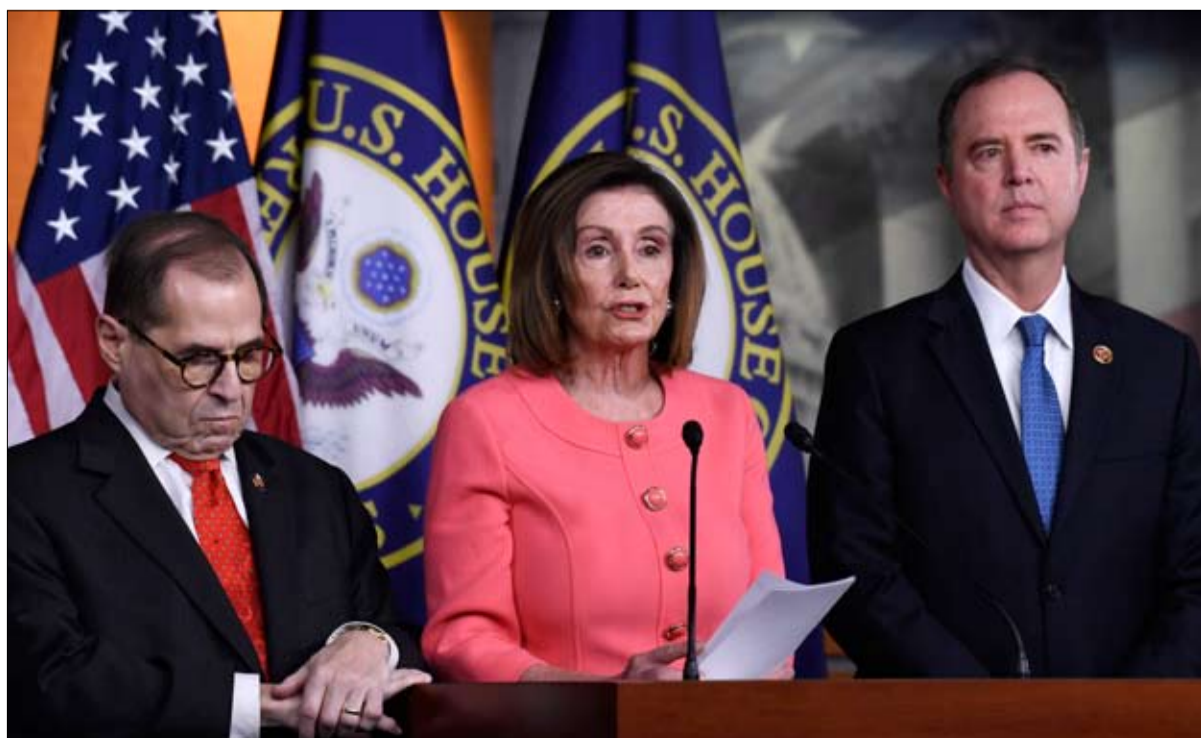
بيلوسي وأدم شيف حاولا تطبيق القانون

قد يسعى هذا الرئيس إلى استخدام قوة وزارة العدل للتلاعب بانتخابات 2020 والتشكيك في نتائجها؟