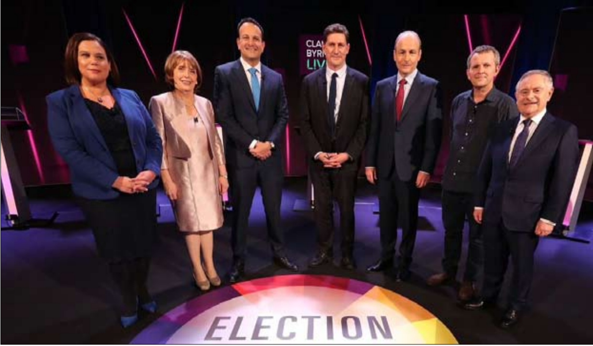
تأكيد لتغير المشهد السياسي في أوروبا