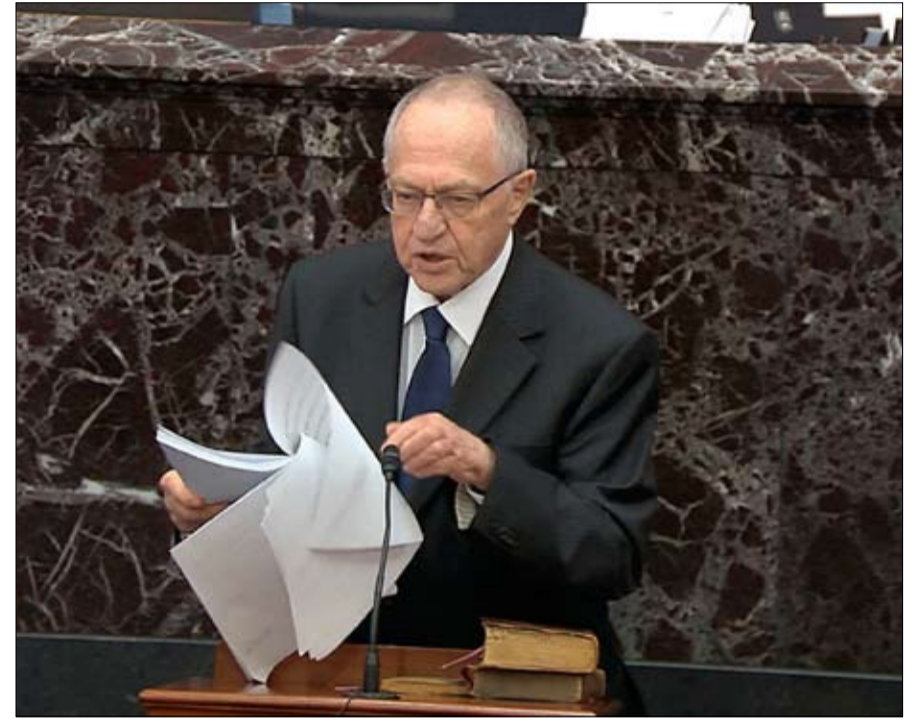
ألان ديرشويتز من فريق الدفاع

ومحاكمة العزل - هل كان عليهما القيام بتمشيط أوسع، والاستمرار لفترة أطول، أو الاستناد إلى قرارات قضائية لم تر النور أبداً؟ - لكن يمكننا أن نأمل في الاتفاق على أن الديمقراطيين الاثنىن حاولا استخدام الإجراءات القانونية وحجج القانون، على حد سواء، لإظهار أنه عندما يسء الرئيس استخدام السلطة الموكلة اليه ويرفض تقديم كشف حساب لا بد من القيام بشيء ما. لقد حاولا إثبات أن القانون لا يقتصر على معاقبة طالبي اللجوء الذين تقطعت بهم السبل في المكسيك، أو الرجال السود في السجن، ولكن يجب أن يطبق على الجميع، حتى الأثرياء وحتى الناس المعتدلين بأنهم مروا دائماً من الشقوق والفجوات.