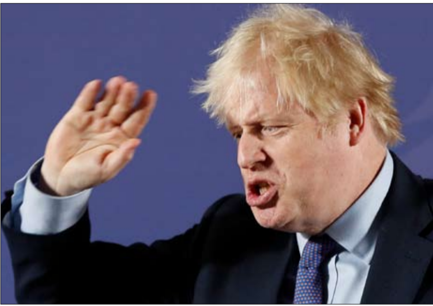
عند المحافظين يدعم شعبية شين فين

عن بريطانيا العظمى. لكن هل تفهم النخب السياسية التي تتخذ من لندن مقراً لها ما حدث؟ فيما يلي ما يجب استخلاصه: 1- لم تكن انتخابات حول البريكسيت، ولم يلعب البريكسيت أي دور في الحملة. أحد المفاتيح الرئيسية لهذه الانتخابات، هو قرار لا معنى له اتخذته حكومة فاين غايل، بقيادة رئيس الوزراء المنتهية ولايته ليو فارادكار،