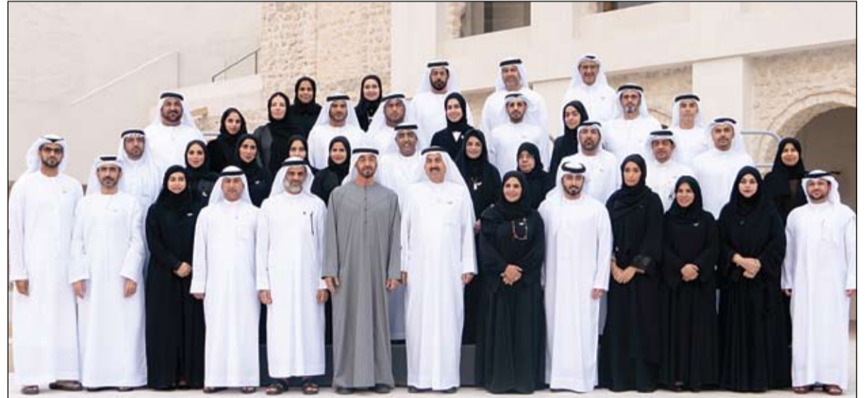
محمد بن زايد خلال استقباله أعضاء المجلس الوطني الاتحادي

ولي عهد أبوظبي نائب القائد الأعلى للقوات المسلحة معالي الدكتور نايف فلاح مبارك الحجرف الأمين العام الجديد لمجلس التعاون لدول الخليج العربية الذي جاء للسلام على سموه بمناسبة بدء مهام عمله أميناً عاماً للمجلس. (التفاصيل ص2)