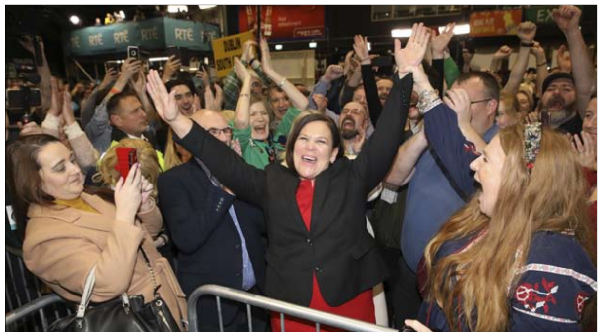
ماري لو ماكداول... رئيسة الشين فين تحتفل بالفوز في ديلن