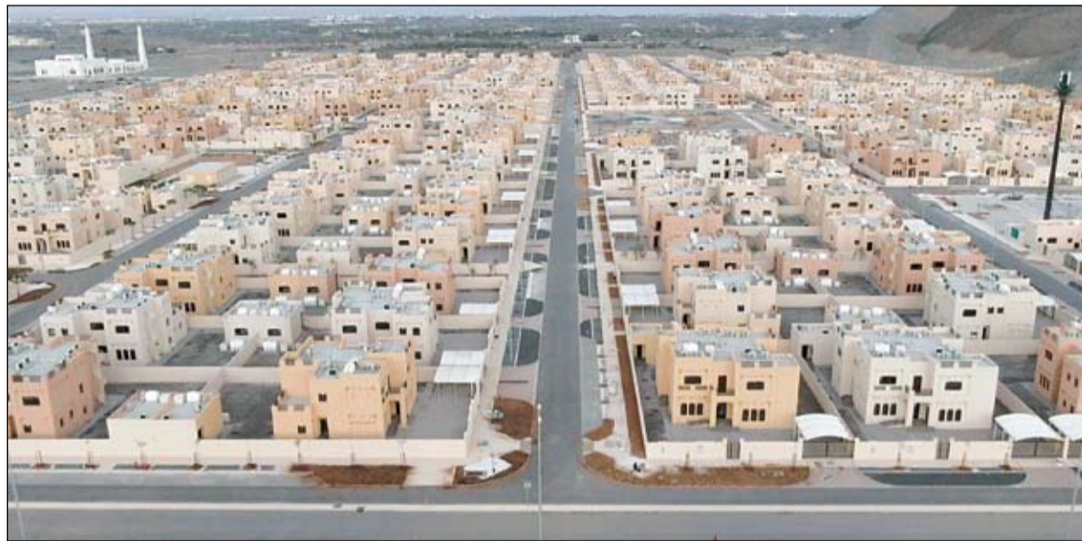
مدينة الشيخ محمد بن زايد السكنية في الفجيرة .. أيقونة جديدة تعكس حرص القيادة الحكيمة على إسعاد المواطنين

ومحور سياساتها ومستقبلها وسواصل بإذن الله تنفيذ المشاريع التي تضمن للأسر الإماراتية جودة الحياة والعيش الكريم. وقال سموه إن مؤسسات الدولة تعمل من خلال استراتيجية متكاملة على تطوير البنية التحتية وقطاع الإسكان تحديدا .. مضيفا سموه أن مدينة محمد بن زايد في إمارة الفجيرة تعد شاهداً جديداً على قدرة الإنجاز والتشيد والتميز في التخطيط والتنفيذ. من جانبه أكد صاحب السمو الشيخ محمد بن زايد آل نهيان ولي عهد أبوظبي نائب القائد الأعلى للقوات المسلحة .. حرص قيادة الدولة على توفير أفضل سبل العيش الكريم لأبناء الإمارات وتلبية متطلباتهم خاصة فيما يتعلق بالسكن الملائم والارتقاء بالأحياء السكنية وفق أرقى المعايير العالمية والتي تحقق التواصل والتماسك بين أفراد المجتمع إضافة إلى مستويات عالية من الرفاهية في مختلف الجوانب الاجتماعية والعمرائية. ويهذه المناسبة قال صاحب السمو الشيخ حمد بن محمد الشرقي عضو المجلس الأعلى حاكم الفجيرة .. إن إنشاء مدينة محمد بن زايد في الفجيرة يعكس الجهود المتواصلة التي تبذلها الدولة بقيادة صاحب السمو الشيخ خليفة بن زايد آل نهيان رئيس الدولة حفظه الله لتحسين بنيتها التحتية والارتقاء بالمستويات المعيشية للمواطنين وتحقيق الرفاهية لهم وتوفير الحياة الكريمة لأبنائهم وأسرمهم. (التفاصيل ص3)