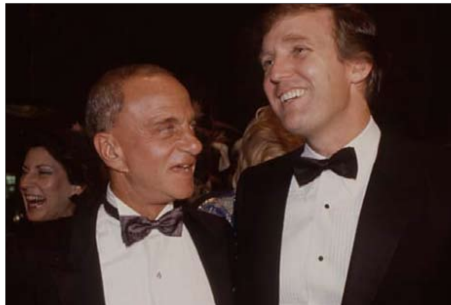
روي كوهن وتلميذه ترامب

ولكن لا. كما وعدنا جيمس زيرين، قام ترامب بنشر جميع استراتيجياته على طريقة روي كوهن لبيّن لنا أن القانون جيد للسذج والمغضين، وفي أسوأ الحالات، مجرد إزعاج، شيء نتخلص منه بمجموعة من المحامين الذين يحصلون على رواتب جيدة، ويرهبون خصومك وشهودك، ويكذبون بلا هوادة وبدون خجل، ويذعنون النصر حتى عندما يخسرون.