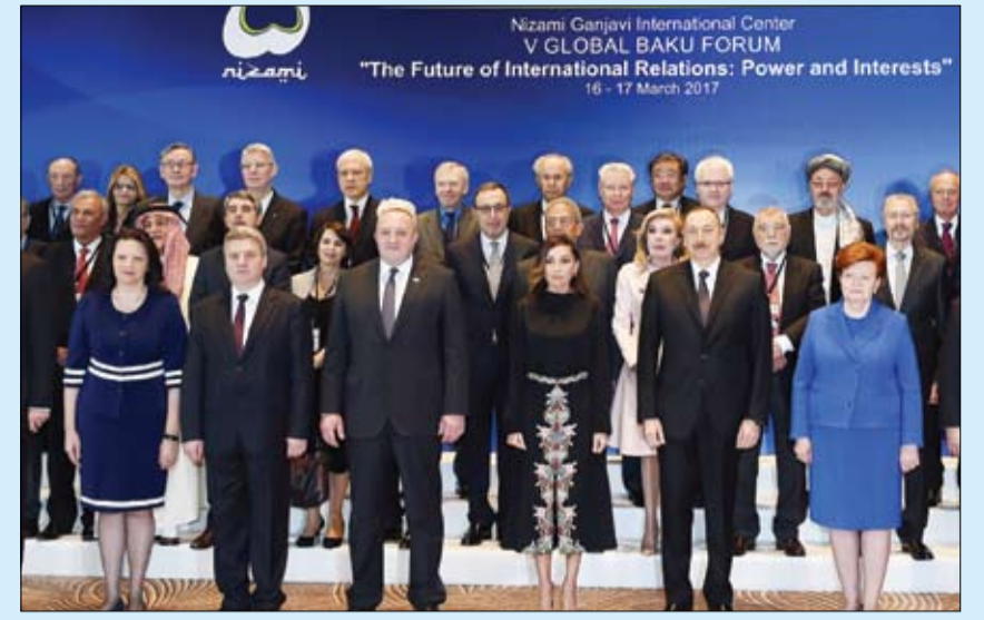
الرئيس الأذربيجاني وزوجته خلال حضورهما منتدى باكو العالمي الخامس