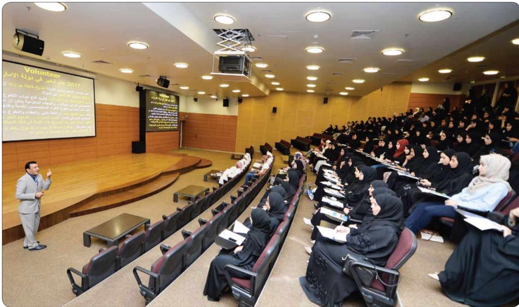
إعداداً لطلبة التدريب العملي