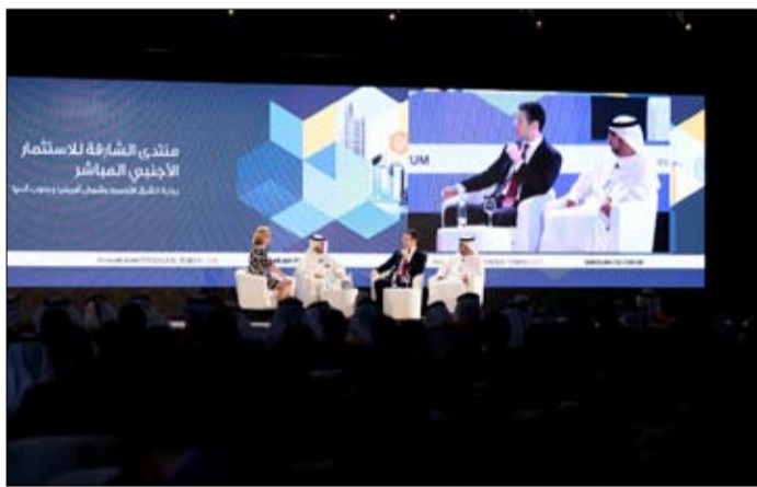
المنتدى يسلط الضوء مجددا على مقومات الشارقة الاستثمارية، وما توفره من فرص في مختلف القطاعات، وسنعمل على توجيه المستثمرين خلال المنتدى إلى القطاعات الواعدة والأكثر استدامة، ليحققوا طموحاتهم في الشارقة، ويكونوا جزءا من قصة نجاحها.

ويتضمن برنامج المنتدى مجموعة من الكلمات الرئيسية والجلسات النقاشية المباشرة لعدد من كبار المسؤولين والخبراء لتبادل الآراء والمعارف والخبرات، واستعراض الأوضاع الاقتصادية الراهنة والمستقبلية والفرص الكامنة فيها. ويوفر منتدى الشارقة للاستثمار الأجنبي المباشر 2017، فرصة لا مثيل لها لدراسة آفاق الاستثمار في دولة الإمارات العربية المتحدة عموما، والشارقة على وجه التحديد، وكذلك استعراض الفرص المتاحة في مختلف القطاعات الاقتصادية في الإمارة، وذلك بمشراكة واسعة لصناع القرار والمسؤولين والخبراء الاقتصاديين.