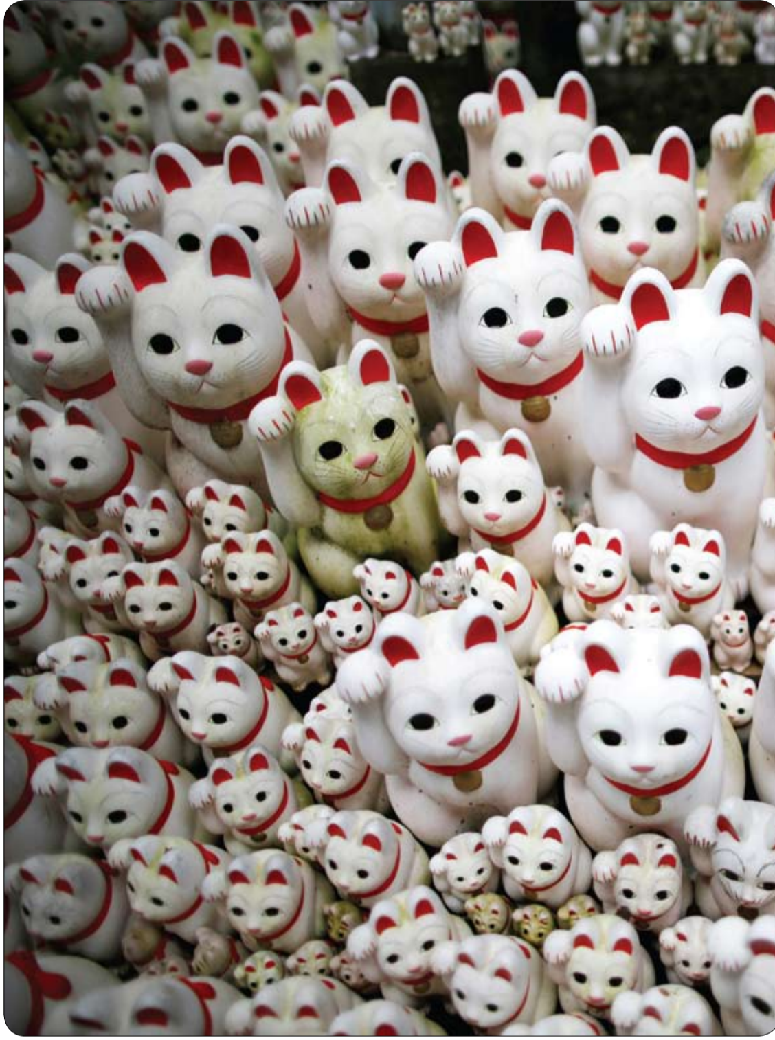
تماثيل للقط اليابانية التي تسمى مانينيكو في طوكيو، حيث يعتقد السكان أنها تجلب الحظ. (رويترز)

في عملية جراحية نادرة الحدوث، زرع الجراحون الروس في مركز "ميشالكين" بمدينة نوفوسيبيرسك في سيبيريا؛ قلبيين ميكانيكيين لفتاة عشرينية تلقت بضع طعنات؛ ما أدى إلى إصابة أعضائها الداخلية ومنها القلب. وتسببت الطعنات التي تلقتها الفتاة في إصابات بنوبة قلبية شديدة، وتضرر 80% من أنسجة عضلة القلب؛ ما أدى إلى مضاعفات خطيرة في الكبد والكلى والرئتين، حسب "روسيا اليوم"، الأربعاء (16 أغسطس 2017). وجعلت تلك الإصابات عملية زراعة قلب الفتاة أمراً مستحيلًا، وبقي للجراحين حل واحد هو دعم الدورة الدموية بطريقة ميكانيكية؛ حيث زرع مجمع يتألف من مضختين تؤديان وظيفة خفقات القلب، في جسم الفتاة، وتقوم إحداها بسحب الدم من بطين القلب الأيسر لتضخه إلى الشريان الأورطي. أما المضخة الثانية فتوجه الدم من الأذين الأيمن إلى الشريان الرئوي. يذكر أن المرضى المصابين بفشل قلبي الأيمن والأيسر، تُزرع لهم عادةً مضخات تعمل بالهواء المضغوط، وترتبط تلك المضخات بحرية بوضع فيها ضاغط للهواء. وقد استغرقت العملية الجراحية 6 ساعات. ودل الفحص الطبي الذي أجرى على الفتاة بعد العملية، على أن جسمها عاد إلى عمله الحيوي الطبيعي؛ ما أدى إلى إزالة آثار فشل القلب. ويتوقع أن تجري لها عملية زراعة قلب الخريف المقبل. (رويترز)