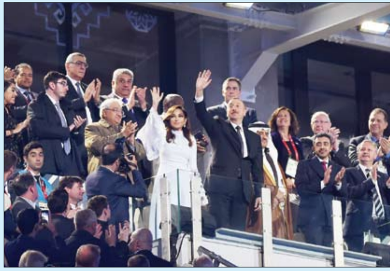
وخلال حضورهما حفل إختتام دورة ألعاب التضامن الإسلامي