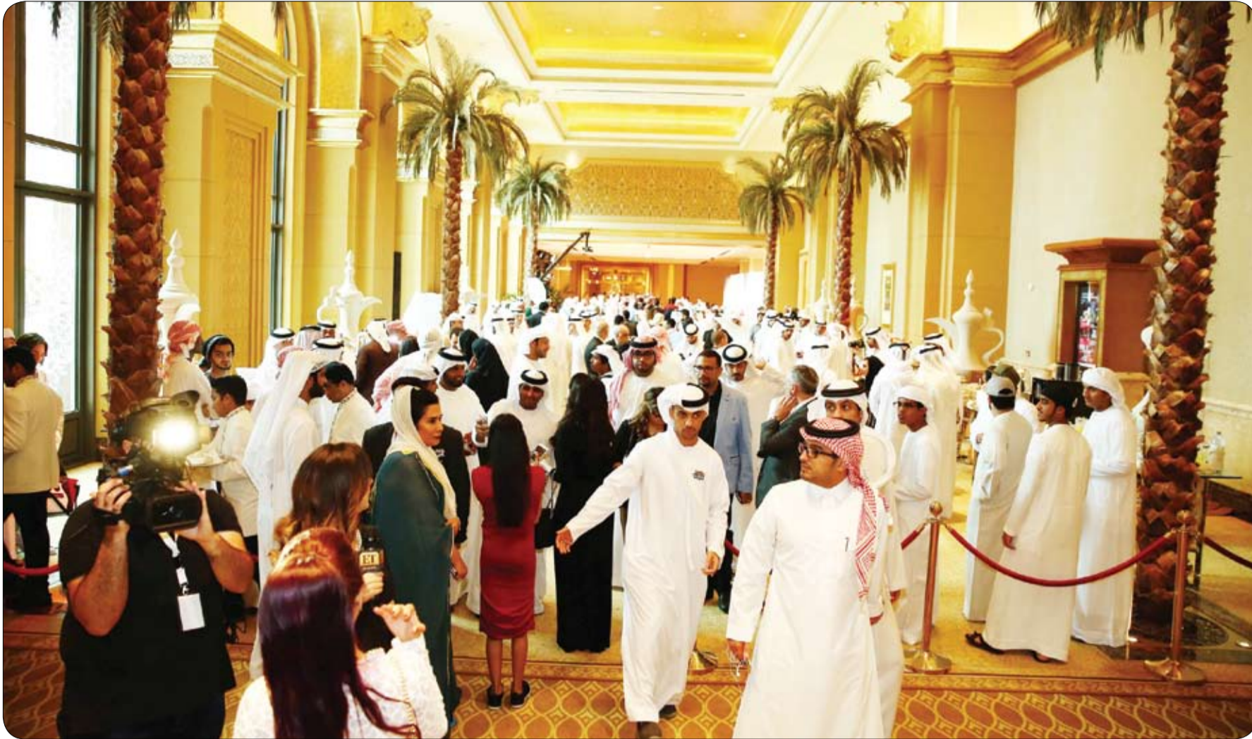
بحضور عمالقة الكوميديا ونجوم الفن والإعلام