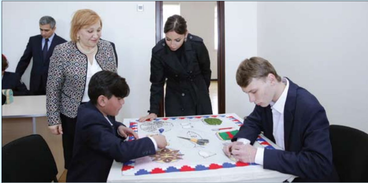
مهربان علييفا خلال جولتها التفقدية في دار الأيتام

والصحة والتعليم. ولم تكن الألعاب الأوروبية الحدث العالمي الضخم الوحيد من نوعه الذي تولت السيدة مهربان علييفا تنظيمه بنجاح، فقد تم اختيار السيدة مهربان علييفا لكي تكون رئيسا للجنة تنظيم استضافة الدورة الرابعة للألعاب التضامن الغسلافي في أذربيجان التي احتضنها العاصمة باكو على امتداد الفترة من 12 مايو 2017 عام 2017 والتي حققت هي الأخرى نجاحا باهرا من كل النواحي، وأثبتت مجددا نزوع الشعب الأذربيجاني إلى الرياضة ودعم الدولة، باعتبارها القيمة العريقة والمتجذرة في دماء الشعب، التي جاذب دور مؤسسة