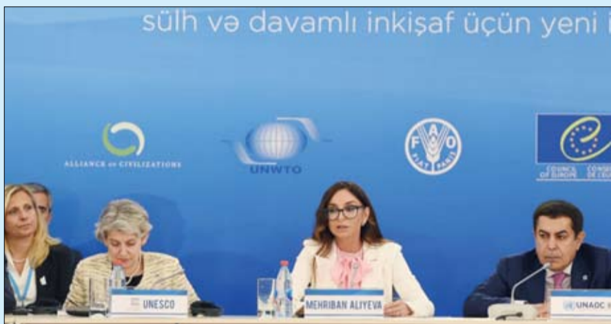
وخلال كلمتها على هامش المنتدى الدولي لتحالف الحضارات

لقد حان هذا اليوم المشهود الذي سجل في تاريخ الشعب الأذربيجاني الحديث بمثابة تدرجين نجاحات مقبلة ليست بالبعيدة، إذ وقع فخامة إلهام علييف رئيس جمهورية أذربيجان في 21 فبراير عام 2017 على مرسوم تم بموجبه تعيين السيدة مهربان علييفا نائبا أول لرئيس جمهورية أذربيجان الأمر الذي لقي ترحابا واسعا لدى المواطنين الذين ينظرون إليها بنظرات مملوءة بالحب والاعتزاز والتقدير والتفاؤل والاطمئنان.