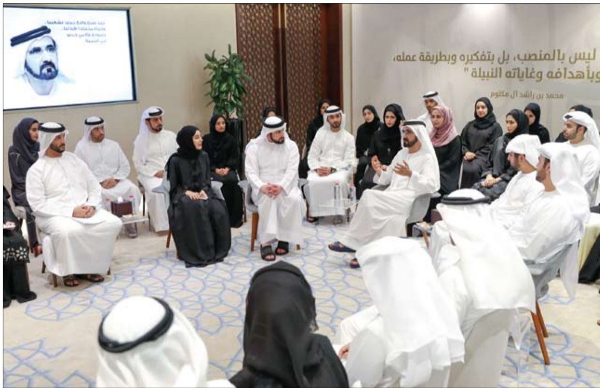
محمد بن راشد يتحدث الى فريق عمله خلال جلسة عصف ذهني

دبي- وام: أكد صاحب السمو الشيخ محمد بن راشد آل مكتوم نائب رئيس الدولة رئيس مجلس الوزراء حاكم دبي رعاه الله أن طموحات دولة الإمارات اليوم مختلفة.. ونحتاج أفكاراً مختلفة وكوادر مبدعة ودماء متجددة بشكل مستمر لتحقيق طموحات شعبنا وتوقعات العالم من حولنا. جاء ذلك خلال ترؤس سموه جلسة عصف ذهني مع فريق عمله صباح أمس بمكتبه ببرج الإمارات بحضور سمو الشيخ مكتوم بن محمد بن راشد آل مكتوم نائب حاكم دبي وسمو الشيخ أحمد بن محمد بن راشد آل مكتوم رئيس مؤسسة محمد بن راشد آل مكتوم للمعرفة ومعالي محمد بن عبدالله القرقاوي وزير شؤون مجلس الوزراء والمستقبل ورئيس المكتب التنفيذي لصاحب السمو الشيخ محمد بن راشد آل مكتوم. وأضاف سموه.. نحن نقدر دائماً من عمل ويعمل ويسعمل لدولة الإمارات.. وسنبقى في سعي مستمر لرفع مستوى معيشة مواطنينا والخدمات المقدمة لهم. وقال صاحب السمو الشيخ محمد بن راشد آل مكتوم خلال الجلسة التي تم طرح العديد من الأفكار والمبادرات والمشاريع خلالها إن التفكير بشكل جماعي والحوار المفتوح مع فرق العمل يولد أفكاراً أفضل وأقرب دائماً للنجاح. وخاطب سموه فرق عمله بقوله: الإمارات اليوم هي مصدر للأمل.. ونموذج.. ولابد أن تكون على قدر هذه المسؤولية. وأضاف سموه نريد منكم النشاط الدائم، والأفكار المتجددة، والتعلم المستمر والعزيمة القوية. (التفاصيل ص2)