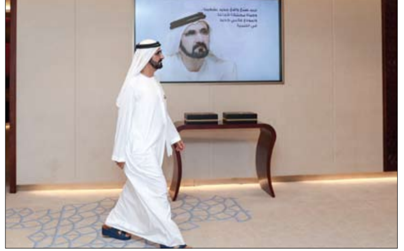
ترأس جلسة عصف ذهني مع فريق عمله وأكد الحاجة الى أفكار وكوادر مبدعة ودماء متجددة