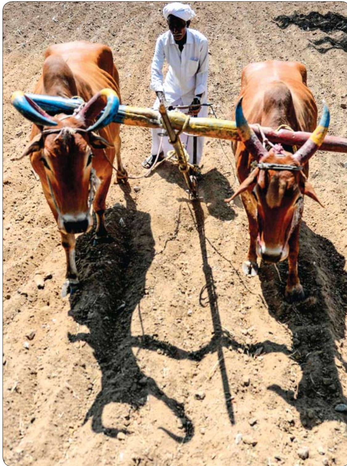
رجل يحرث حقلاً مع زوج من الثيران في قرية شينايا الهندية.

الأرتكاريا المزمّنة غالباً ما تكون مجهولة السبب ويمكن أن تنتج عن الإجهاد أو غيرها من المحفزات، يعتقد أن تنشيط الأجسام المضادة (البروتينات المناعية التي تستهدف خلايا الجسم الخاصة) قد يؤدي أيضاً للإفراج عن الهستامين وغيرها من المركبات المؤيدة للالتهابات. بالإضافة إلى الإجهاد ، تتضمن العوامل المادية الشائعة التعرض للبرد والحرارة وأشعة الشمس والضغط والاهتزاز والمياه والاحتكاك.