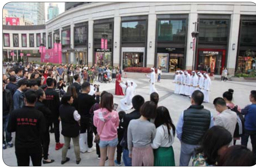
خلال "أسبوع أبوظبي في الصين"