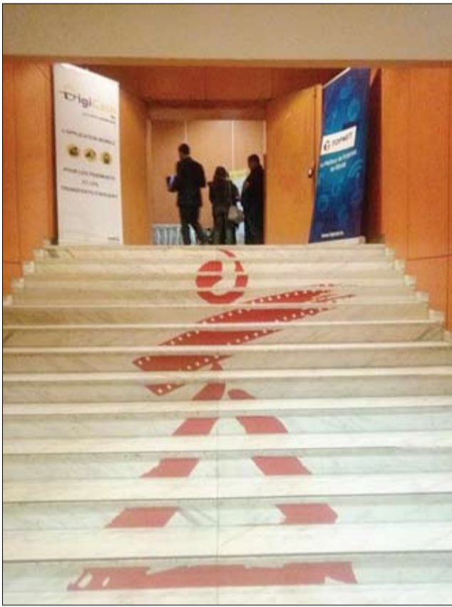
قريبا السجاد الاحمر

رقم قياسي في الأفلام التونسية المشاركة بـ 78 فيلما - عودة مسابقة الفيلم الوثائقي بصنفيه الطويل والقصير