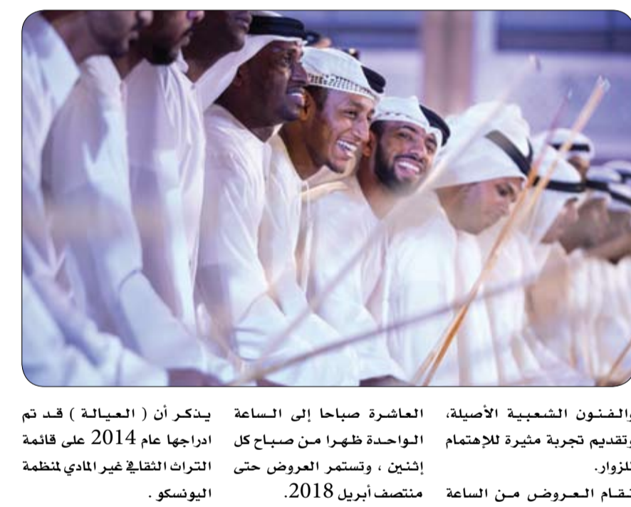
العيون - الفجر