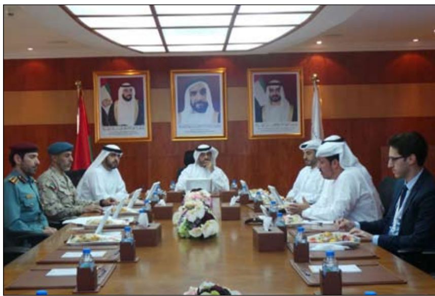
خلال لقاء تعريف مع موظفي «المؤسسة العليا للمناطق الاقتصادية المتخصصة»

وقال إن استقطاب المزيد من الشركات انعكس على نسبة الإشغال في جافزا حيث تشغل شركات المواد الغذائية والمشروبات مساحة تقدر بـ 1.67 مليون متر مربع تتنوع بين قطع الأراضي والمسودعات وصلات العرض والمكاتب .. لافتاً إلى أن منطقة الشرق الأوسط تستحوذ على النسبة الأكبر من شركات المواد الغذائية والمشروبات العاملة في جافزا بنسبة 57 بالمائة يليها إقليم آسيا والمحيط الهادئ 18 بالمائة وأوروبا 13 بالمائة والأمريكتين 8 بالمائة وأفريقيا بالمائة.