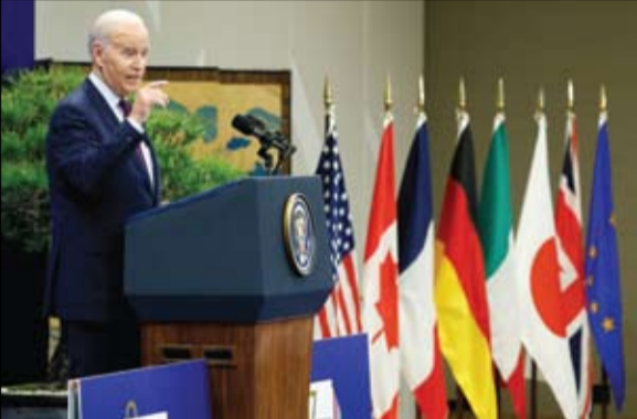
الرئيس الأمريكي خلال مؤتمره الصحفي في اليابان

توقع الرئيس الأمريكي جو بايدن، أمس الأحد، تحسناً في العلاقات بين بلاده والصين، في ظل توتر قائمته حادثة إسقاط الولايات المتحدة لمصعد صيني يشبه في أنه لأغراض التجسس فوق الأراضي الأمريكية.