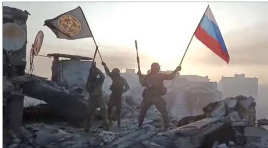
مقاتلو فاغتر يلوحون بأعلام روسيا ومجموعة فاغتر فوق مبنى يقولون إنه في باخموت (رويترز)

الروس وأنها ستظل في قلب الأوكرانيين، سارع في مؤتمر صحافي لاحق مع الرئيس الأمريكي جو بايدن إلى الاستدراك مؤكداً أن قواته لا تزال في المدينة.