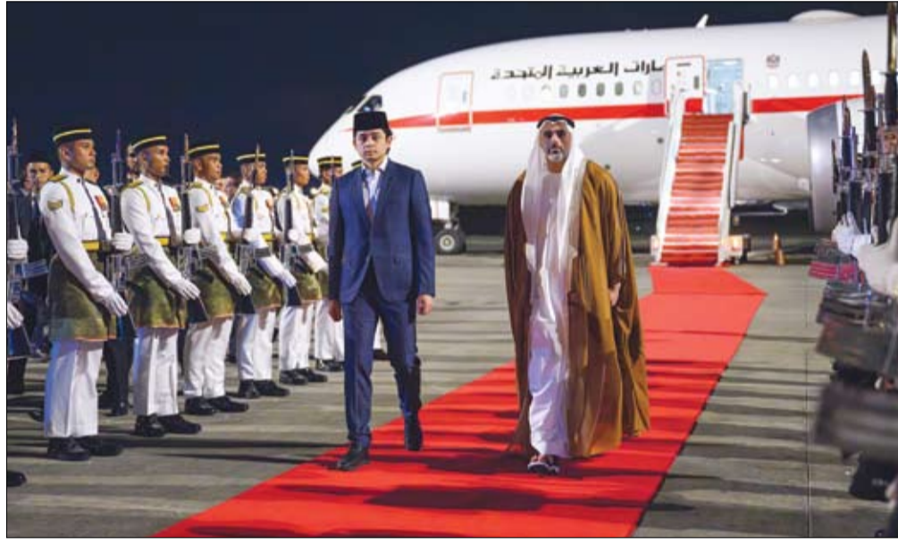
خالد بن محمد بن زايد لدى وصوله الى كوالالمبور في استقباله ولي عهد بهانج

أضاءت العاصمة الماليزية كوالالمبور برج بتروناس التوأماً بعلم دولة الإمارات العربية المتحدة، احتفاءً بزيارة سمو الشيخ خالد بن محمد بن زايد آل نهيان، ولي عهد أبوظبي، ماليزيا. وترافقت إضاءة البرجين، اللذين يُعدان من أبرز المعالم السياحية في ماليزيا، بالتزامن مع الزيارة الرسمية التي يجريها سمو الشيخ خالد بن محمد بن زايد آل نهيان ماليزيا.