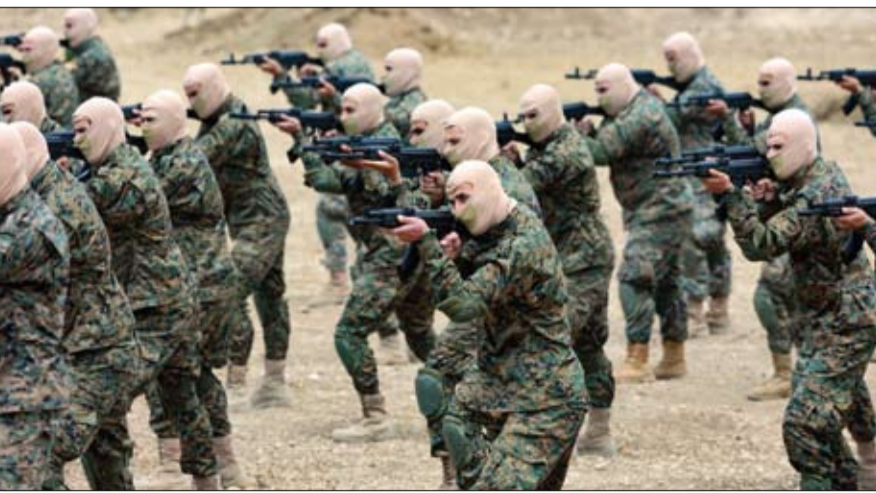
مليشيا حزب الله تستعرض في مناورات عسكرية جنوب لبنان انتقدها غالبية اللبنانيين

والاقتصادية. وكان حزب الله أعلن قبل أيام إجراء هذه المناورات في بلدة عرمتا الجنوبية ضمن معسكر تابع له، وقد شهدت محاكاة لهجوم نحو الأراضي الإسرائيلية، وعرض لأليات عسكرية، وراجعات صواريخ متوسطة وبعيدة المدى.