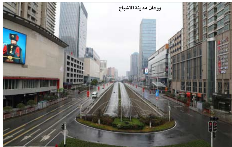
وهان مدينة الاشباح

حجب جميع المعلومات عن تطور الوباء طيلة ثلاثة أشهر. بعد أن أصبح رئيساً للجمهورية في مارس 2003، كان رد فعل هو جين تاو قويا ضد موقف الإدارة التي كان يهيمن عليها موالون لسلفه، جيانغ زيمين. في غضون أيام قليلة، قررت فرق هو جين تاو سلسلة من الاحتياطات؛ قياس درجة حرارة كل السكان في مداخل كل العمارات، وكان على أي شخص يخرج إلى الشارع أن يرتدي قناعاً، كما أوصوا بارتداء القفازات البلاستيكية لفتح الأبواب.