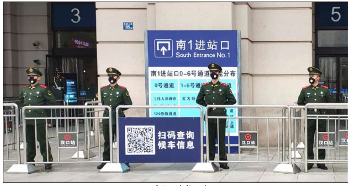
امام محطة هانكو حراسة مشددة