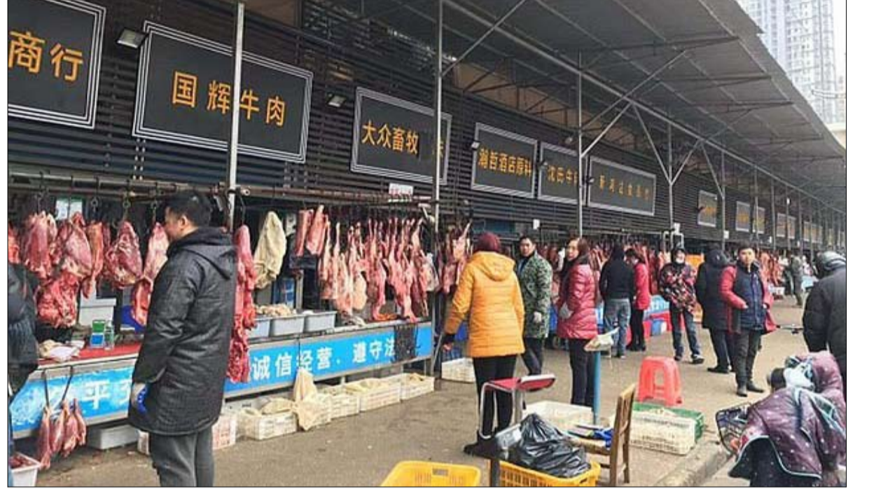
سوق هوانان بيت الداء

على شبكة الإنترنت، يمكننا أن نقرأ على سبيل المثال "من الأفضل تجنب المستشفى في حالة حدوث أعراض تنفسية غير عادية لأنه أضمن وسيلة للإصابة بفيروس كورونا"، أو أنه من الأفضل "شرب الماء الساخن وتسخين شفتك قدر الإمكان".