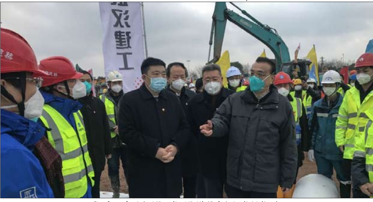
رئيس الوزراء الصيني لي كه تشيانغ يتفقد بناء مستشفى لمرضى فيروس كورونا