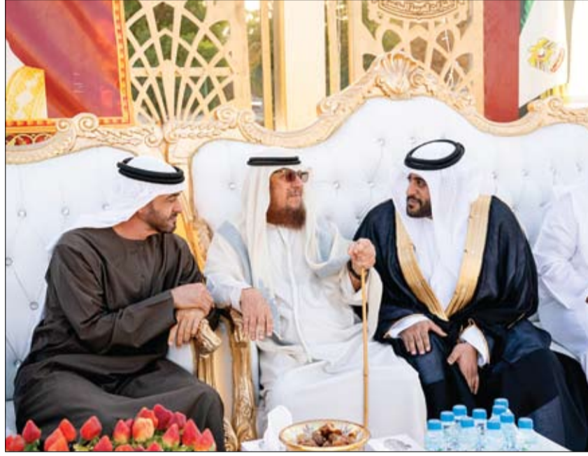
محمد بن زايد خلال حضوره حفل الاستقبال بمناسبة زفاف لاجح سيف المنصوري