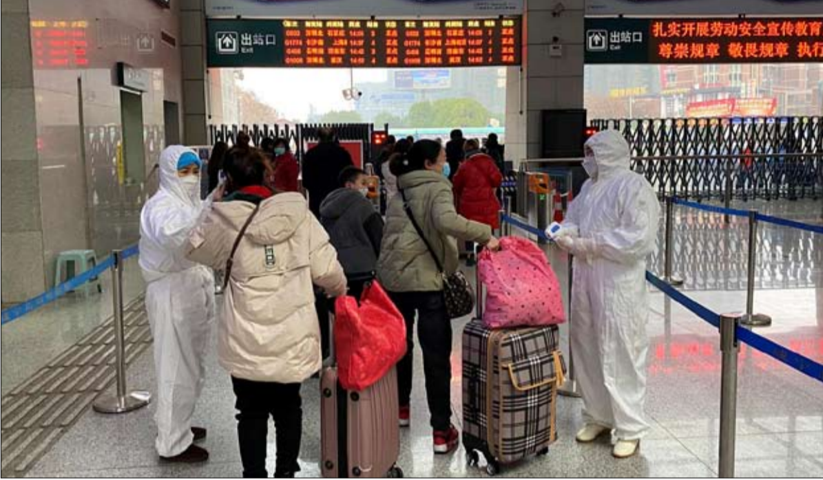
مراقبة صارمة بين المدن