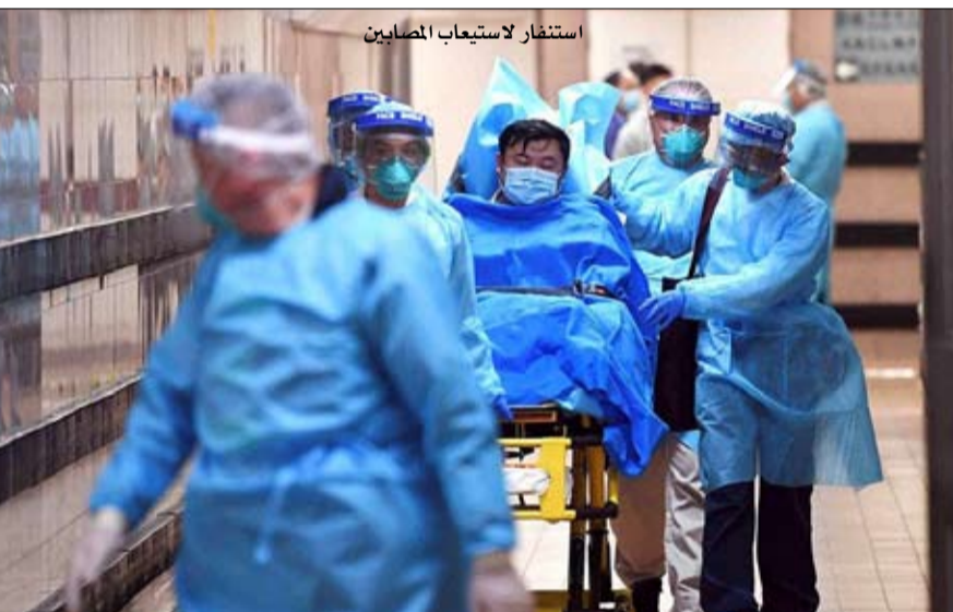
استنفاغ لاستيعاب المصابين

مكافحة القلق الفيروسي ولاشرف على مكافحة الوباء، تم إنشاء مجموعة عمل في بكين، برئاسة لي كه تشيانغ، رئيس الوزراء. في 27 يناير، زار هذا الأخير ووهان. الهدف هو التحقيق في الجهود المبذولة لاحتواء الفيروس، و"مقابلة المرضى والعاملين الطبيين في الخطوط الأمامية للوباء". الصور في الصحافة الصينية تظهر رئيس الوزراء في محط من البلاستيك وقناع أزرق يشاهد مريضاً على الشاشة. بالتوازي، في العديد من المدن الصينية الكبرى، منها بكين، توصي مكبرات الصوت بالتجنب سكان كل منطقة التجمعات في الأماكن العامة، وخصوصاً، إذا كان لا بد من الخروج إلى الشارع.