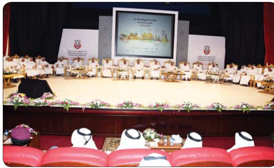
ضمن ملتقى فعاليات العين السكانية