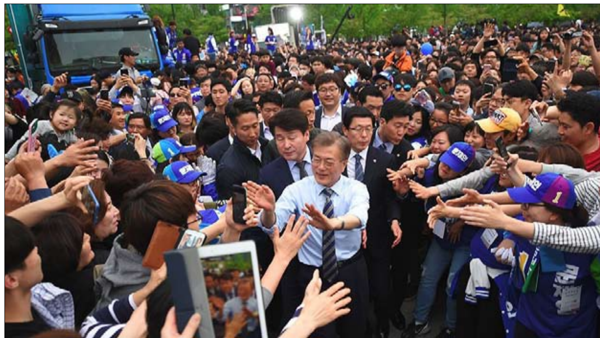
يستمد شعبيته من سيرته قبل برنامجه