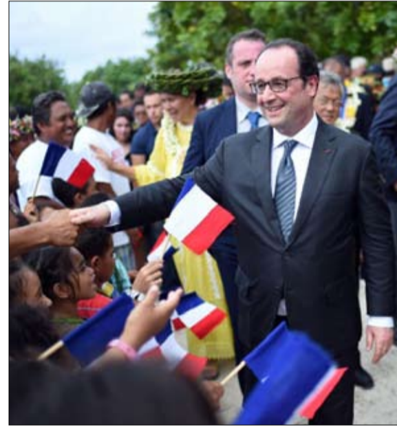
ماكرون يتقطع مع دبلوماسية هولند