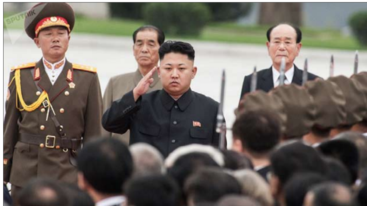
كيم هل يقبل باقتراح مون ويلتقيان لنزع الفتيل؟