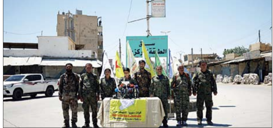
قياديو سوريا الديمقراطية خلال مؤتمرهم الصحفي في مدينة الرقة

• عواصم - وكالات: أكدت مصادر أن واشنطن قدمت دفعة جديدة من الأسلحة إلى وحدات حماية الشعب الكردية بشمال سوريا، وقال قيادي كردي إن الهجوم على الرقة بات وشيكا، في وقت اعتبر الرئيس التركي رجب طيب أردوغان أن التسليح الأميركي للأكراد يعارض مع طبيعة العلاقات مع واشنطن. وقالت مصادر أمس الجمعة إن دفعة من الأسلحة الأميركية وصلت إلى مناطق سيطرة وحدات حماية الشعب قادمة من مطار أرزييل عبر معبر سيمالكا الحدودي مع إقليم كردستان العراق، وهي تتضمن عربات من نوع مفر وأسلحة ثقيلة. وأعلن قهرمان حسن نائب القائد العام لقوات سوريا الديمقراطية أن عملية استعادة مدينة الرقة من تنظيم داعش الإرهابي ستبدأ في مطلع الصيف، مضيفا أن قواته مكونة بشكل أساسي من وحدات حماية الشعب الكردية لا تحتاج مساعدة من أي جهة. وتعهد قهرمان باستعادة الرقة وما بعد الرقة، وقال إن قواته تمكنت من استعادة مدينة الرقة وسد الفرات بشكل كامل في العاشر من الشهر الجاري، معتبرا أن تركيا غير راضية عن هذا التطور وتحاول لصق تهمة الإرهاب بالقوات الكردية. ويبدو، قال القيادي في قوات سوريا الديمقراطية عبد القادر هفيديلي إنه في بداية دخول الرقة ستكون هناك باطبع، وكما وعد