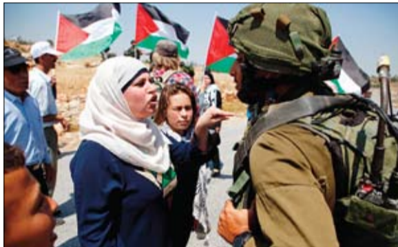
فلسطينية تتحدى احد جنود الاحتلال المدجج بالسلاح

طالب الأسرى. يأتي ذلك في وقت دخل فيه إضراب الأسرى في سجون الاحتلال يومه 26، للمطالبة بتحسين أوضاعهم ووقف الانتهاكات داخل السجون. وقد نقل أمس الخميس 47 أسيرا مضربا عن الطعام إلى مستشفيات ميدانية بعد تدهور أوضاعهم الصحية، وفقا لهيئة شؤون الأسرى والمحررين. ويخوض الإضراب حتى الآن نحو 1300 أسير بقيادة عضو اللجنة المركزية لحركة فتح النائب مروان البرغوثي. ونقلت وكالة معا الإخبارية عن قراقع أن معلومات أولية وردت من الأسرى أفادت بأن إدارة