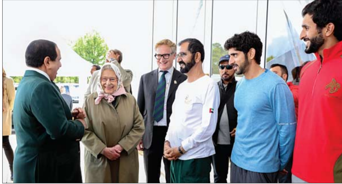
محمد بن راشد خلال لقائه ملكة بريطانيا بحضور ملك البحرين على هامش فعاليات مهرجان رويال ويندسور للقدرة

• بروكسل - أ ف ب: أعلنت المتحدثة باسم المفوضية الأوروبية ان محادثات ستجري بين مسؤولين رفيعي المستوى من الاتحاد الأوروبي والولايات المتحدة حول احتمال توسيع الحظر الأميركي للحواسيب المحمولة في مفضولات الركاب ليشمل الطائرات الأوروبية. وقالت أن-كاي ساكوتون خلال مؤتمر صحفي في بروكسل هناك محادثة هاتفية مقرر لاحقا اليوم مع وزير الأمن الداخلي جون كيلي وعدد من الوزراء الأوروبيين، مضيفة ان مفضولين أوروبيين سيشاركان في المحادثات. وأضافت يهنا أن تبقى على اطلاع بحيث يمكننا مشاركة المعلومات مع الدول الأعضاء.