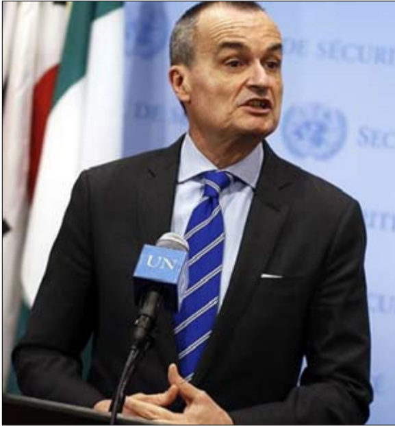
جيرار ارو قدرة ماكرون على جمع الاضداد

والسؤال، ما مدى التحولات وضخامتها؟ يجب بالطبع انتظار الخطوات الأولى للرئيس على الساحة الدبلوماسية، حتى يتسنى الحكم، خطوات ستبدأ في نهاية هذا الشهر مع قمة حلف شمال الأطلسي في روما، حيث سيلتقي لأول مرة دونالد ترامب. وسنرى أيضا توقعه تجاه فلادمير بوتين الذي دعا الاثنان الى التغلب على الاندماج الثقة المتبادل. شيء واحد مؤكد، هو ان إيمانويل ماكرون لم يصل الى الأليزيه دون أن يفكر في هذه القضايا السيادية، كما يتضح من إجاباته عشية انتخابه، اما حجم الانعطافات سيحدد بعد.