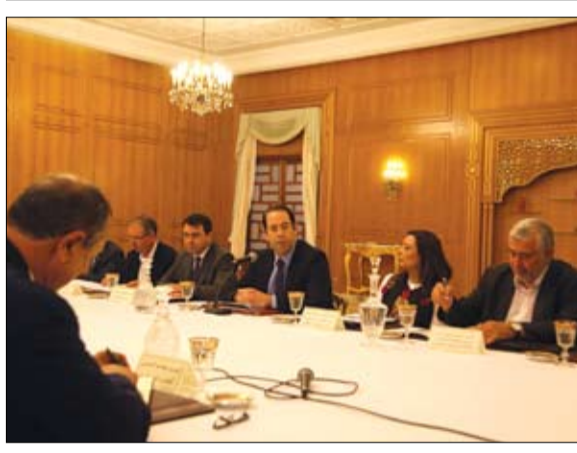
الشاهد يريد دعما أكبر من احزاب الوفيقة

• الرياض - وكالات: بوحد الهدف الذي قامت من أجله عاصفة الحزم وإعادة الأمل للحائلف العربي بهدف إنهاء الانقلاب واستعادة الدولة وسيطرتها على كافة التراب اليمني. وتفصيلا، رفضت الحكومة اليمنية أمس الجمعة إقدام شخصيات قبلية وعسكرية وسياسية بارزة على تشكيل مجلس جديد يسعى لانفصال جنوب اليمن قائلة ان هذه خطوة من شأنها تعميق الانقسامات وخدمة مصالح الحوثيين المدعومين من إيران. وكان عيروس الزبيدي محافظ عدن السابق قد أعلن أن المجلس الجديد سيشكل قيادة سياسية جنوبية عليا تسمى هيئة رئاسة المجلس الانتقالي الجنوبي تحت رئاسته تكون مهمتها إدارة الجنوب وتمثيلية.