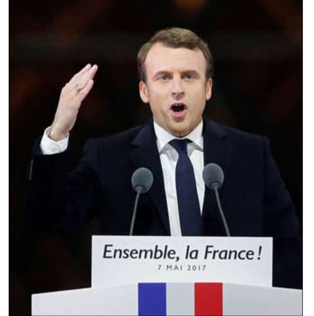
ماكرون اية سياسة خارجية لفرنسا؟

•• الفجر - بيير هاسكي - ترجمة خيرة الشيباني بدخوله المسرح مساء الأحد 7 مايو في متحف اللوفر، بعد فترة قصيرة من انتخابه، على إيقاع "أنشودة الفرح" لبتهوفن، النشيد الرسمي للاتحاد الأوروبي، بين إيمانويل ماكرون بوضوح انه يسجل ولايته تحت علامة أوروبا. ولكن، لئن أعرب المرشح مرارا عن خياره الأوروبي، وعن ارادته في تجديد عمل الاتحاد الأوروبي بتنشيط التحالف مع ألمانيا، فإننا لا نعرف الكثير عن موقفه مما تبقى من سياسته الخارجية المستقبلية وأوروبا لم تعد حقا من مشمولات السياسة الخارجية، وعلى وجه الخصوص أحد جوانبها الرئيسية، العمليات العسكرية الخارجية.