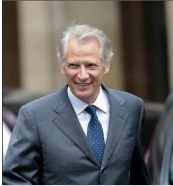
دي فيليبان علاقة خاصة مع ماكرون وشبه تطابق في الرؤى