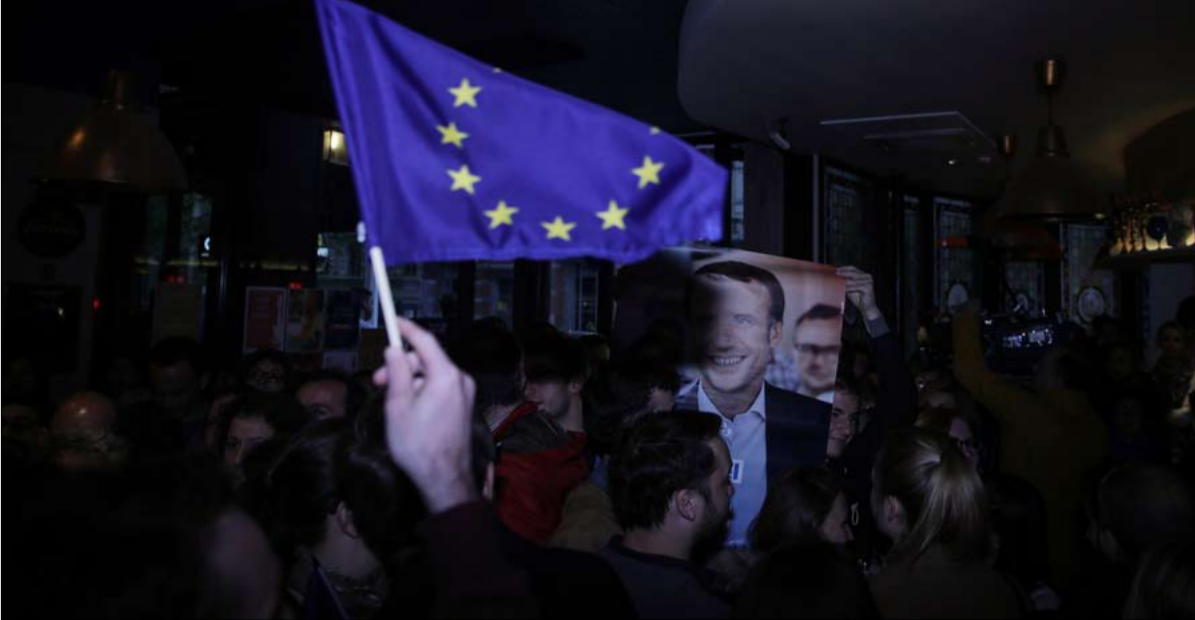
الوجهة الأوروبية وحدها المعلومة في دبلوماسية ماكرون