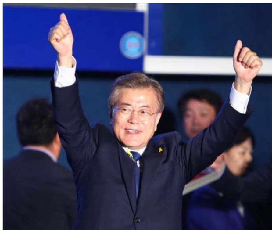
هل يحقق مون المعجزة؟

انه ملف حساس لمون جاي إن، الواقع في كمشاة بين القوتين العالميتين، وسيحاول إيجاد توازن جديد. ولكن الوقت محدود، والرهان محض بالمخاطر. في وقت تضاعف فيه بيونغ يانغ اختياراتها الباليستية. امامه عامين لتحقيق النجاح. فبعد ذلك، لن يكون له ما يكفي من الزخم السياسي في بلده، يحذر الخبير كيم جييون، مع خطر أن يصبح بطة عرجاء، ككثير من رؤساء الديمقراطية الآسيوية الشابة، التي يمنع دستورهما حصولهم على ولاية ثانية.