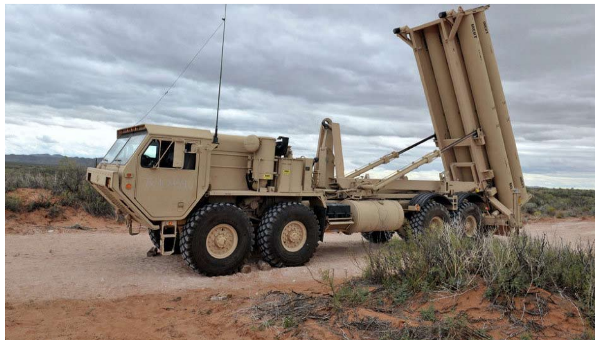
الدرع الصاروخية الامريكية موضع خلاف