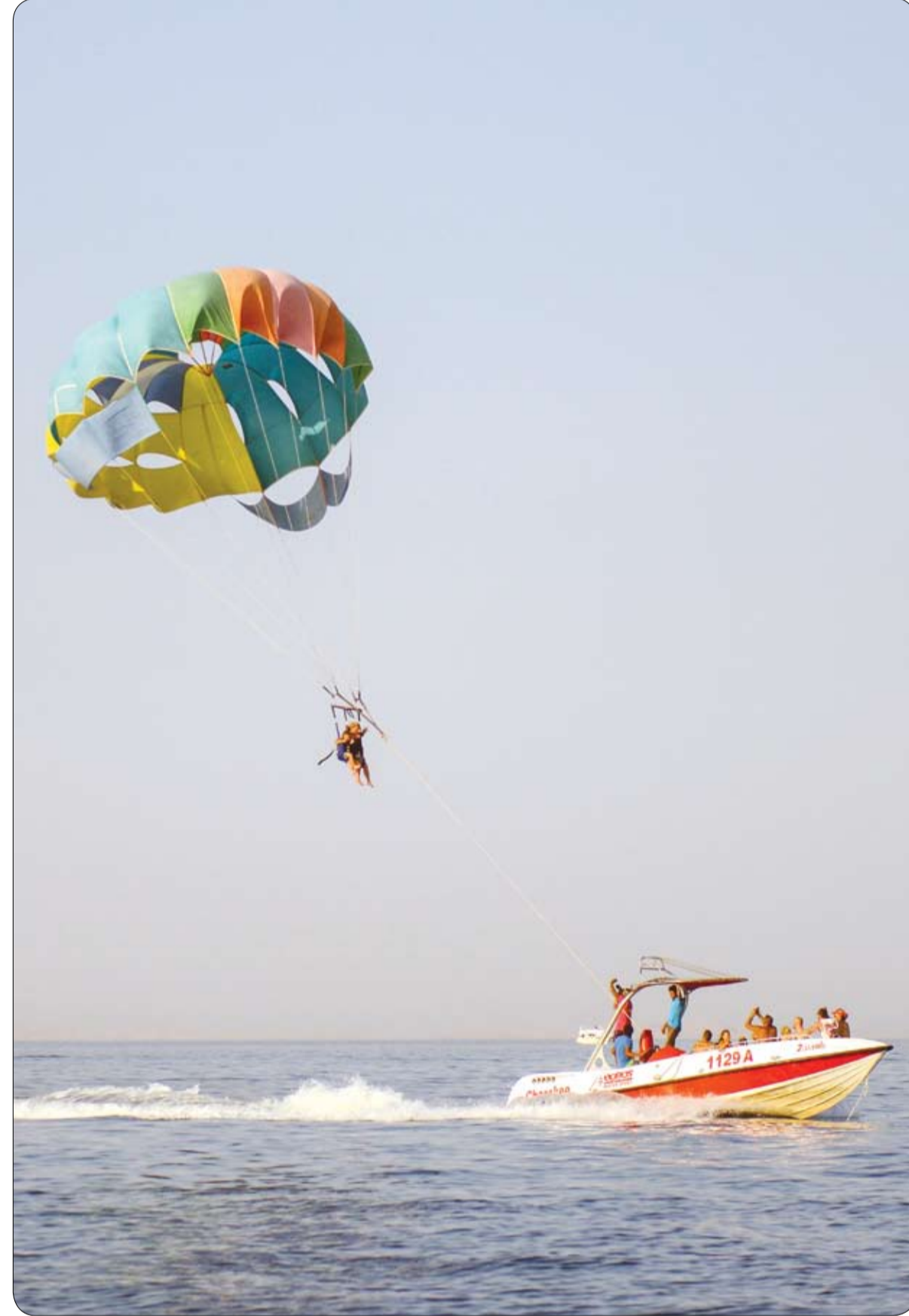
سياح يمارسون أنواعا من الرياضات الجوية في منتجع شرم الشيخ المصري على البحر الأحمر.

يبدو أن الأمير هاري نادم على التضحية الكبيرة التي قام بها تجاه شقيقه الأمير وليام وزوجته كيت ميدلتون. فقد أشارت آخر التقارير، إلى أن هاري يكره فكرة أنه أعطى خاتم والدته الأميرة ديانا المصنوع من الياقوت والألماس، إلى أخيه وليام، عشية طلب يد كيت، عام 2010. فيعد وفاة الأميرة ديانا عام 1997، تم الاحتفاظ بالعديد من أغراضها الشخصية، وتم ترك العديد منها لولديها الأمير وليام والأمير هاري واختار الأخير خاتمها. ويقول مصدر مقرب من الأسرة الملكية انه بعد وفاة ديانا، اختار الولدان تذكارا من قصر كنسينغتون عندما انتقلوا إلى غرف تشارلز في قصر سانت جيمس. حيث اختار وليام ساعة أمه الكارتييه، واختار هاري خاتمها من الياقوت والماس.