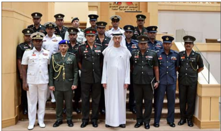
هذه العلاقات في شتى المجالات. وللاطلاع على التجربة البرلمانية للمجلس الوطني الاتحادي الحافلة بالإنجازات التشريعية والرقابية وعبر رئيس الوفد عن شكره على حفاوة الاستقبال ودعوتهم

لنصف أعضاء المجلس خلال الأعوام 2006 و2011 و2015 ومشاركة المرأة الإماراتية كناخبة وعضو، وتوسع القاعدة الانتخابية لتمكين المواطنين من المشاركة السياسية في عملية صنع القرار وترسيخ الوحدة وتعزيز التواصل والمشاركة المجتمعية والفاعلة. وأشار الظاهري إلى أن مسيرة التمكين شملت المرأة في الإمارات متقدمة أعلى المناصب فهي اليوم الشريك الفاعل في عملية البناء والتنمية فقد تقلدت حائلاً وزارية عدة منها وزير دولة للتسامح و وزيرة دولة لشؤون الشباب ووزيرة