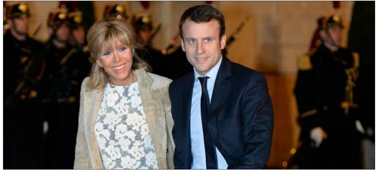
الحب لا يخضع للنواميس