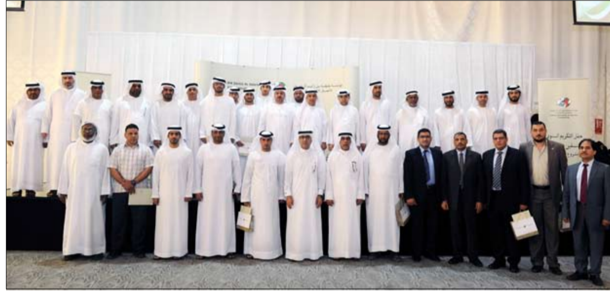
مهما إنسانيا واقتصاديا حيويا في المنطقة. وقال أن تلك المكانة المتقدمة وهذا التطور لم يكن ليتحقق من دون وضع أسس قوية للنهوض بقطاع التعليم ووضع الخطط التعليمية المتطورة التي تواكب التغييرات التي تطرأ على هذا القطاع الحيوي الذي يعد أحد أهم العناصر التي تنهض بالأمة.

والناس وأن التطوع في العمل الإنساني أحد الطرق التي يستطيع بها الفرد أن يخدم بلده ومجتمعه. وأشار إلى أن هذه المبادرة هي الأولى في العالم التي يتم فيها دعم مئات الآلاف من طلبة المدارس من الروضة حتى الجامعة وتقديم لهم كل ما يحتاجونه من أدوات مدرسية وجبات غذائية صحية بأسعار رمزية ودعم مالي كمصرف خاص لهم. وأضاف أن مؤسسة خليفة الإنسانية تربط المساعدات التي تقدمها للطلبة أو لغيرهم بإيجاد فرص عمل للمواطنين والمواطنات حيث استطاعت المؤسسة أن توفر نحو ستة آلاف فرصة عمل للمواطنين بصناعة العبايات والشيل والملابس والأحذية