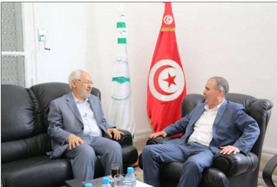
الطوبوبي والغنوشي لا إسقاط الحكومة