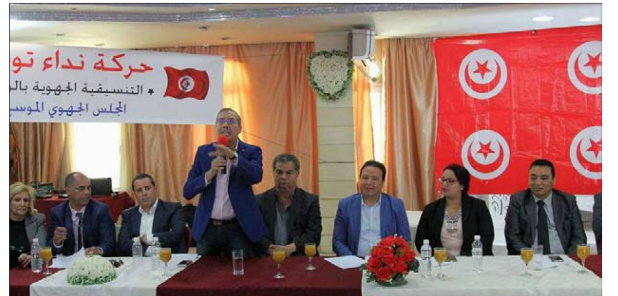
برهان بسيس النداء مع تعديل الاوتار