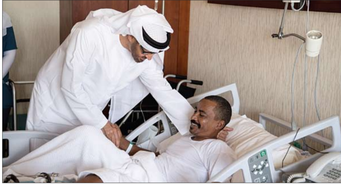
محمد بن زايد يطمئن على أحد الصابيين من الأبطال المشاركين في عملية إعادة لأمل في اليمن والذين يتلقون العلاج بمستشفى زايد العسكري (وام)

محمد بن زايد يطمئن على أحد الصابيين من الأبطال المشاركين في عملية إعادة لأمل في اليمن والذين يتلقون العلاج بمستشفى زايد العسكري (وام) ثمن صور الصمود والشجاعة والبطولة التي يتحلى بها أبناء قواتنا المسلحة محمد بن زايد يطمئن على مصابي القوات المسلحة الإماراتية والسودانية بعملية إعادة الأمل في مستشفى زايد القوات المسلحة السودانية الشقيقة المشاركين ضمن قوات التحالف العربي في عملية إعادة الأمل في اليمن والذين يتلقون العلاج في مستشفى زايد العسكري بأبوظبي. زار صاحب السمو الشيخ محمد بن زايد آل نهيان ولي عهد أبوظبي نائب القائد الأعلى للقوات المسلحة امس المصابين من قواتنا المسلحة