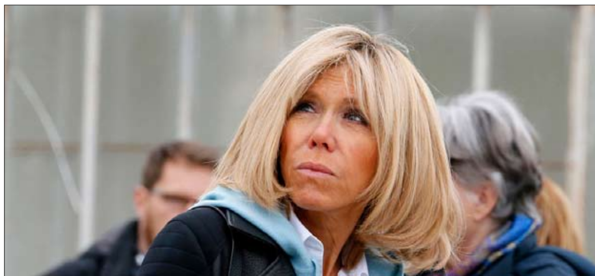
من قال ان العشق لا يصنع المعجزات