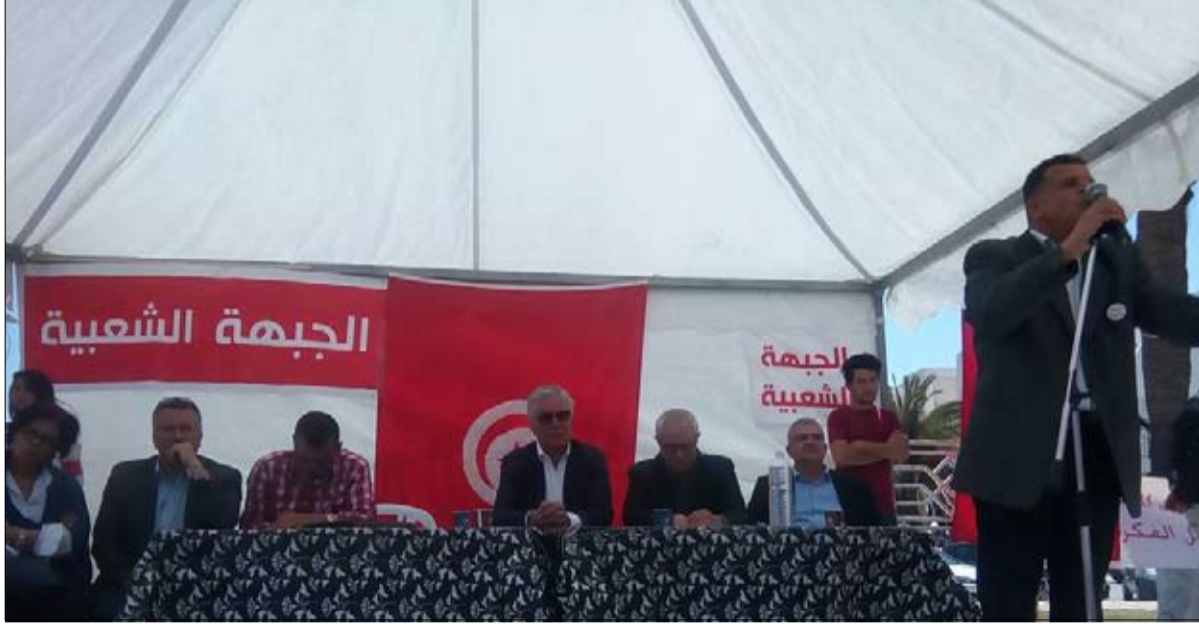
الجبهة الشعبية تدعو الى انتخابات مبكرة

ظهر السبت الأمين العام للاتحاد العام التونسي للشغل، نور الدين الطوبوبي.