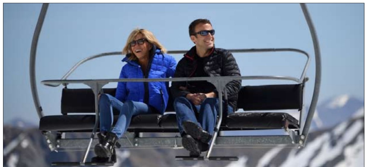
حلقا عاليا دون ان يخططا في المنطق لذلك