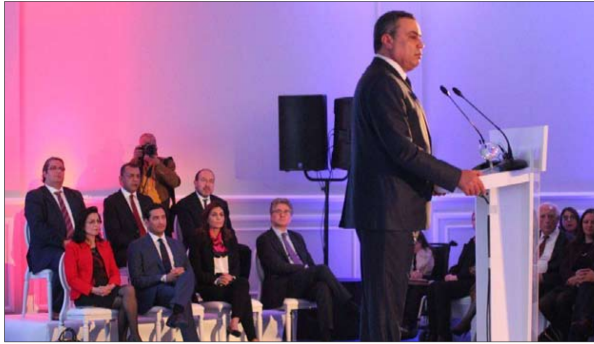
مهدي جمعة الحل في استقرار الحكومة

تجاوز الصعوبات الاقتصادية والاجتماعية الراهنة. كما دعمت الحركة مكونات الائتلاف الحاكم الى التضامن ودعم حكومة الوحدة الوطنية في ما تبذله من جهود للتواصل والحوار مع المناطق والجهات التي تشهد احتجاجات اجتماعية ومطالب ينادي اصحابها بحقهم في التشغيل والتنمية وتوزيع الثروة ورفع التهميش.