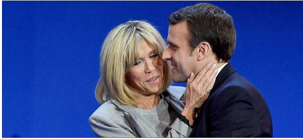
ماكرون - بريجيت قصة حب استثنائية

أعلن جهاز الأمن الوطني السوداني تحرير مواطن فرنسي كان قد خطفه مسلحون في دولة تشاد المجاورة ثم نقلوه إلى إقليم دارفور غرب السودان. وقال الأمن الوطني إن المواطن الفرنسي، الذي لم يكشف عن اسمه، في طريقه الآن إلى العاصمة السودانية الخرطوم. وكان السودان يعمل مع السلطات التشادية والفرنسية منذ أسابيع لتأمين إطلاق سراح الفرنسي الذي اختطف في أبيشي وهي منطقة تعدين تقع على بعد نحو ثمانمائة كيلومتر إلى الشرق من العاصمة التشادية أنجamina ونحو 150 كيلومترا من الحدود السودانية. وأكد مكتب الرئيس الفرنسي إطلاق سراح المواطن الفرنسي المخطوف، وقال في بيان تلقى رئيس الجمهورية ببائع الرضا نبأ إطلاق سراح مواطننا الذي اختطف في شرق تشاد ونقله خاطفوه إلى السودان. وقال السودان في مارس آذار بعد أيام من اختطاف الفرنسي إن قوات تشادية وسودانية تتعاون مع أفراد من المخابرات الفرنسية في البحث عنه، ولم يتضح من كان وراء خطفه. وعمليات الخطف نادرة الحدوث في تشاد المستعمرة الفرنسية السابقة في أفريقيا، لكن المنطقة الواقعة على الطرف الشرقي الثاني للبلاد شهدت على مدى عقود تحركات لجماعات مسلحة، منها متمردون يقاثلون الحكومة السودانية.