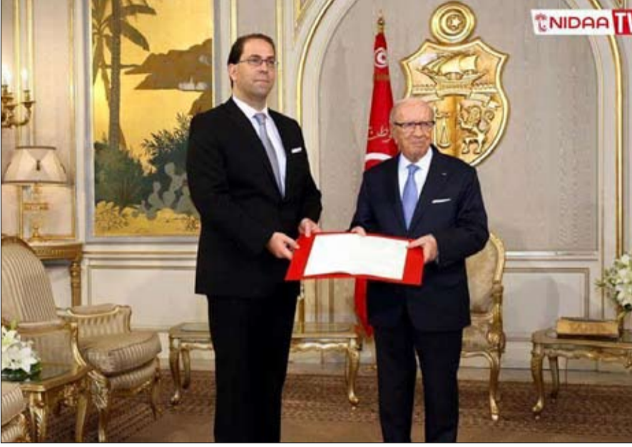
من التكليف الى الدعم تفاديا للسقوط