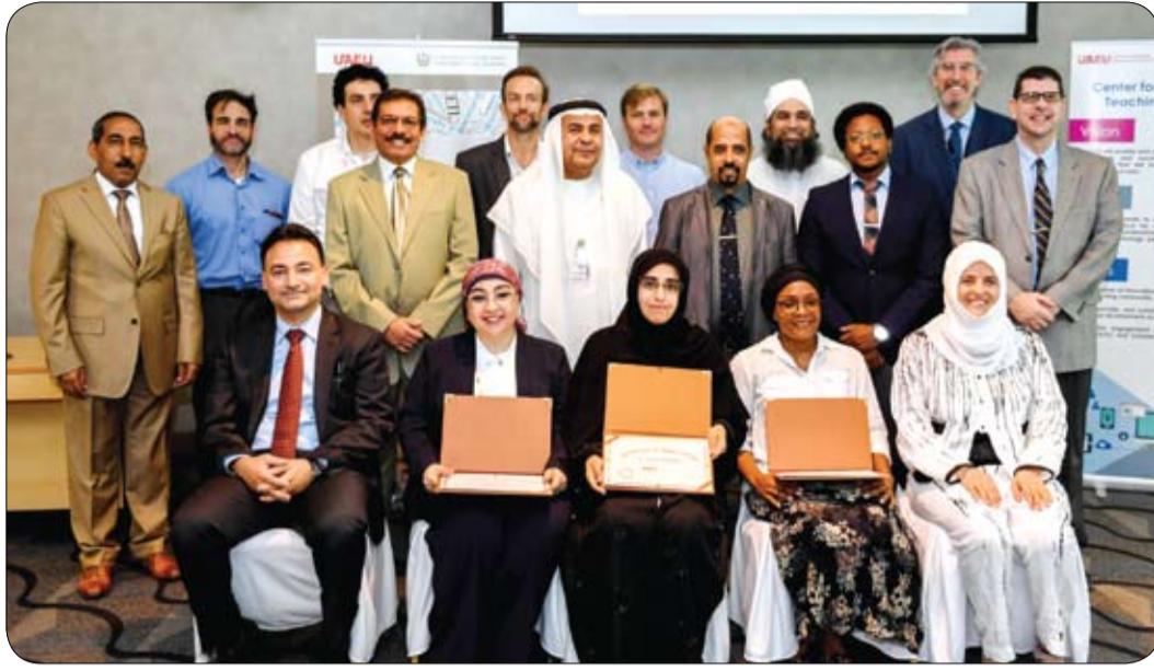
ورش عمل تطبيقية وندوات علمية، جودة التعليم واعتماد أفضل معايير البرنامج في إعداد أعضاء هيئة التدريس من مختلف الكليات الجامعية وتطوير