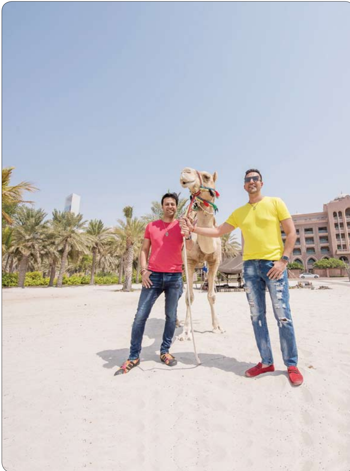
نجماً بوليفود سليم وسليمان ميرشانت يستمتعان بأجواء "قصر الإمارات" عقب عرضهما التاج في "موسم سيف أبوظبي"

نشر موقع ريبيليد يور فيوجن "rebuild your vision" ستة أشياء تصيب الإنسان بالعمى على المدى الطويل، قد يجهلها الكثيرون. وأوضح الموقع أن من أهم هذه الأشياء هو ضوء الهاتف المحمول؛ حيث إن الضوء الأزرق المنبعث من الهاتف الخاص بك يمكن أن يسبب عدم وضوح الرؤية، وإجهاد وجفاف العين. كما أن ضوء الشمس يمكن أن يصيب الإنسان بالعمى إذا حرق فيه، فالأشعة فوق البنفسجية تخترق القرنية ويمكن أن تؤدي إلى عدد من الأمراض الضارة، بما في ذلك سرطان الجفن، سرطان المتحممة، إعتام عدسة العين، التهاب القرنية أو حروق القرنية. أجهزة الكمبيوتر التي أصبحت في كل مكان الآن، يمكن أن تؤدي إلى متلازمة الرؤية التي تشمل أعراضها، رؤية غير واضحة، إجهاد العين، الصداع، كذلك العدسات اللاصقة، يمكن أن تؤدي إلى بعض الالتهابات الخطيرة التي قد تسبب العمى. أظهرت الدراسات الحديثة -أيضاً- أن التدخين يمكن أن يؤدي إلى فقدان البصر والعمى، ويزداد معه عدد من الأمراض مثل إعتام عدسة العين، متلازمة العين الجافة. وأخيراً العديد من قطرات العين ليست مناسبة للاستخدام العام؛ حيث إنها تحتوي على مكونات محددة لتخفيف عرض معين، بعض المواد الكيميائية المستخدمة قد تؤدي إلى رد فعل تحسسي، ما يتسبب في احمرار العين المزمن، وطبيب العيون هو الشخص القادر على تحديد نوع القطرة المناسبة لكل حالة على حدة لتناسب حالة عينك.