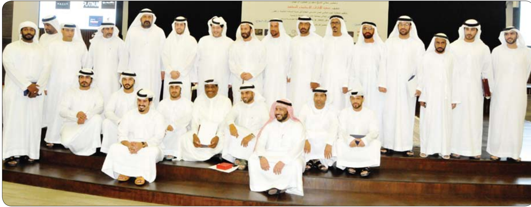
برعاية محمد بن زايد وحضور سعيد بن طحنون