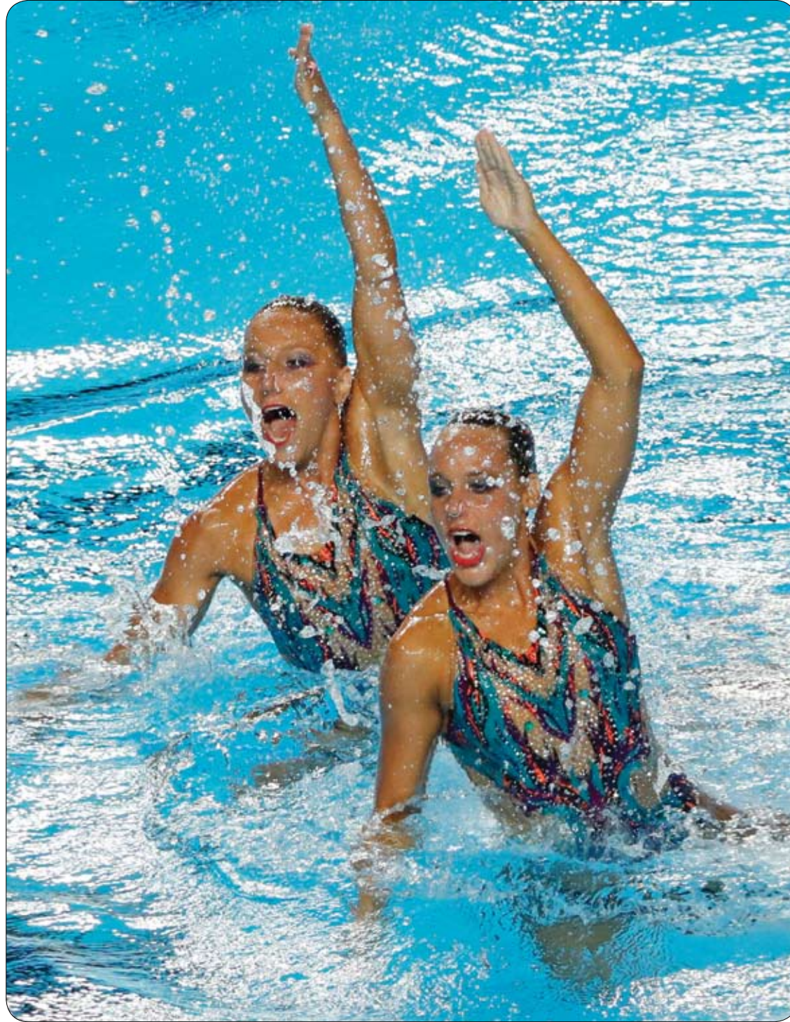
فتاتان من فريق المجر خلال منافسة في نهائي العرض الفني للسيدات خلال مسابقة السباحة الإيقاعية في بطولة العالم فيينا 2017.

اختبار الدم الكامل. يكشف هذا الاختبار العدوى الفيروسية مثل السل والملاريا، كما يقوم بعد خلايا الدم الحمراء والبيضاء والصفائح الدموية ونسبة الهيموغلوبين، وقياس نسبة الكوليسترول والمعادن مثل الصوديوم والدهون الثلاثية.