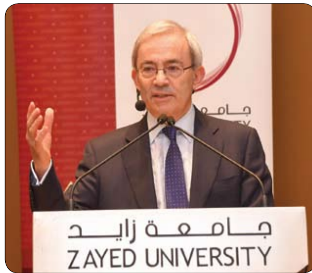
الحائز على جائزة نوبل عام 2010