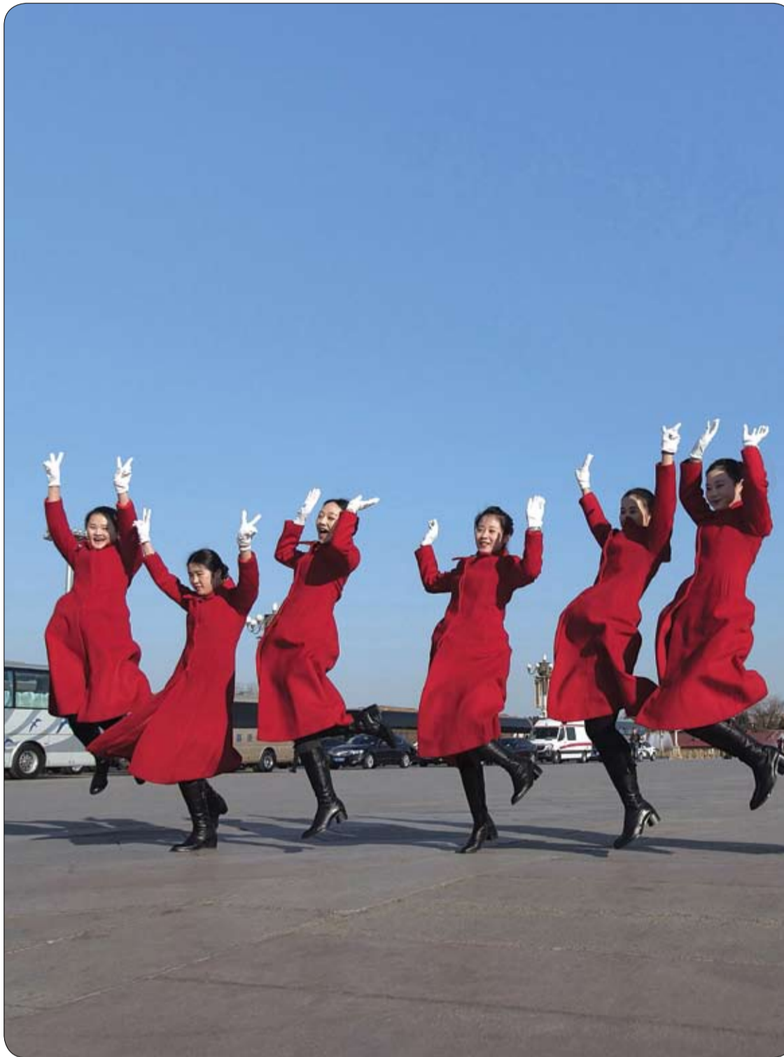
مضيفات تقفزن إلى أعلى لإلتقاط صورة خلال افتتاح مؤتمر الشعب الوطني في بكين.

داء السكري من الأمراض المنتشرة لا سيما بين كبار السن، ويخشى الأطباء من تزايد عدد المرضى خلال السنوات القادمة، خاصة أن هناك الملايين من الحالات التي لم يتم تشخيصها بعد. يأتي ذلك في الوقت الذي تقوم فيه معظم الشركات المصنعة للأطعمة الجاهزة بإضافة السكر إلى منتجاتها، مما يشكل خطورة مضاعفة على الصحة، ولذلك تقدم أكاديمية التغذية وعلم الغذاء هذه النصائح المهمة لخفض السكريات المضافة وزيادة الوعي حول المنتجات التي تحتوي عليه كما يلي: 1- اقرأ ملصق المكونات جيداً وتعلم الأسماء التجارية والعلمية للسكر، مثل شراب الذرة، سكر العنب، محليات الذرة أو بلورات القصب. 2- تعرف على السكر المضاف المخفي داخل الأطعمة الصحية مثل الجرانولا، الحبوب الكاملة، ودقيق الشوفان، والفواكه المجففة، والفاكهة العلية، والصلصات المختلفة، مثل الكاتشاب، الباربيكيو. 3- تجنب المشروبات المحلاة والصناعية، والموثة ومشروبات الطاقة، والعصائر العلية، والمخوق والمخلوطة مع الفواكه، والمنكهة، وكل شراب مكتوب عليه طبيعي، اشرب الحليب أو الماء أو الفواكه المحضرة في المنزل. 4- تجنب لبن الزبادي الذي يحتوي على فواكه أو نكهات، لأنه على الأغلب يحتوي على الكثير من السكر. 5- تجنب المنتجات التي تدعي أنها خالية من الدسم ومن السكر، خصوصاً المخبوزات والبسكويت والحلويات لأنها على الأغلب تحتوي على سكر صناعي وهذا ضرره أسوأ على الجسم.