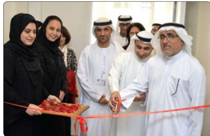
والاجتماعية على توفير أصهار الكتب الإنسانية، ويتفاعل معها بما يثرى المجتمع ويساهم في المشاركة الفاعلة في الإنتاج الثقافي وبناء الإنسان، ومن هذا المنطلق تعمل كلية العلوم الإنسانية