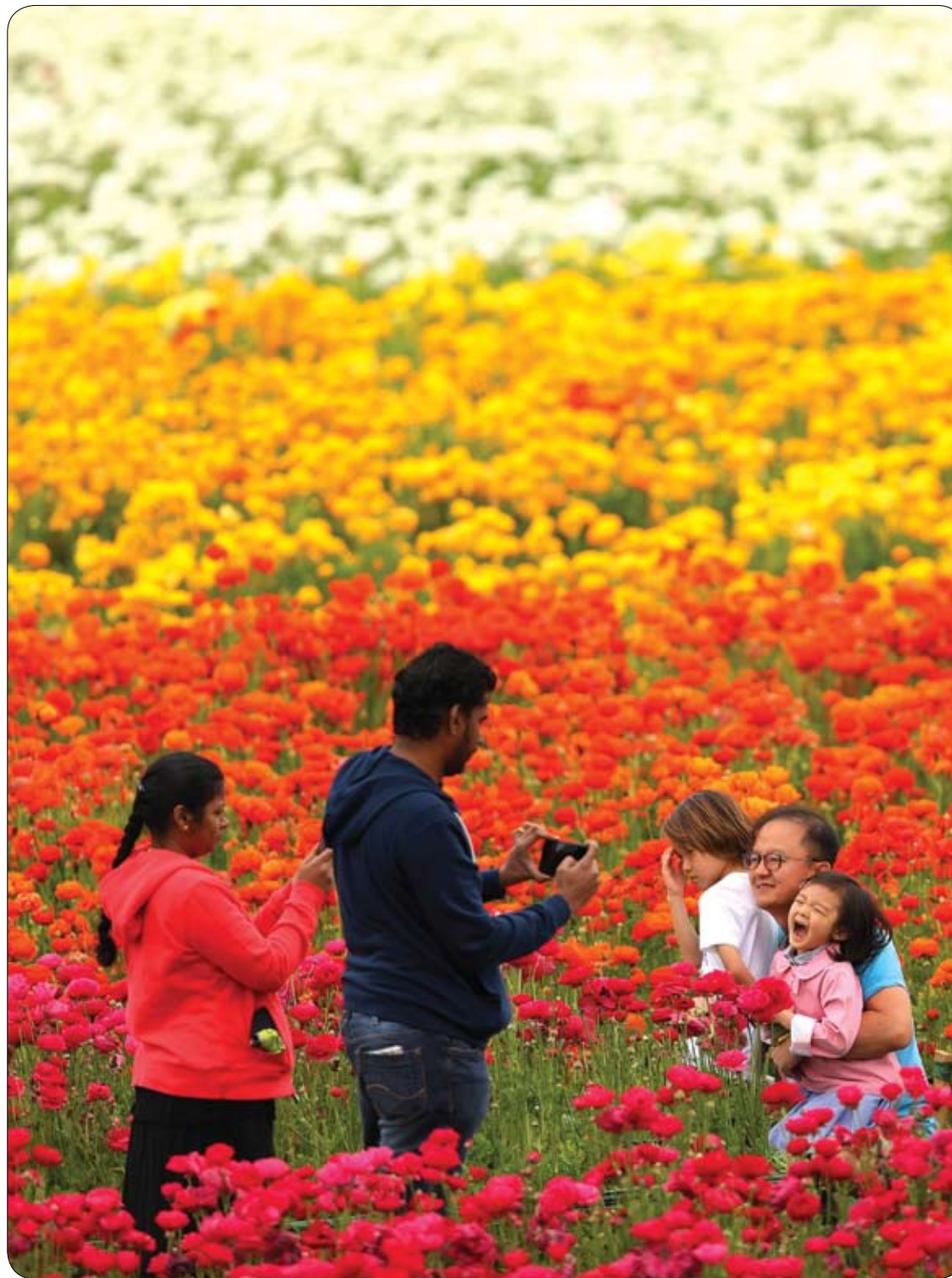
زوار يلتقطون صورا في حقل من الزهور خلال اليوم الأول من الربيع في كارلسباد بكاليفورنيا.

ويصاب الناس بهذا المرض نتيجة تأثير الهواء على الأوعية الدموية والأعصاب، والجلد، وعلى نسيج العظم، لذا فإن أول طرق الوقاية من الإصابة به تتمثل في تدفئة الوجه وحمايته من التعرض للهواء البارد، ويجب إبقاء نافذة السيارة مفتوحة أثناء سيرها في الطقس البارد يزيد من نسبة التعرض لشلل الوجه، ولذا على الشخص إغلاق النوافذ أثناء القيادة، والحرص على عدم النوم في أجواء باردة.