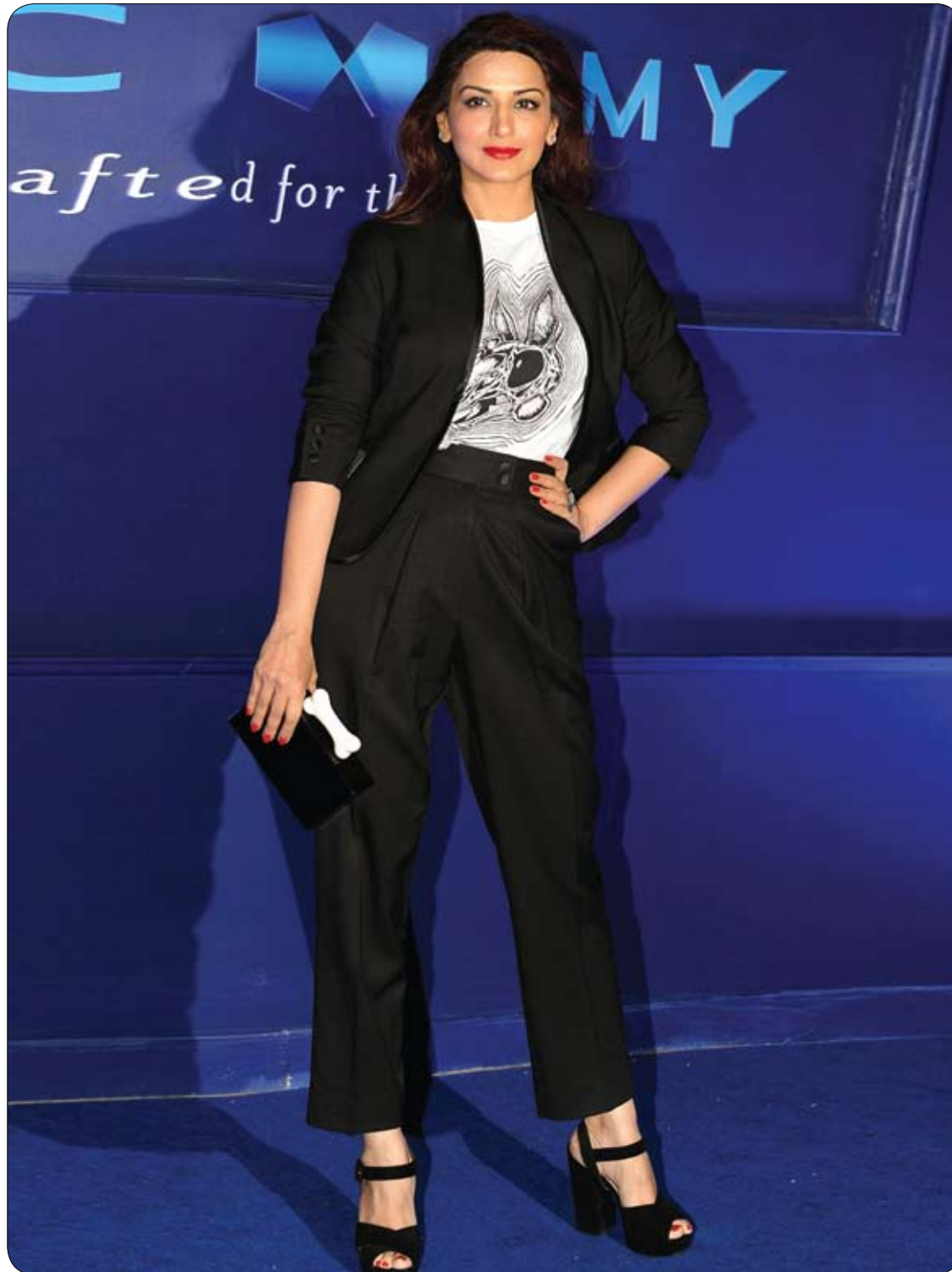
ممثلة بوليوود الهندية سونالي بندر خلال حضورها الفعالية الترويجية Chivas 18 Alchemy في مومباي. (ا ف ب)