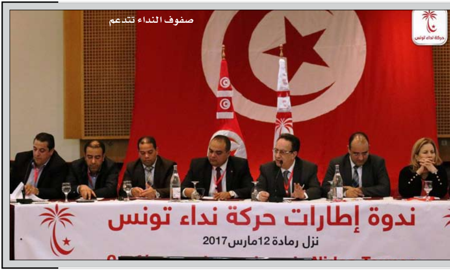
صفوف النداء تتدعم