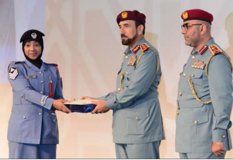
برعاية سيف بن زايد