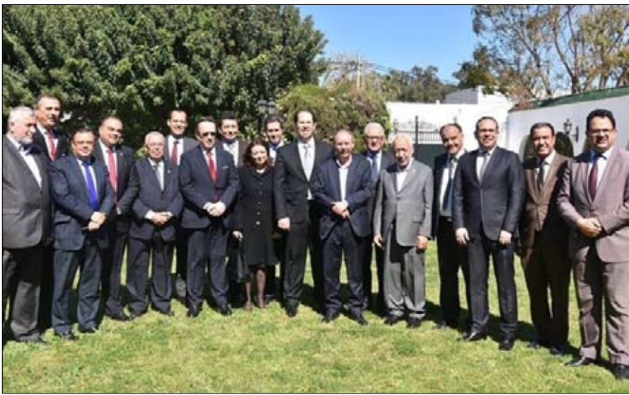
منتخب وثيقة قرطاج في دار الضيافة

وأشار الغنوشي إلى أهمية التنسيق بين الكتل البرلمانية للأحزاب