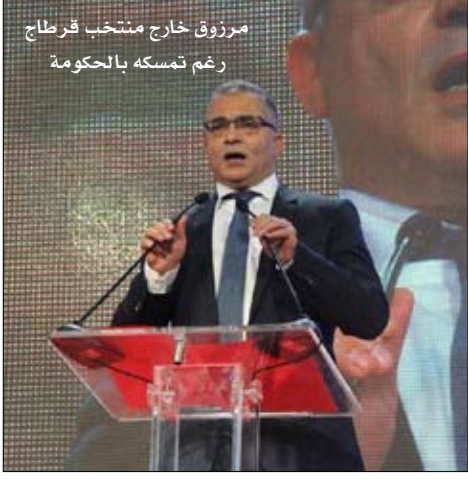
مرزوق خارج منتخب قرطاج رغم تمسكه بالحكومة