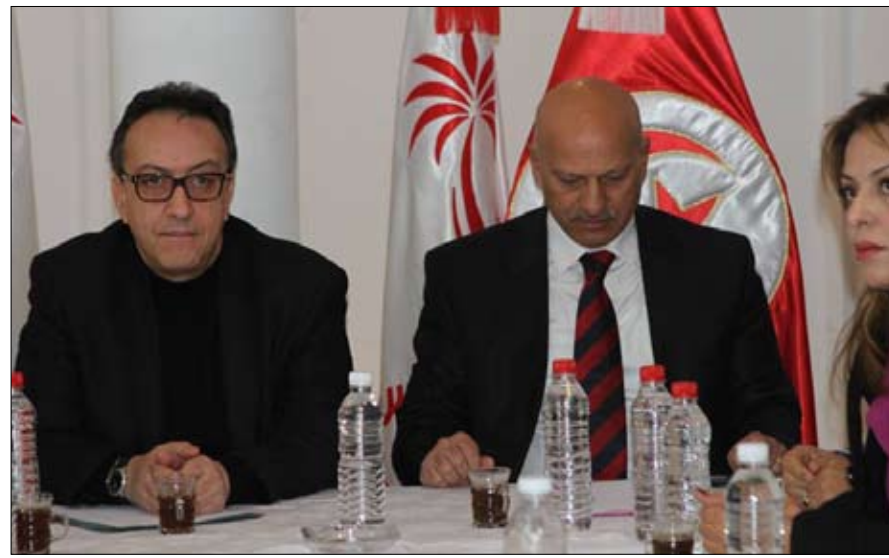
بين حافظ وبلحاج الحركة مستمرة

وتابع قائلا: إن الهيئة التسييرية تنبه مرة أخرى من التعامل مع حافظ ومجموعته باعتباره كان سببا في أزمة الحكومة وخاصة بعد التسييريات الأخيرة .