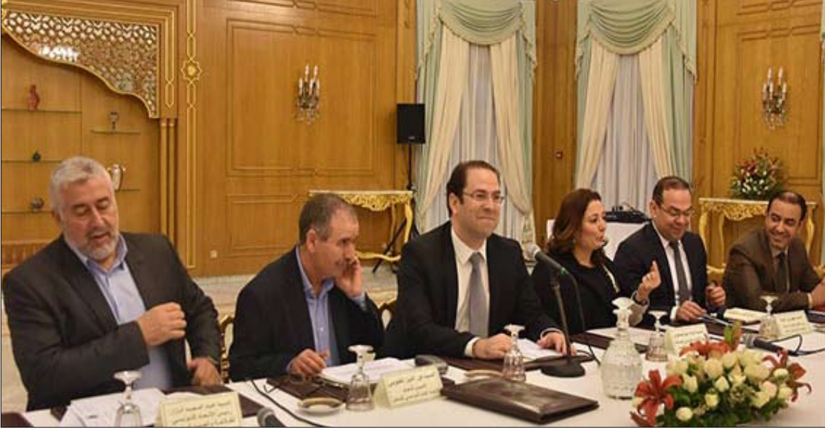
الشاهد قدم ولكن