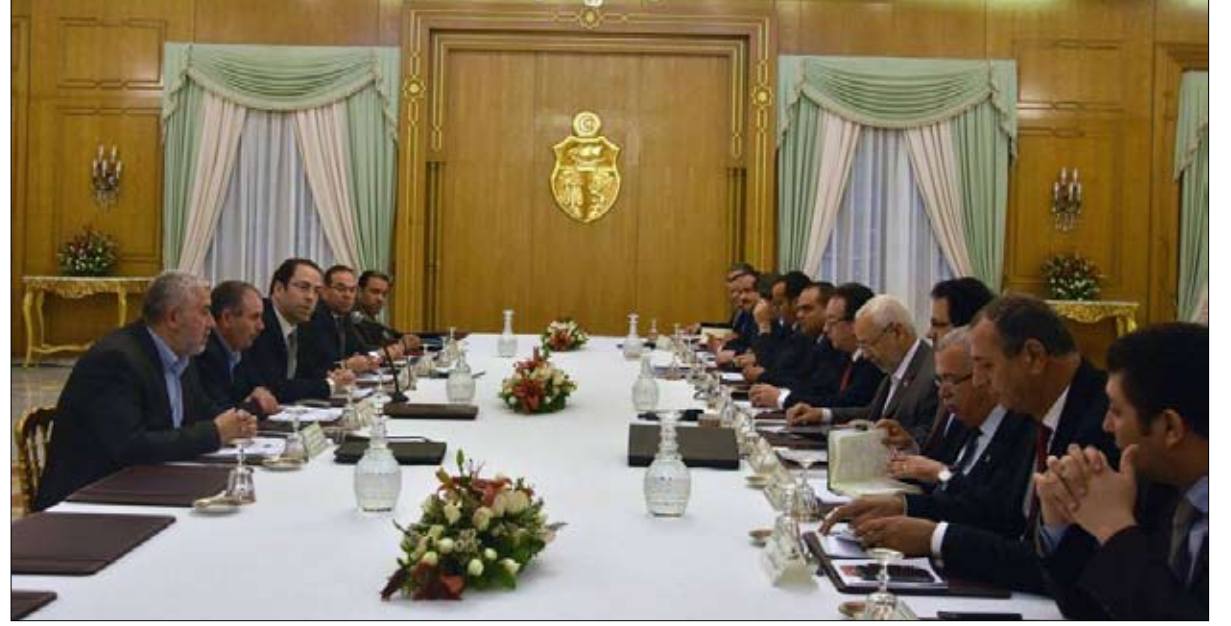
اجتماع الاستعداد للمرحلة القادمة

وتابع قائلا: إن الهيئة التسييرية تنبه مرة أخرى من التعامل مع حافظ ومجموعته باعتباره كان سببا في أزمة الحكومة وخاصة بعد التسييريات الأخيرة .