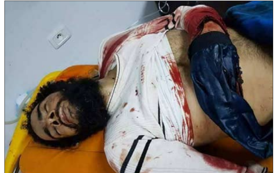
جثة احد الارهابيين