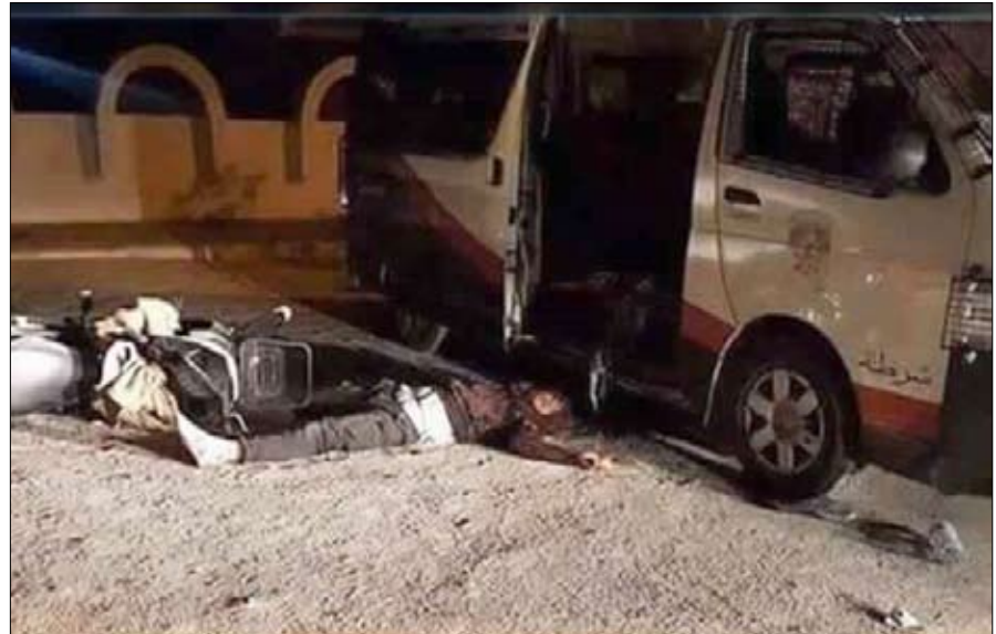
مسرح العملية الارهابية