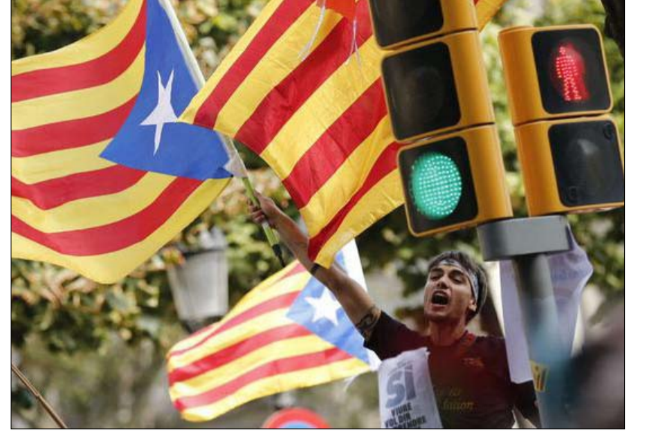
كاتالونيا.. بروفة للاخريين

القضية الانفصالية الباسكية لم تخف تماما، وتبقى مرتبطة في جانب منها بكاتالونيا