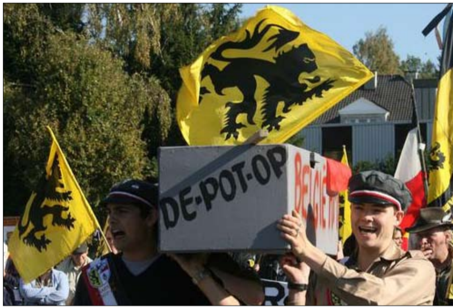
بلجيكا.. انقسام لغوي واقتصادي

تتألف في معظمها من المجريين، تعرف مدا انفصاليا قديما، أحياه سقوط الستار الحديدي عام 1989. في الانتخابات البرلمانية الأخيرة عام 2016، تمكن الاتحاد الديمقراطي للمجريين في رومانيا، الذي يتنازل من أجل فدرلة البلاد، من الفوز بـ 21 مقعدا من بين 329 مقعدا. ومنطقة السيكي ليست المثال الوحيد لطالب الألفية المجرية في أوروبا الشرقية، فنفس الحالة، ولكن أقل وضوحا، في صربيا ورومانيا وسلوفاكيا (انظر الإطار في نهاية المقال).