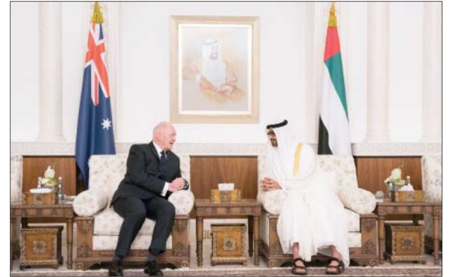
بحث مع حاكم عام استراليا العلاقات الثنائية ومجمل الأحداث الإقليمية والدولية