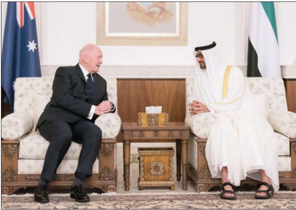
محمد بن زايد خلال محادثات مع الحاكم العام لأستراليا

•• أبوظبي-وام: استقبل صاحب السمو الشيخ محمد بن زايد آل نهيان ولي عهد أبوظبي نائب القائد الأعلى للقوات المسلحة في قصر المشرف بأبوظبي امس معالي السير بيتر كوسغروف الحاكم العام لأستراليا الذي يقوم بزيارة رسمية للبلاد ترافقه حرمه معالي السيدة لين كوسغروف ووفد رفيع . وجرت لمعالي بيتر كوسغروف لدى وصوله إلى قصر المشرف مراسم استقبال رسمية في ساحة القصر حيث توجه الحاكم العام لأستراليا وصاحب السمو الشيخ محمد بن زايد آل نهيان إلى منصة الشرف وعزفت الموسيقى السلام الوطني لأستراليا فيما أطلقت المدفعية 21 طلقة تحية لضيف البلاد. بعدها اصطحب صاحب السمو الشيخ محمد بن زايد آل نهيان ..حاكم عام أستراليا إلى قاعة الاستقبال في قصر المشرف حيث صافح صاحب السمو الشيخ محمد بن زايد آل نهيان كبار المسؤولين المرافقين لمعالي بيتر كوسغروف فيما صافح حاكم عام أستراليا مستقبليه من الشيوخ والوزراء وكبار المسؤولين بالذولة. وفي بداية المحادثات رحب صاحب السمو الشيخ محمد بن زايد آل نهيان بحاكم عام أستراليا والوفد المرافق ..معربا سموه عن سعادته بهذه الزيارة وتمنياته أن تسهم في تعزيز علاقات الصداقة والتعاون بين دولة الإمارات وأستراليا. (التفاصيل ص2)