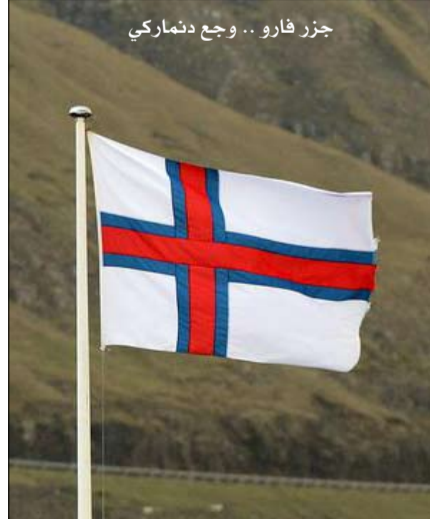
جزر فارو .. وجه دنماركي