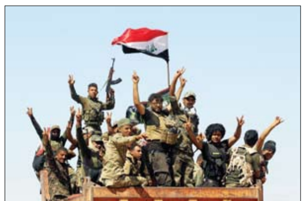
جنود عراقيون يتقدمون في غرب الحويجة

ما تبقى من مناطق في الحويجة، وكان القائد العام للقوات المسلحة العراقية حيدر العبادي أعلن فجر الجمعة، عن انطلاق المرحلة الثانية من عمليات تحرير الحويجة والمناطق المحيطة بها.