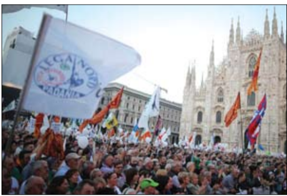
دولة بادانيا حلم رابطة الشمال

اتجهت عيون أوروبا في الأيام الاخيرة إلى كاتالونيا. ويذكر الاستفتاء الذي جرى أمس الأحد كيف يمكن للارادة الانفصالية أن تولد أو تنتعش بسرعة، بتطور الأحداث والدول حتى في أوروبا. في سياق كاتالونيا، تطلب العديد من المناطق أيضا مزيدا من الحكم الذاتي، ان لم يكن استقلالا كاملا. ويريد بعضها أيضا الاستفادة من الحراك الإسباني لتأكيد تطلماتها.