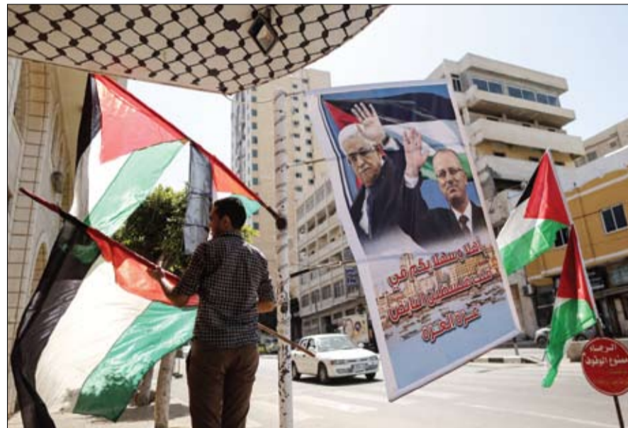
مالك أحد المحلات في غزة يعلق الأعلام الفلسطينية ولافتات عليها صور الرئيس عباس ورئيس وزرائه

الداخلية التابعة لحماس الأحد عن خمسة معتقلين كانوا موقوفين على ذمة قضايا تتعلق بالماس بالامن الداخلي، وذلك في إطار تعزيز أجواء المصالحة والتوافق الوطني بحسب بيان صادر عن الوزارة.