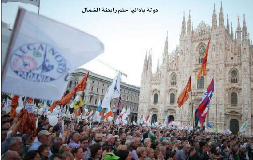
دولة بادانيا حلم رابطة الشمال

تأسست حركة رابطة الشمال الإيطالية عام 1991. طامحة الى إنشاء منطقة حكم ذاتي في شمال إيطاليا. وهكذا تكون دولة "بادانيا" قد جمعت الأقاليم الواقعة حول سهل نهر بو.