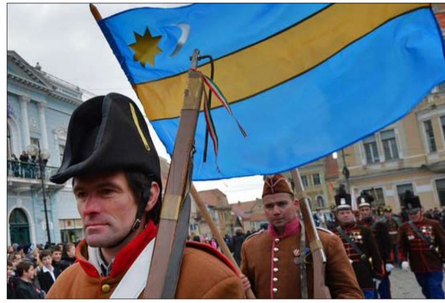
السيكي.. تهديد مجري في رومانيا

المناطق الانفصالية التي تطالب بالانتماء إلى إقليم آخر تبدو مختلفة، ولهذا السبب لم تندرج إيرلندا الشمالية في هذه القائمة، على الرغم من أنه نزاع استقلالي رمزي. وبالمثل، فإن المناطق ذات التاريخ الذي يتسم بدعوات انفصالية ولكن عواقبها أقل، مثل بروتاني في فرنسا، ليست مدرجة.