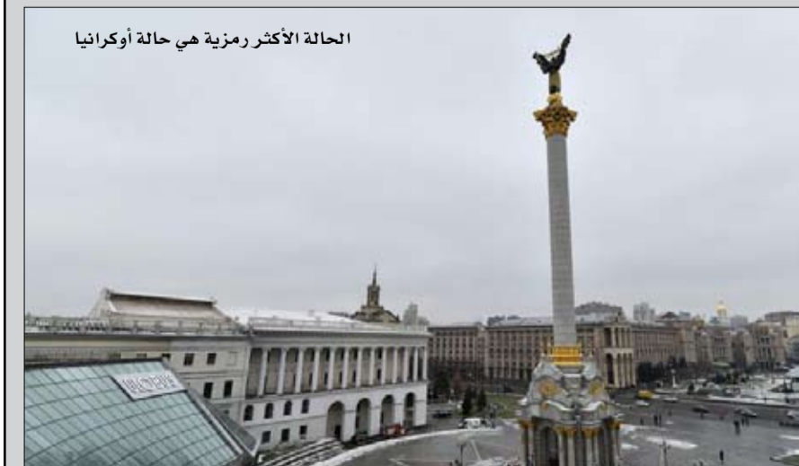
الحالة الأكثر رمزية هي حالة أوكرانيا

في البلقان أو على حدود روسيا، توجد أيضا مطالب لتقرير المصير سواء عبر حكم ذاتي أو الانفصال. وهذه التوترات الإقليمية، ان لم نقل هذه الصراعات الكامنة، تختلف طبيعتها عن النزاعات المماثلة في أوروبا الغربية بما انها، إلى حد كبير، نتيجة إعادة التشكيل المنقوصة لحدود الاتحاد السوفياتي ويوغوسلافيا السابقة. الحالة الأكثر رمزية هي حالة أوكرانيا. بعد ثورة الميدان عام 2014، رفضت دونباس، في شرق البلاد وقريبة ثقافيا ولغويا من روسيا، رفضت اتفاق الشراكة مع الاتحاد الأوروبي. ولد صراع، غذته روسيا، التي تدخلت عسكريا لدعم متمردي دونيتسك ولوغانسك المنفصلين. اليوم بحكم الأمر الواقع عن أوكرانيا، وهما تحت الرعاية الكثيفة لموسكو. اما القرم فقد ضمها روسيا، وتحدثت موسكو عن "استعادة"، تجربها بالاستفتاء الذي نظم في شبه الجزيرة وفاز به الموالون لروسيا بأغلبية ساحقة. وفي صربيا، شهدت منطقة فويفودينا، المتمتعة بالحكم الذاتي في الشمال، واين تعايش 25 قومية، منها أقلية هنغارية كبيرة، وست لغات رسمية، شهدت توترات طائفية عام 2013