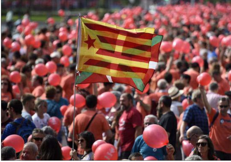
بلاد الباسك تطالب بالاعتراف بقوميتها