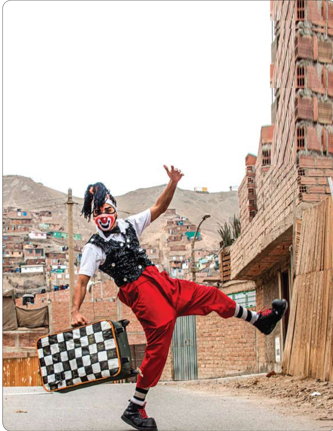
مهرج يرتدي قناع وجه قبل أداء فقرة في منطقة بوينتي بيدرا، في الضواحي الشمالية لبيما، حيث لا يزال السيرك في بيرو مغلقاً، مما دفع المهرجين لأداء عروضهم في شوارع لبيما.