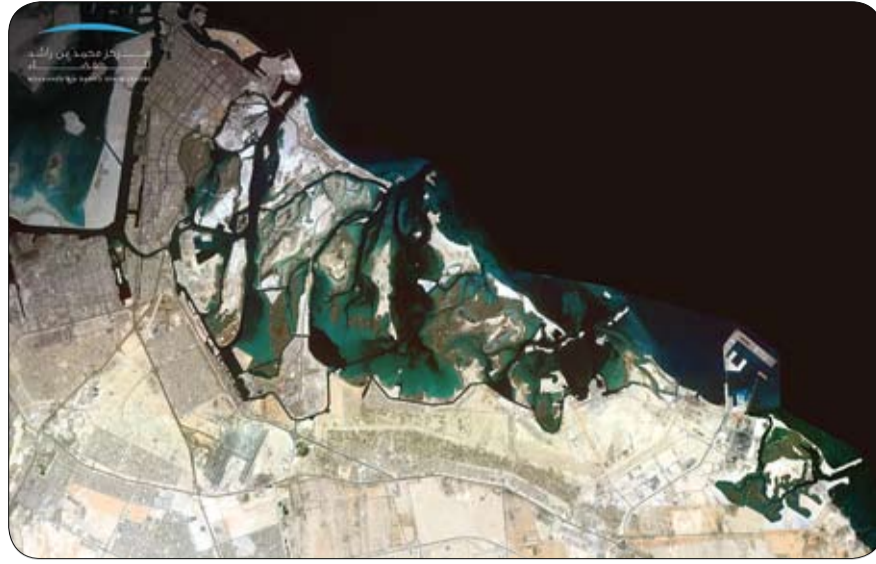
عن طريق القمر الاصطناعي خليفة سات