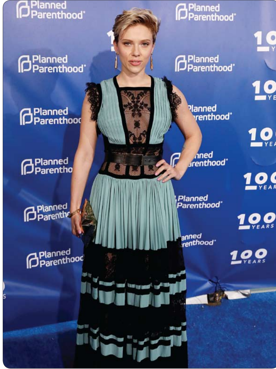
المثلة سكارليت جوهانسون خلال حضورها الاحتفال بمرور 100 سنة على تنظيم الأسرة في نيويورك.

للمرة الأولى، توصل باحثون من جامعة ليستر البريطانية، إلى أن البكتيريا المسببة لالتهابات الجهاز التنفسي تتأثر مباشرة بتلوث الهواء، لتزيد من احتمالات العدوى وتغيير فاعلية العلاج بالمضادات الحيوية. وشهد الباحثون - في سياق أبحاثهم التي نشرت في مجلة "علم الأحياء الدقيقة البيئية" - على أن النتائج المتوصل إليها تدعم آثارا مهمة لعلاج الأمراض المعدية، التي من المعروف أنها تزداد في المناطق التي توجد فيها مستويات عالية من تلوث الهواء. فقد بحثت الدراسة في كيفية تأثير تلوث الهواء على البكتيريا التي تعيش في أجسامنا، وتحديدًا في الجهاز التنفسي، الأنف والحنجرة والربو. ويعد الكربون الأسود العنصر الرئيسي لتلوث الهواء والناجم عن احتراق الوقود الأحفوري مثل الديزل والوقود الحيوي والكتلة الحيوية. وتظهر الأبحاث أن هذه الملوثات تعمل على تغيير الطريقة التي تنمو من خلالها البكتيريا في المجتمعات، التي تؤثر على كيفية البقاء على قيد الحياة على جدار بطانة الجهاز التنفسي للإنسان، لتصبح قادرة على الاختباء ومهاجمة الأنظمة المناعية. وقالت الطبيبة جولي موريس، أستاذ علم الميكروبات والوراثة في جامعة ليستر البريطانية، "إن النتائج المتوصل إليها تزيد فهمنا لكيفية تلوث الهواء وتأثيره على صحة الإنسان، كما يدل على أن البكتيريا تسبب التهابات في الجهاز التنفسي لتضاعف من مخاطر انتقال العدوى ومكافحة آلية عمل المضادات الحيوية".