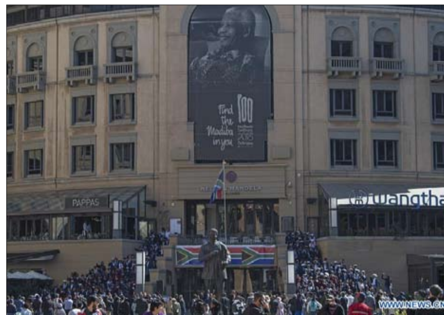
رسالة مانديلا سارية المفعول

ألا تمثل هذه الطريقة الجديدة، تعبيراً عن طريقة أخرى لممارسة السياسة تتجلى هنا وهناك، وترجم أيضاً صعود اليمين المتطرف، أو صعود تأكيد الهويات القومية والفنوية؟ ومن الواضح أن طريقة ترامب وغيره، ليست ظاهرة جديدة تماماً. فالعلاقات الدولية لم تكن أبداً حديقة ورود. ولم تنتظر الحرب السورية حتى يتم انتهاك القانون الدولي، فالقرار 242 الذي أصدرته الأمم المتحدة عام 1967، على سبيل المثال، يدعو إلى "انسحاب الجيوش الإسرائيلية من الأراضي المحتلة"، ولم تنفذه إسرائيل قط، حيث تواصل سياسة الاستيطان خارج الخط الأخضر.