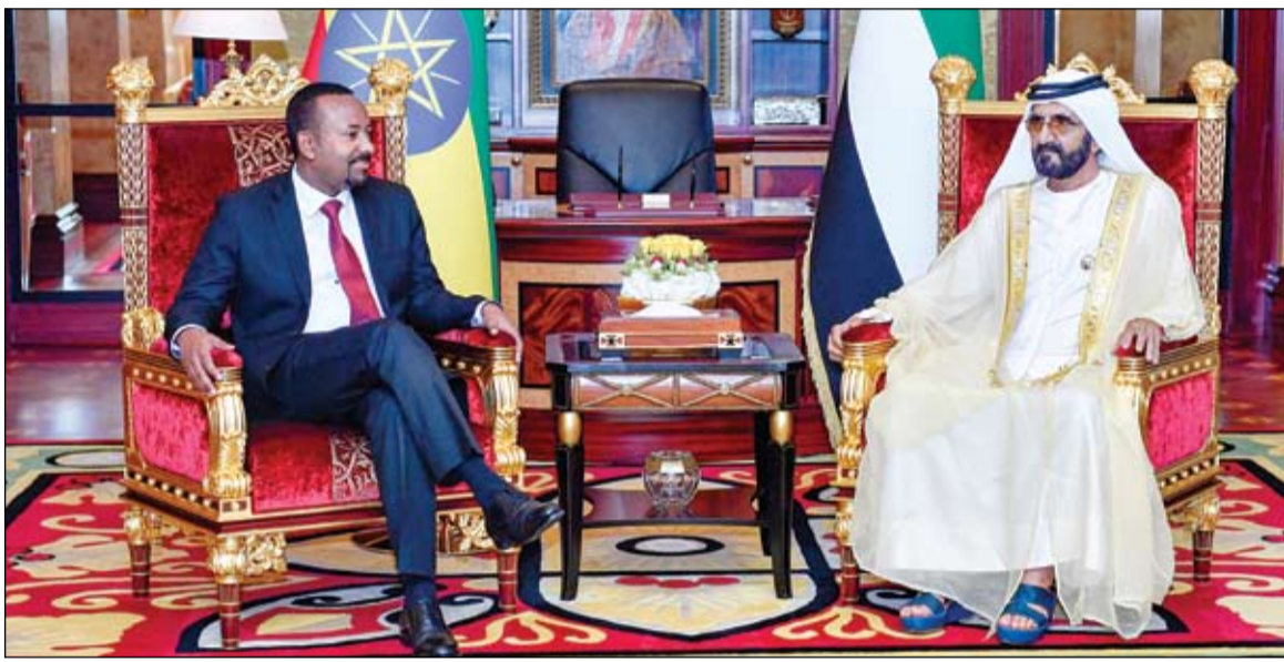
محمد بن راشد خلال استقبله رئيس وزراء إثيوبيا

قال وزير الخارجية الأمريكي مايك بومبيو، أمس الجمعة، إن اعتراض أسلحة من إيران في طريقها للحوثيين دليل على أنها أكبر دولة راعية للإرهاب، مشدداً على أن طهران تتحدى مجلس الأمن بتزويدها بأسلحة للحوثيين، مطالبا بتحريك دولي لتجديد حظر الأسلحة المفروض عليها والذي ينتهي قريباً. وقال بومبيو بتفريدة على حسابه في تويتر: البحرية الأمريكية اعترضت 385 صاروخاً إيراني الصنع ومكونات أسلحة أخرى في طريقها إلى الحوثيين باليمن، مثال آخر على مواصلة إيران أكبر دولة راعية للإرهاب في العالم في تحديها لمجلس الأمن الدولي. وأضاف بومبيو، يجب على العالم أن يرفض عنف إيران ويتحرك الآن لتجديد حظر الأسلحة المفروض عليها والذي ينتهي قريباً. وأرفق بومبيو صورة من الأسلحة الإيرانية المضبوطة. وأعلن الجيش الأمريكي، الخميس، أن سفينة تابعة للبحرية الأمريكية صادرت أسلحة من تصميم وتصنيع إيراني تشمل أكثر من 150 صاروخاً موجهاً مضاداً للدبابات و3 صواريخ إيرانية سطح جو. وتابع الجيش في بيان أن بحارة السفينة نورماندي اعتلوا سفينة شراعية في بحر العرب يوم الأحد الماضي. كما أضافت الأسلحة المصادرة شملت 150 صاروخاً موجهاً مضاداً للدبابات من طراز دهلاوية وهو تقليد إيراني للصاروخ الروسي كورنيت. في حين أكد أن مكونات الأسلحة الأخرى المصادرة من السفينة الشراعية من تصميم وتصنيع إيراني، وتشمل ثلاثة صواريخ إيرانية سطح جو وأجهزة تصوير حراري ومكونات إيرانية لعتاد بحري وجوي مسير. إلى ذلك، قالت القيادة المركزية الأمريكية، إن إرسال أسلحة للحوثيين ينتهك قرارات مجلس الأمن.