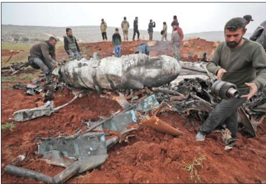
سوريون يعاينون حطام المروحية التي سقطت في ريف حلب

مصادر أخرى أن المسافة بين قوات الجيش السوري ومعبر باب الهوى الحدودي أصبحت 20 كم. وأعلن المرصد السوري لحقوق الإنسان في الفصائل المسلحة تمكنت للمرة الثانية خلال ثلاثة أيام من إسقاط مروحية تابعة للجيش السوري، وذلك بعد أن كانت تمكنت من إسقاط مروحية في ريف حلب الغربي ومقتل جميع عناصرها. وقالت مصادر ميدانية إن طاقم المروحية قتل. وتوَّيرو محافظة إدلب وأجزاء متاخمة لها في محافظات مجاورة ما يقارب 3 ملايين نسمة نصفهم من النازحين، وتهيمن هيئة تحرير الشام (جبهة النصرة سابقاً) على الجزء الأكبر منها، وتنشط فيها أيضاً فصائل متشددة ومعارضة أقل نفوذاً.