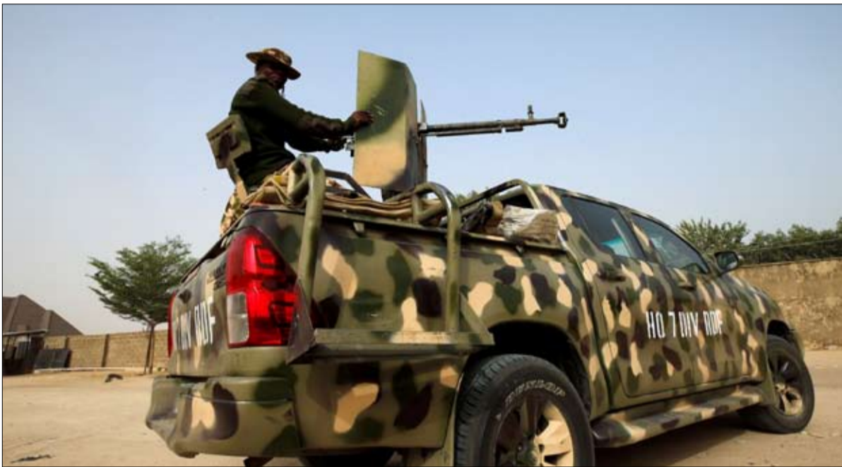
•• أبوجا- رويترز

قالت منظمة العفو الدولية أمس الأول إن الجيش النيجيري أحرق قري وأجبر مئات على النزوح من ممتلكات مع المتشددين في شمال شرق البلاد. وتعرض الجيش النيجيري مرارا لاتهامات بانتهاك حقوق الإنسان في صراعه المستمر منذ عشر سنوات مع جماعة بوكو حرام ومع فرع تنظيم داعش الإرهابي في غرب أفريقيا. ولم يرد الجيش على طلبات للتعليق. وأكد ثلاثة من السكان قابلتهم رويترز ما توصلت إليه منظمة العفو الدولية. وأدت الاتهامات سابقة إلى تحقيقات من جانب المحكمة الجنائية الدولية في لاهاي وعرفت قدرة نيجيريا على شراء أسلحة مما سبب شعورا بالإحباط لدى قادة جيشها، غير أن من النادر صدور إدانات للجند كما نفى الجيش مرارا ارتكاب مخالفات. وقالت منظمة العفو الدولية إن جنودا نيجيريين دمروا ثلاث قري بعدما أجبروا مئات الرجال والنساء على ترك منازلهم في ولاية بورنو شمال شرق البلاد