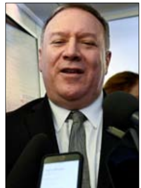
•• واشنطن - أف ب

يجري وزير الخارجية الأمريكي مايك بومبيو جولة على عدد من الدول الإفريقية في وقت تعزز الولايات المتحدة تخفيض عديد قواتها في إفريقيا بعد أن شددت شروط الحصول على تأشيرة دخول للأفارقة، وقد أشار الرئيس دونالد ترامب فضيحة بوصفه دول القارة السمراء بكلمة نابية. رغم ذلك، لدى بومبيو مهمة تقضي برسم صورة إيجابية لعلاقات التنسيق بين بلاده وإفريقيا، أثناء زيارته الأولى إلى إفريقيا جنوب الصحراء الكبرى منذ تولي مهامه من سنتين. وتبدأ جولة بومبيو اليوم السبت وتشمل السنغال وأنغولا وإثيوبيا. واختيرت هذه الدول لتمسك قادتها بالقيم