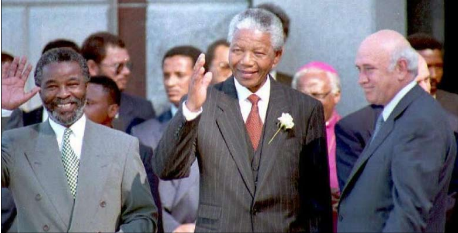
يحيط به ثابو مبيكي وفريدريك دي كليرك