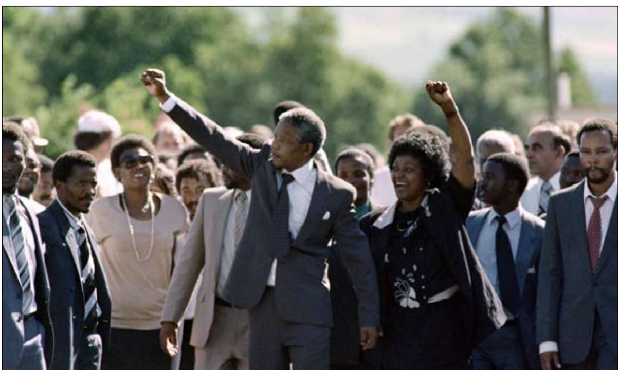
مانديلا... لا افراط ولا تفريط

أليست الطريقة الجديدة تعبيراً عن ممارسة أخرى للسياسة تترجم صعود اليمين المتطرف؟