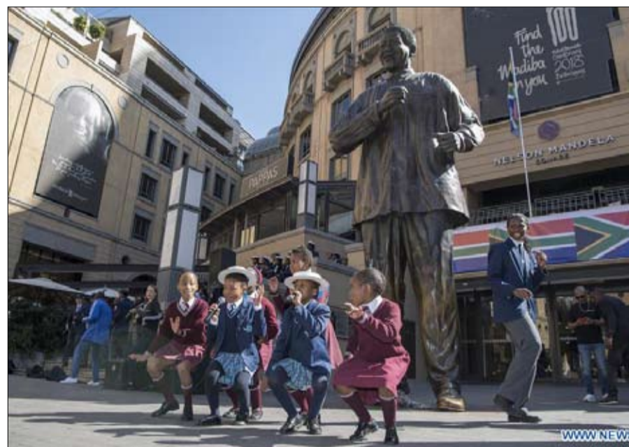
مانديلا... الوسائل تحدد الغايات