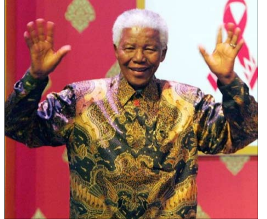
انجاز للقيم... فاتنصر