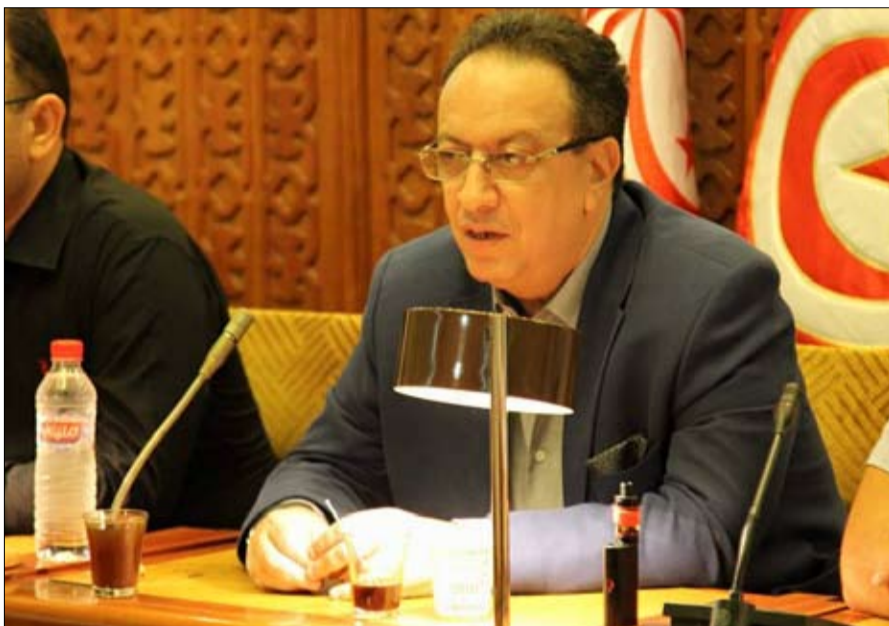
السبسي الابن خارج السباق