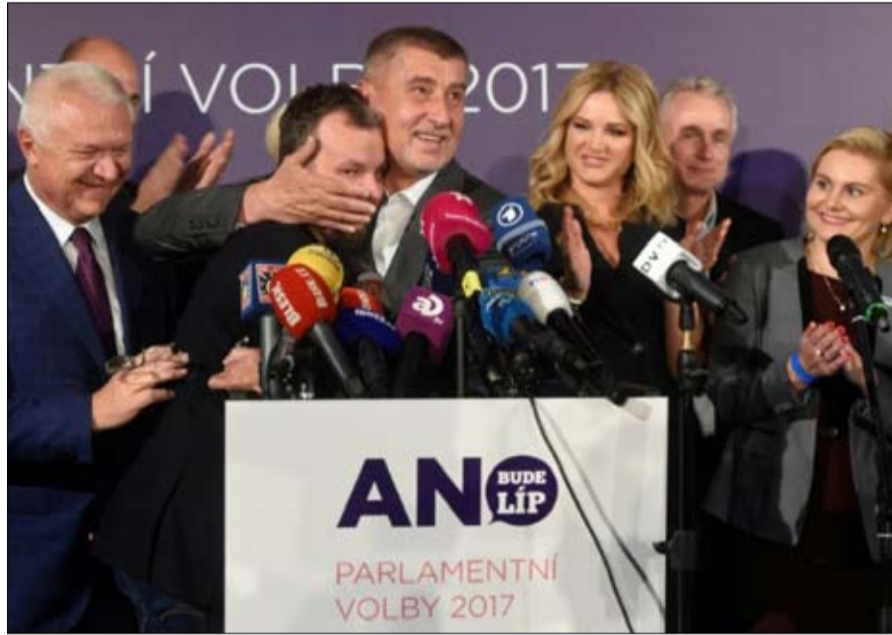
ترامب التشيكي الفائز الاكبر

ومن بين الأحزاب الأخرى التي حققت اختراقا، يشار إلى النتيجة الجيدة جدا لحزب القراصنة المناهض للنظام، وهو تشكيل مؤيد لأوروبا ويتبنى الديمقراطية المباشرة واستخدام الإنترنت لتعزيز الشفافية السياسية، والذي استقطب الكثير من الشباب، إلى جانب المسيحيين الديموقراطيين، ورؤساء البلديات والمستقلين، وأخيرا توب 09، تشكيل بقيادة مقرب سابق من فانتسلاف هافل، دخل أيضا مجلس النواب، متجاوزا بقليل عتبة 5 بالمائة. يبدو من الصعب معرفة ما الذي سيخرج من كل هذا مع وجود العديد من الأحزاب المناهضة للنظام، يمكن أن تدخل فترة طويلة من عدم الاستقرار، يتوقع اريك تابيري في مجلة ريبسكت.