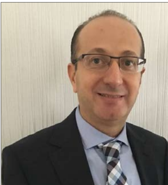
المرشح النهائي لنداء في ألمانيا