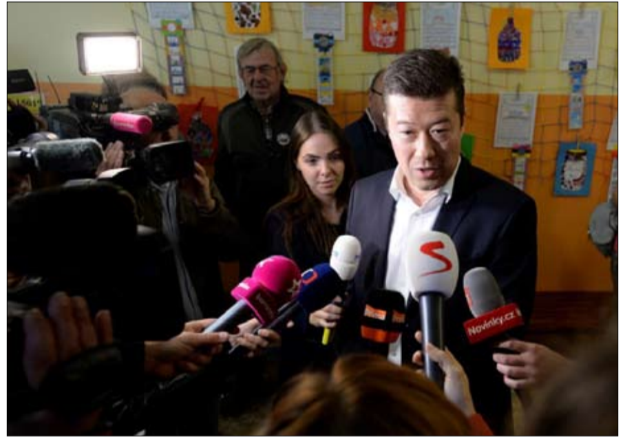
توميو اوكامورا مفاجأة اليمين المتطرف