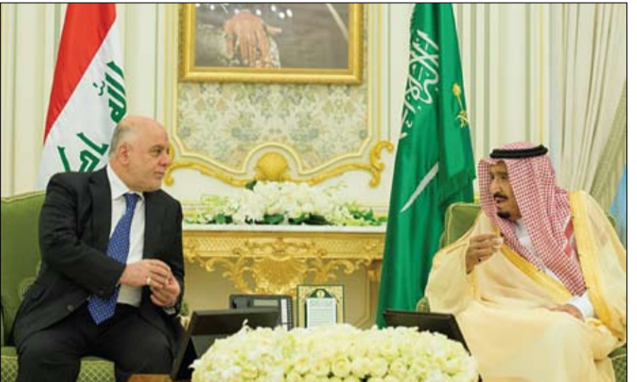
خادم الحرمين خلال اجتماعه مع رئيس الوزراء العراقي بالرياض

وقع مع العبادي مذكرة تأسيس المجلس التنسيقي العاهل السعودي: يربطنا مع العراق أواصر الدم والمصير الواحد •• الرياض-د ب أ: أكد العاهل السعودي الملك سلمان بن عبدالعزيز امس الأحد على دعم بلاده وتأييدها للوحدة العراقية واستقراره. وقال العاهل السعودي «ما يربطنا مع العراق ليس مجرد الجوار والصالح المشتركة إنما أواصر الأخوة والدم والتاريخ والمصير الواحد». وأضاف، مؤكدا دعمنا وتأييدنا لوحدة العراق واستقراره، والإمكانات الكبيرة المتاحة لبلدينا تضعا أمام فرصة تاريخية لبناء شراكة فاعلة لتحقيق تطلعاتنا المشتركة، مضيفا «نتطلع أن تسهم اجتماعات مجلس التنسيق في المضي إلى آفاق أوسع وأرحب». ووقع الملك سلمان ورئيس الوزراء العراقي حيدر العبادي امس على مذكرة تأسيس المجلس التنسيقي بين البلدين بحضور وزير الخارجية الأمريكي ريكس تيلرسون. وقال العاهل السعودي، في كلمة بثها التلفزيون الرسمي السعودي، «واجه في منطقتنا تحديات خطيرة تتمثل في التطرف والإرهاب ومحاولة زعزعة الأمن والاستقرار في بلداننا». وأضاف العاهل السعودي في كلمته «بارك لأشقائنا في العراق ما تحققت من إنجازات في القضاء على الإرهاب ودمره»، مؤكدا «دعمنا وتأييدنا لوحدة العراق واستقراره».