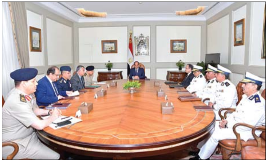
السياسي خلال اجتماعه مع القيادات العسكرية والأمنية لبحث خطوات مواجهة الارهاب

السياسي يتعهد بمواصلة الحرب على الإرهاب ومموليه •• القاهرة-وام: أكد الرئيس المصري عبد الفتاح السيسي أن الحرب على الإرهاب لها طبيعة خاصة تختلف عن الحروب النظامية. موضحا أن رجال القوات المسلحة والشرطة المصرية نجحوا خلال السنوات الماضية في تجنب مصر مسارات شهدتها دول تقضي فيها الإرهاب ونجحوا في استعادة الاستقرار والأمن ومحاصرة الجماعات الإرهابية والتصديق عليها.. مشددا على أن مصر ستواصل مواجهة الإرهاب ومن يموله ويقف وراءه بكل قوة وحسم. وجاء ذلك خلال اجتماع عقده صباح امس وضم عددا من المسؤولين منهم الفريق أول صدقي صبحي وزير الدفاع ومجدي عبد الغفار وزير الداخلية وخالد فوزي رئيس المخابرات العامة وعددا من قيادات ومسؤولي وزارتي الدفاع والداخلية. وقال السفير علاء يوسف المتحدث