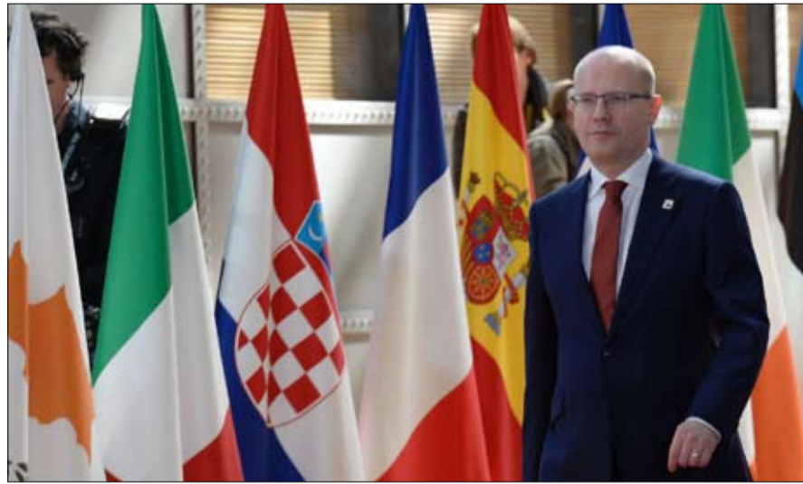
هزيمة تكراء للديمقراطيين الاشتراكيين

الشعبوية في حين ان البلاد في عافية من الناحية الاقتصادية، ومن نجاح شعارات اوكامورا بالقلق وقد صدمتهم نتيجة الانتخابات، وعسبروا عن استخراهم من قوة الموجة