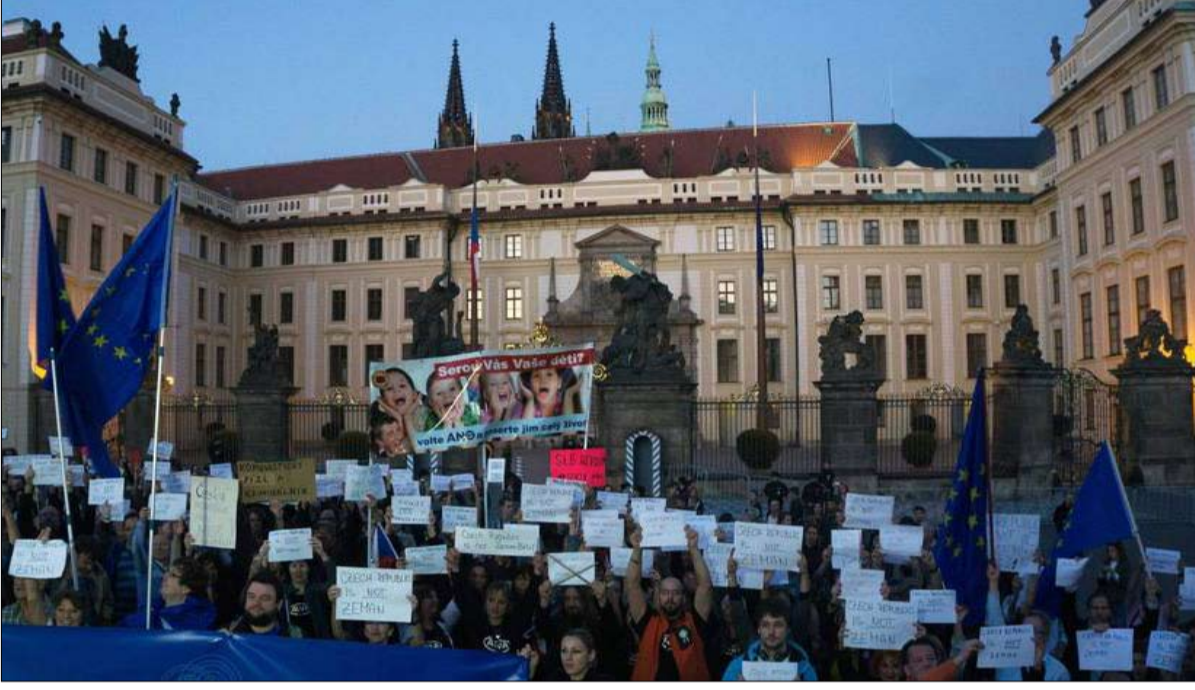
اليمن المتطرف يفوز تشيكيا