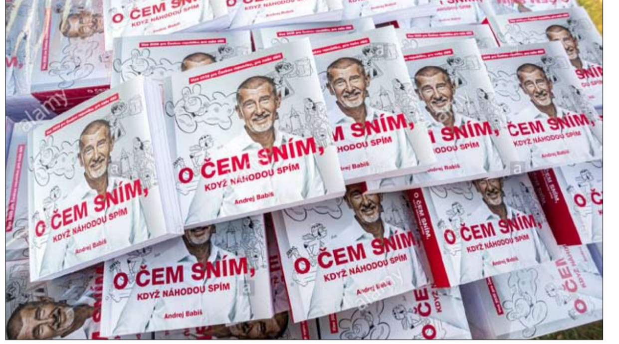
الخطاب الشعبي هو المنتصر في أوروبا