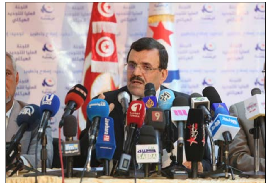
العريض: لا تغيير في موقف النهضة