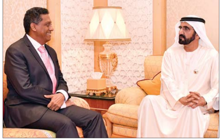
محمد بن راشد خلال استقباله رئيس سيشل