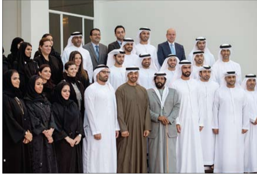
محمد بن زايد خلال استقباله وفد هيئة أبوظبي للسياحة والثقافة