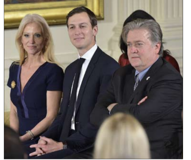
بانون وجاريد كوشنر، الخارجية لنا

لا مجال لعسكرة مكافحة الهجرة، وبين إسرائيل وفلسطين، تشجع الولايات المتحدة أكثر من أي وقت مضى حل الدولتين، التزامهم مع الناتو لا ثغرة فيه، وكذلك تحالفهم مع الاتحاد الأوروبي، من الخطأ الحديث عن الإرهاب الإسلامي المتطرف بحشر جميع البلدان الإسلامية، والصين لا تصطنع التلاعب بعمليتها. هل هذه سياسة باراك أوباما؟ لا، إنها سياسة وزراء دونالد ترامب.