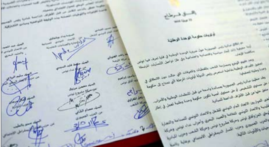
احترام اولويات وثيقة قرطاج مطلب الاتحاد