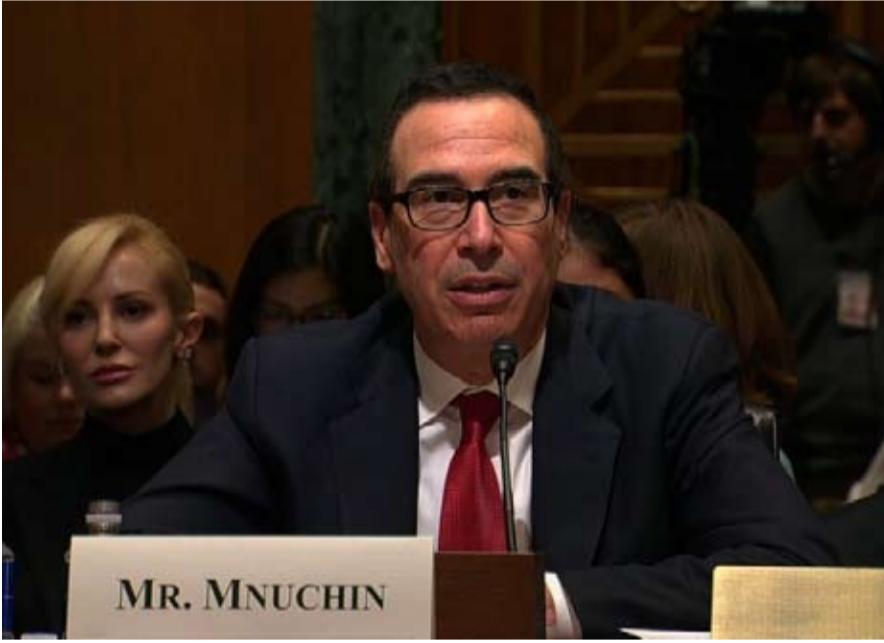
ستيف منوشين يغازل الصين