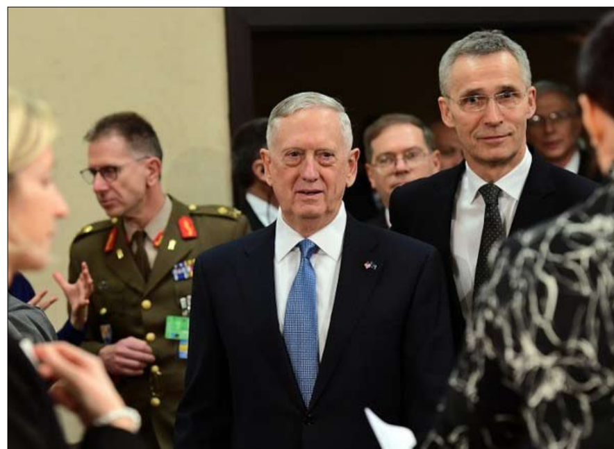
جيمس ماتيس يناقض رئيسه