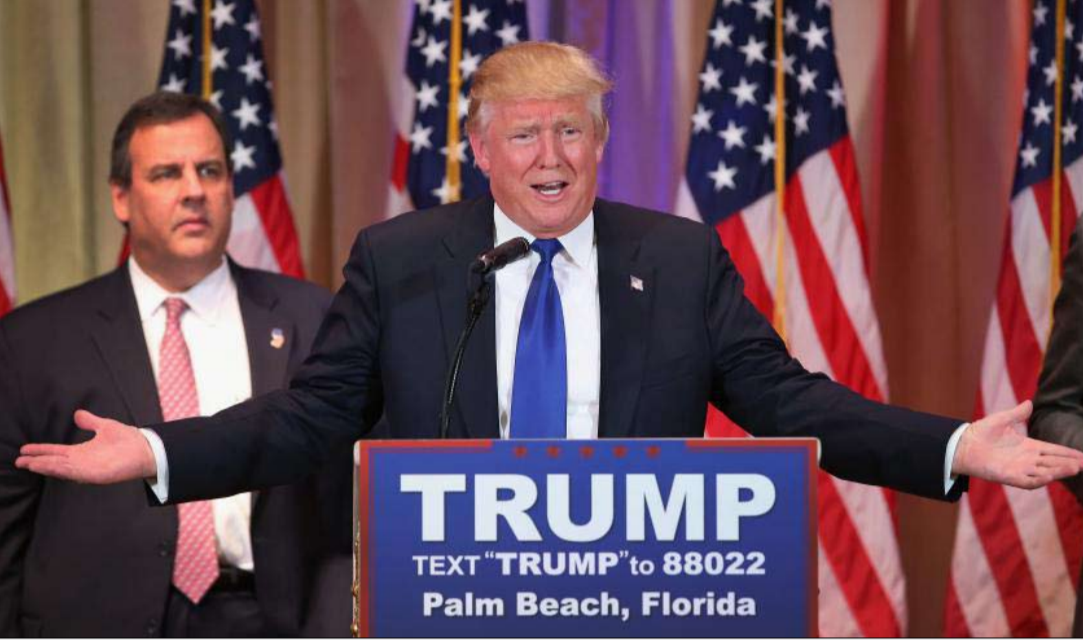
ترامب منفرد من عقاله

دمج الرئيس في سياسة خارجية أمريكية يمكن توقعها، وحكيمة (نوربرت روتجان، رئيس لجنة الشؤون الخارجية في البرلمان الألماني).