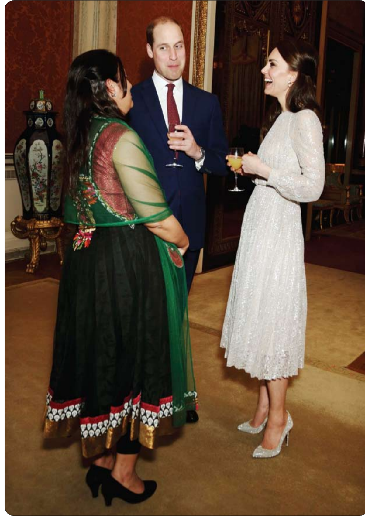
الأمير وليام وزوجته كاثرين دوقة كامبريدج خلال حضورهما حفل استقبال بمناسبة إطلاق الملكة المتحدة

اقتحم لص متجر ترفيهي في بريطانيا بعد إغلاق أبوابه خلال الليل وسرق دمية تاركا معظم الأشياء الثمينة ومنها الكمبيوتر وألة ناسخة تقدر قيمتها بأكثر من 10 الاف جنيه (12500 دولار). وقال آلان بروك صاحب المتجر في مدينة بوري شمال غرب بريطانيا إن اللص شاهد فيلماً جنسياً قبل سرقته الدمية ومغادرة المتجر، إذ أنه عشر على الفيلم وهو لا يزال في وضع التنشغيل.