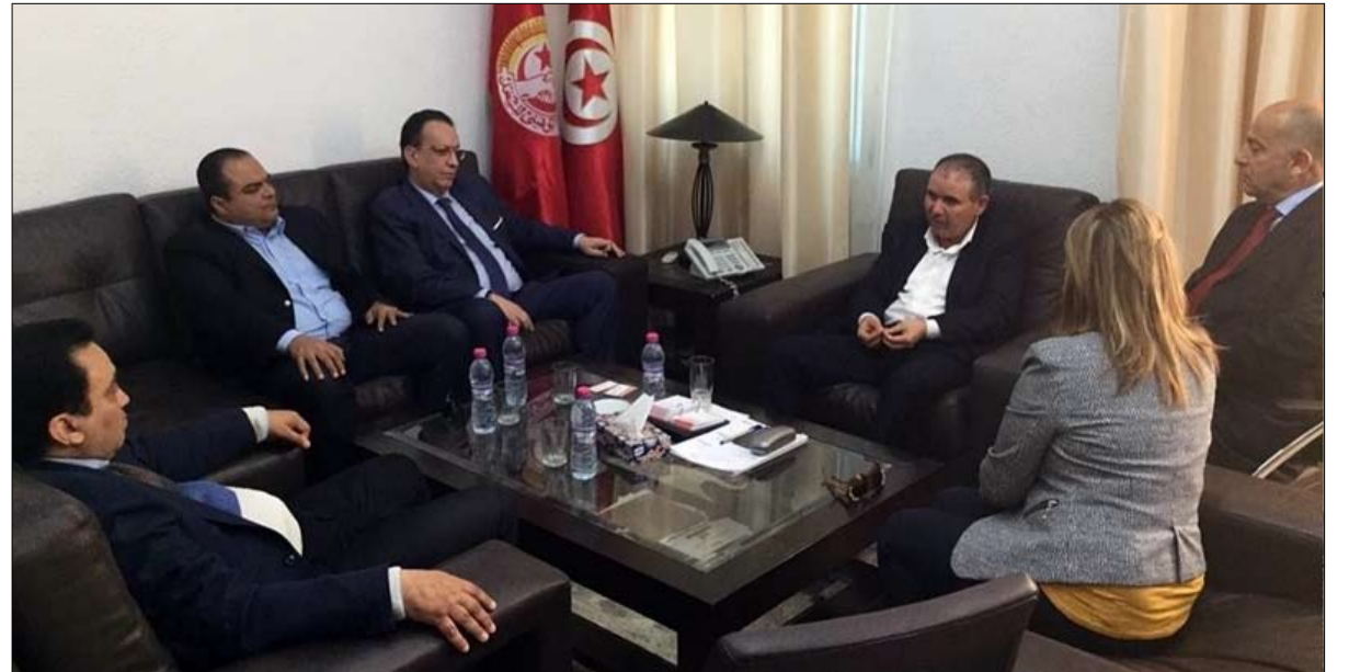
نداء تونس يدعو الى كلمة سواء