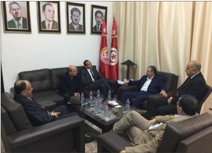
أفاق تونس عند الطوبوي

من منظمة أصحاب المؤسسات يعبر عن ارتباك في مستوى التوازنات الهشة وغير المدروسة التي انبثقت عنها ما يسمى بحكومة الوحدة الوطنية. وشددت الهيئة التسييرية في بيان لها، على أن ما يثار من إشغال حول تواتر اعتبارات المحابة والقرب العائلي والتصاهر في تعيين المسؤولين بالحزب والدولة سيزداد تأكدا بعد التسميات الأخيرة.