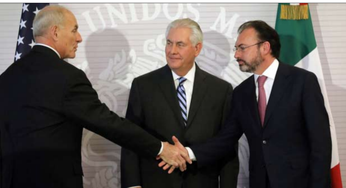
ريكس تيلرسون وجون كيلي حرج في مكسيكو