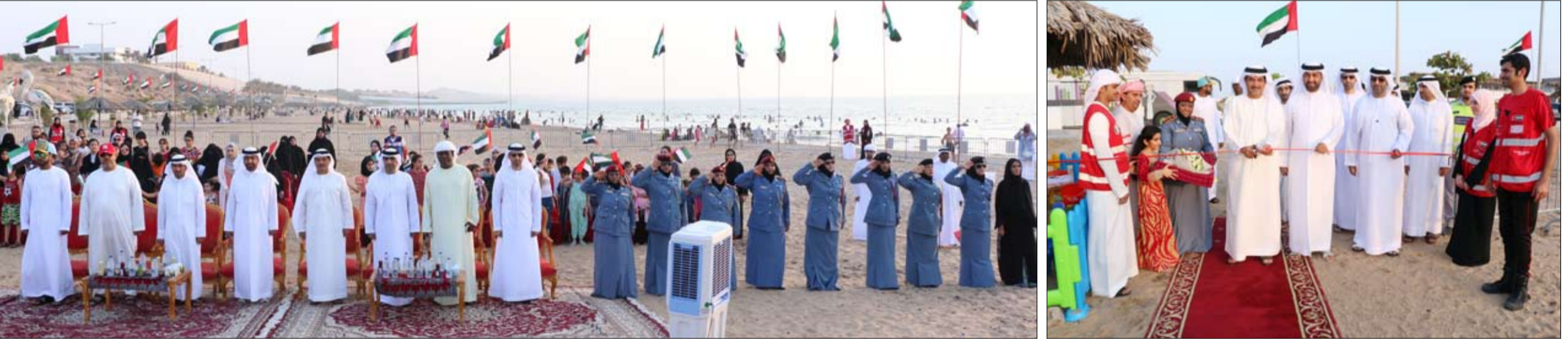
45 ألف مستفيد

وأشار المركز إلى أن المناطق التي يمكنها رؤية هذا الكسوف كسوف كلي هي أجزاء واسعة من الولايات المتحدة بحيث يمكن رؤية الكسوف الكلي من جميع المناطق الواقعة ضمن شريط يبلغ عرضه حوالي 110 كيلومترات يقطع الولايات المتحدة بشكل كامل من غربها إلى شرقها ويشمل 14 ولاية ومن ثم يتحرك شرقاً ليقطع جميع المناطق ويستبلغ أطول مدة للكسوف الكلي في هذا الكسوف دقيقتين و 42 ثانية وذلك من بالقرب من مدينة كاروبندال في ولاية إلينوي. من جهة أخرى سيشاهد هذا الكسوف ككسوف جزئي من باقي مناطق الولايات المتحدة ومن أمريكا الوسطى وشمال أمريكا الجنوبية وكندا في حين أن الكسوف الجزئي سيشاهد أثناء الغروب من بعض الدول الواقعة في غرب أوروبا مثل بريطانيا والنرويج وهولندا وبلجيكا وفرنسا وإسبانيا والبرتغال. أما من الدول العربية فيسكون الكسوف مشاهدا ككسوف جزئي فقط وينسبة بسيطة من وسط وغرب المملكة الغربية وموريتانيا وأجزاء بسيطة جدا من غرب الجزائر. وبالنسبة لمواعيد الكسوف العامة سيبدأ الكسوف في أول منطقة على الأرض الساعة 15:47 بتوقيت غرينتش وسيبدأ الكسوف الكلي على