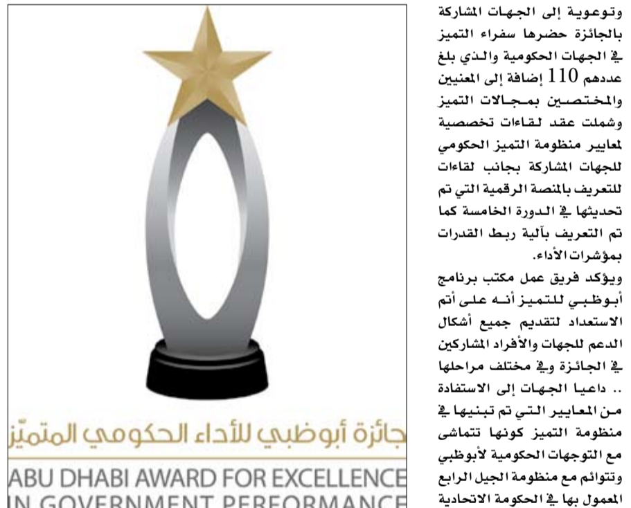
جائزة أبوظبي للأداء الحكومي المتميز ABU DHABI AWARD FOR EXCELLENCE IN GOVERNMENT PERFORMANCE

وأضافت الأمانة العامة أن تدليل التحديات كافة أمام الموظفين لتعزيز القدرات الإنتاجية وتحفيز المبادرات الفردية يسهم في تحسين الخدمات والإجراءات الحكومية وتسهيلا انسجاما مع أهداف «خطة أبوظبي». وشهدت مشاركات فئة وسام رئيس المجلس التنفيذي ارتفاعا بنسبة 27.2% مقارنة بالدورة الماضية من الجائزة حيث سلمت الجهات المشاركة في ذات الفئة من الدورة الرابعة 419 مشاركة ما يعكس زيادة عدد أفضل الممارسات والتنافس الكبير في سياق التميز بين مختلف الجهات. وأكدت الأمانة العامة للمجلس التنفيذي أن جوائز أفضل خدمة حكومية والتي تم تسليم 53 مشاركة بها تعكس إيمان الجهات