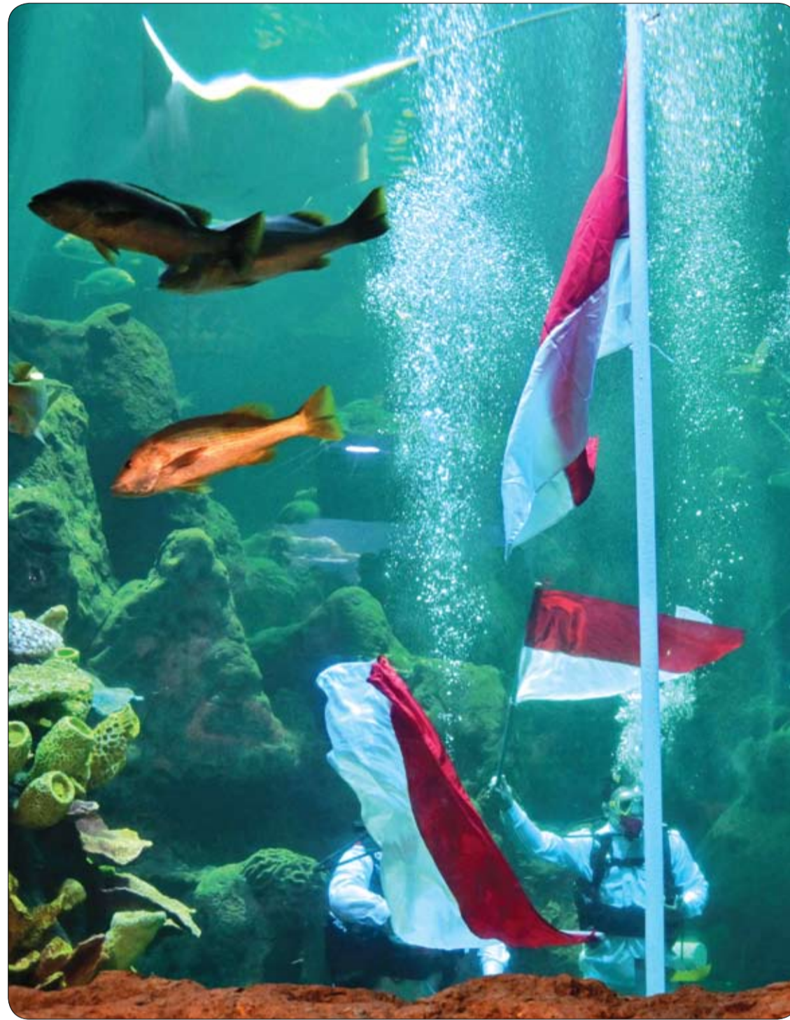
غواصون يلوحون بالأعلام الوطنية خلال حفل تحت الماء في متنزه سيورلد أنكول الترفيهي للاحتفال بالذكرى الـ 75 لاستقلال إندونيسيا في جاكرتا.

أعراض النوبة القلبية الأكثر شيوعاً تتضمن أعراض النوبة القلبية الأكثر شيوعاً، الآتي: - ضيق أو ألم أو إحساس ضاغط أو مؤلم في الصدر أو الذراعين، قد ينتشر إلى الرقبة أو الفك أو الظهر. - الغثيان أو عسر الهضم أو حرقة في فم المعدة أو ألم في البطن. - ضيق في التنفس. - عرق بارد. - الإرهاق وعدم القدرة على القيام بمجهود. - دوام أو دوخة مفاجئة. نصيحة: عند الشعور بأحد الأعراض الآتية الذكر، أو مشاهدة أحد أفراد العائلة وهو يعاني منها، نقل المصاب إلى أقرب مركز للطوارئ لإنقاذه من النوبة القلبية بالسرعة القصوى، قبل أن تقضي على حياته.