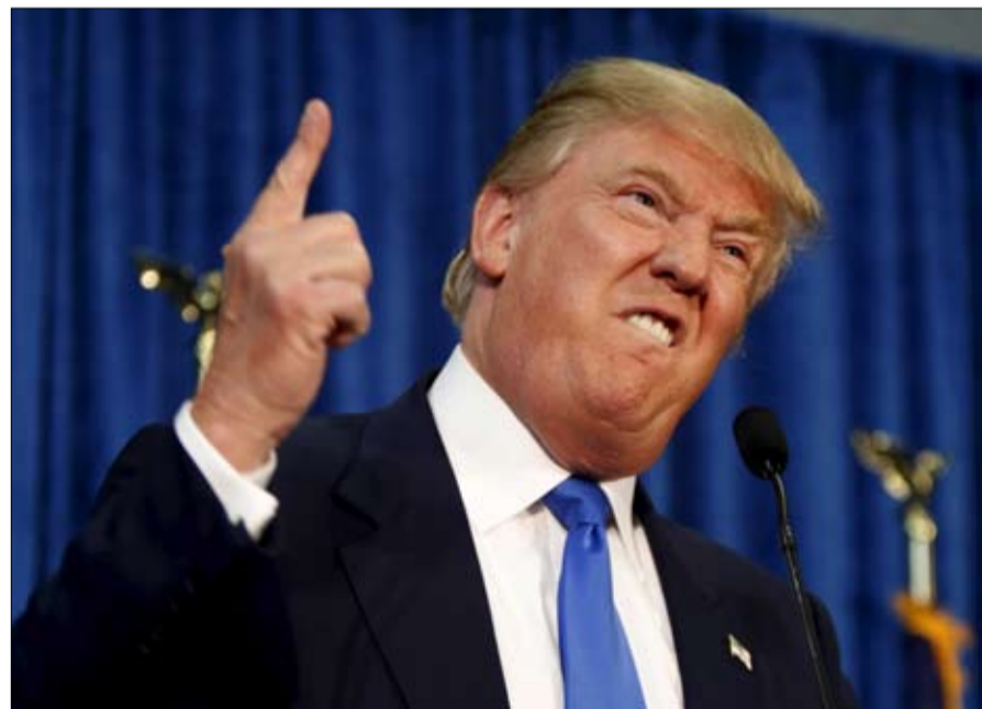
ترامب في الجنون فنون ومكاسب

التحدث بحرية عن الصحة العقلية للسياسيين. من جانبه، لا يُخفي الطبيب النفسي آين فرانسيس، الذي قاد الطبعة الرابعة من الدليل التشخيصي والإحصائي للاضطرابات العقلية، لا يُخفي انزعاجه عندما يرى العديد من المشخصين الهواة يثيرون اضطرابات الشخصية الترجسية. وكتب في صحيفة نيويورك تايمز "أنا من حزر المايبر التي تحدد هذا الاضطراب، والسيد ترامب لا يطابق ذلك. ربما يكون نرجسي على مستوى عالمي، ولكن ذلك لا يجعله منه مريضاً عقليا لأنه لا