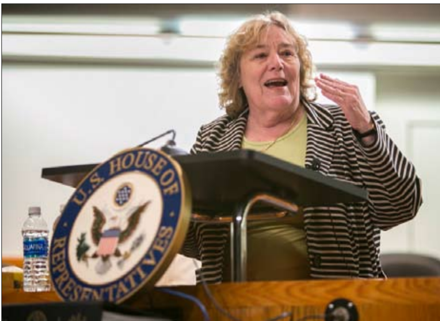
زو لوففرين... اخضع ترامب للفحص الطبي

الجمعية الأمريكية للتجليل النفسي تسمح لمختوريها بحرية الكلام عن الصحة العقلية للسياسيين