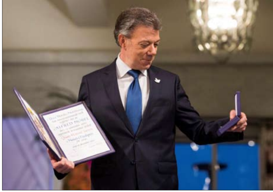
الرئيس الكولومبي انثار الجدل أيضا

حاميا بشكل خاص وأكثر اتساعا حول هذه المسألة. فقد مُنح باراك أوباما جائزة نوبل للسلام لجهوده غير العادية في تعزيز الدبلوماسية الدولية والتعاون بين الشعوب، بعد عام فقط من وصوله إلى البيت الأبيض.