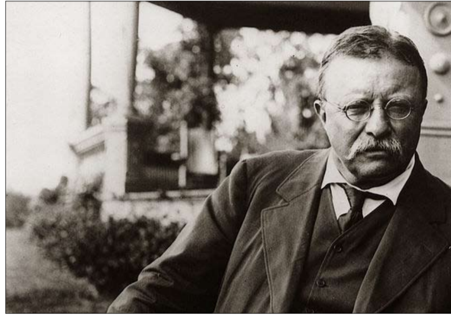
ثيودور روزفلت مكافأة العصا الغليظة

كما أتهم هنري كيسنجر بالقيام بدور في قصف السكان المدنيين في لاوس وكامبوديا. وقالت الصحيفة الإيطالية لا ستامبا