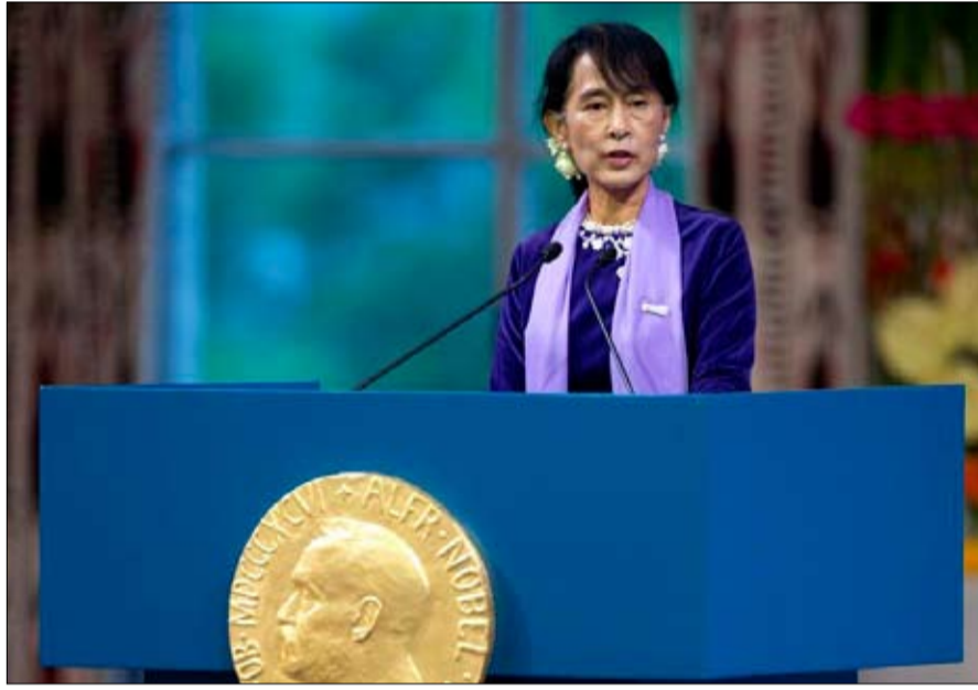
سو كي من نوبل للسلام الى التتهير العرقي