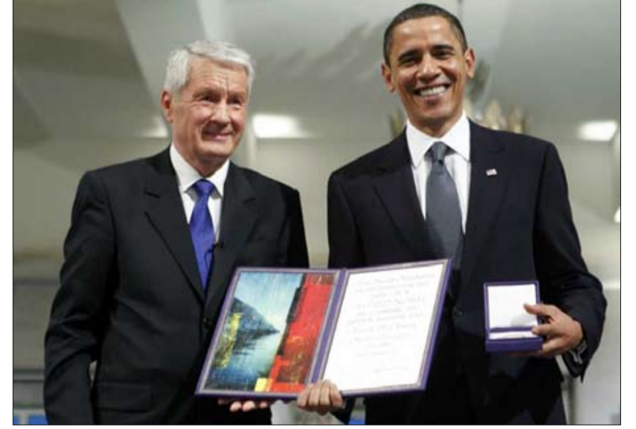
اوباما جائزة نوبل قبل الاوان

كان ذلك قبل 26 عاما. حصلت أونغ سان سوكي، المعارضة للمجلس العسكري البورمي، على جائزة نوبل للسلام المرموقة عام 1991 نظرا لنضالها من أجل الديمقراطية وحقوق الانسان. جائزة لم تتسلمها إلا عام 2012، بعد سنوات من الإقامة الجبرية حالت دونها والذهاب إلى أوصلو. محّل إعجاب طيلة فترة طويلة لمقاومتها، تتعرض أونغ سان سوكي اليوم إلى عاصفة نقد وادانة. ويُعبأ على هذه الايقونة السابقة، التي تقود الحكومة البورمية منذ أبريل 2016، صمتها بشأن مصير الروهينجا، الأقلية المسلمة ضحية الاضطهاد في بورما..