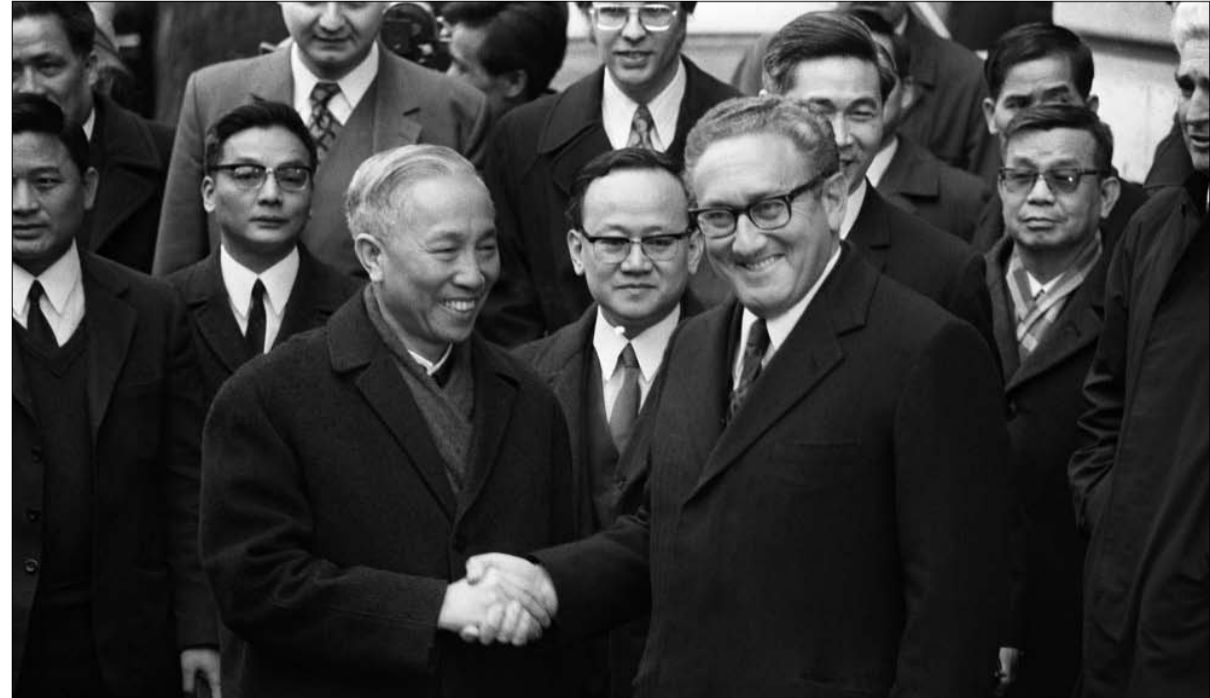
كيسنجر عراب الحروب ناها أيضا