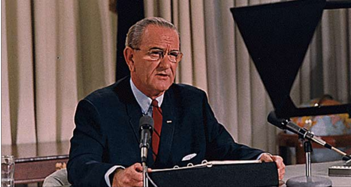
ليندون جونسون عانى من الاضطراب ثنائي القطب