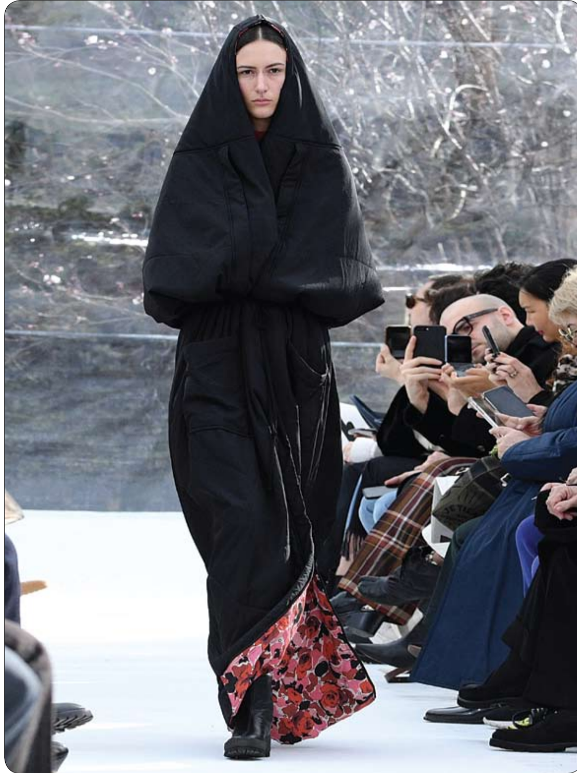
عارضة الأزياء كنزو خلال عرض لمجموعة أزياء جاهزة للسيدات لخريف وشتاء 2020-2021 في باريس