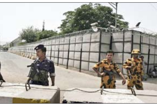
الحوثيون يحاصرون منزل شريكهم في الانقلاب صالح بصنعاء

اليميني السابق علي عبدالله صالح من مقر إقامته في صنعاء، ونقله إلى محافظة صعدة. وأكد مصدر يمني صدور قرار الميليشيات بإنهاء التحالف مع حزب المؤتمر الشعبي العام برئاسة صالح. فيما أكد قيادي بارز في ميليشيا الحوثي، أن الرئيس المخلوع علي عبدالله صالح، كان يحضر لانقلاب عليهم في العاصمة صنعاء، عشية احتفال حزبه بالذكرى الـ 35 لتأسيسه، في 24 أغسطس الماضي. وذكر عضو المكتب السياسي لجماعة الحوثي، محمد البيهني، أن الفعالية كان هدفها "النزول للساحات بهدف القيام باعتمادات احتجاجية وهذا ما كان مخططاً له بالفعل لولا اتخاذنا للإجراءات الأمنية المناسبة لإفصالها. وكشفت في رسالة تحريض مطولة وجهها لأنصار صالح لحثهم على الانقلاب عليه، عن أن صالح أصبح في متناول اليد، لكن الجماعة (الحوثيين) لا تريد أن تنتهي تواجد، حسب قوله.