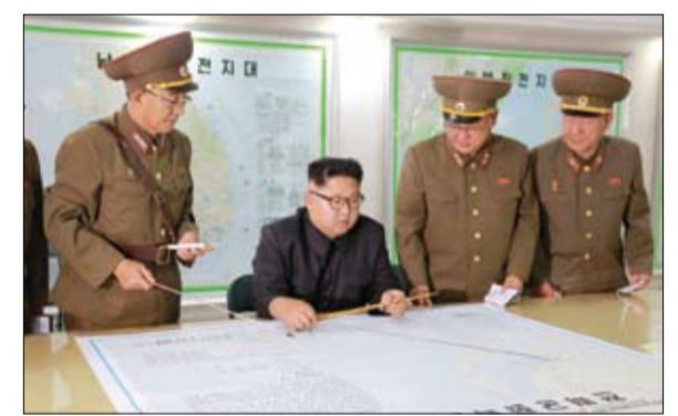
كيم جونج يطلع على الخطة العسكرية خلال زيارته لمقر قيادة القوة الاستراتيجية

•• سيول-رويترز: نشرت وكالة الأنباء المركزية الكورية، وهي الوكالة الرسمية لكوريا الشمالية، أمس الثلاثاء، سلسلة صور لزعيم البلاد كيم جونج أون أثناء زيارته لمقر قيادة القوة الاستراتيجية لجيش الشعب الكوري. ونشرت الصور مصحوبة بتقرير ذكر أن كيم أجرا قرار إطلاق صواريخ تجاه جزيرة «غوام» الأميركية وأنه سيتابع أفعال الإدارة الأميركية لبعض الوقت. وأظهرت اللقطات كيم وهو يمسك بعضا ويشير إلى خريطة تظهر مساراً جويًا لصواريخ تخرج من الساحل الشرقي لكوريا الشمالية وتحلق فوق اليابان باتجاه «غوام». (التفاصيل ص 13)