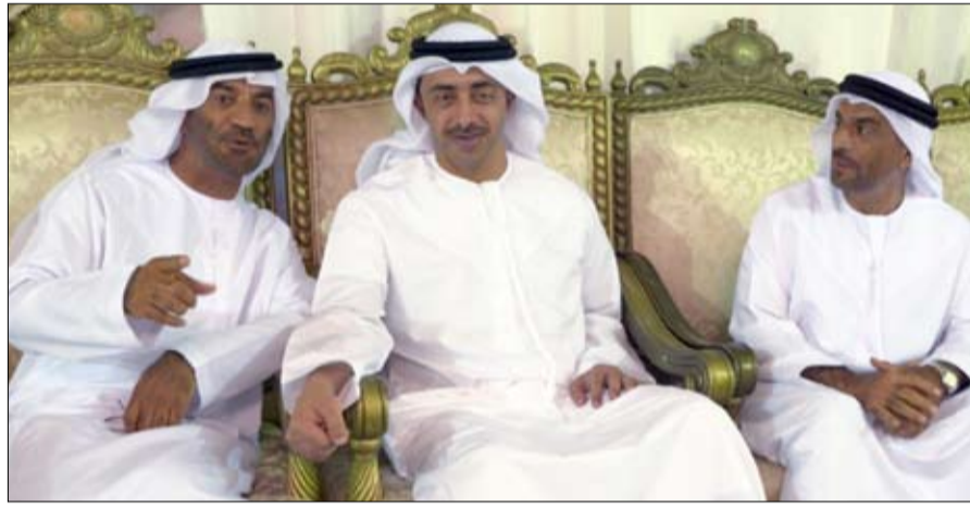
•• العين - وام: قدم سمو الشيخ عبدالله بن زايد آل نهيان وزير الخارجية والتعاون الدولي مساء أمس واجب العزاء إلى أسرة الشهيد أحمد خليفة البلوشي أحد أبناء القوات المسلحة البواسل الذي استشهد خلال عملية إعادة الأمل ضمن قوات التحالف العربي الذي تقوده المملكة العربية السعودية للوقوف مع الشرعية في اليمن. وأعرب سموه خلال زيارته مجلس العزاء في منطقة الطوية بمدينة العين عن خالص تعازيه