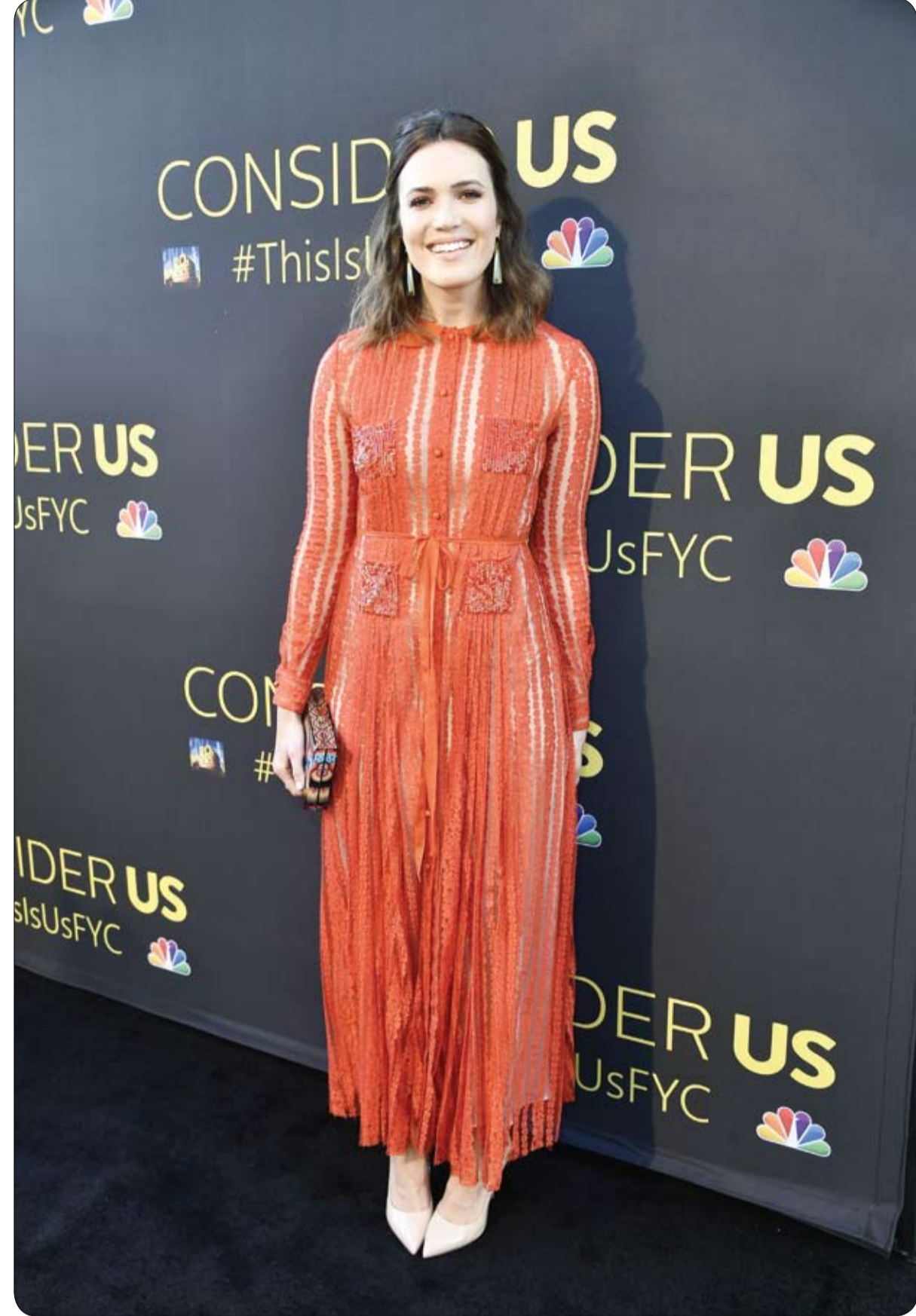
ماندي مور خلال حضورها عرض "This Is Us" في هوليوود، كاليفورنيا.

وعلى الفور أيقظ الرجل زوجته وغادرا المنزل برهقة القطة قبيل وصول رجال الإطفاء الذين أخمدوا الحريق خلال وقت قصير.