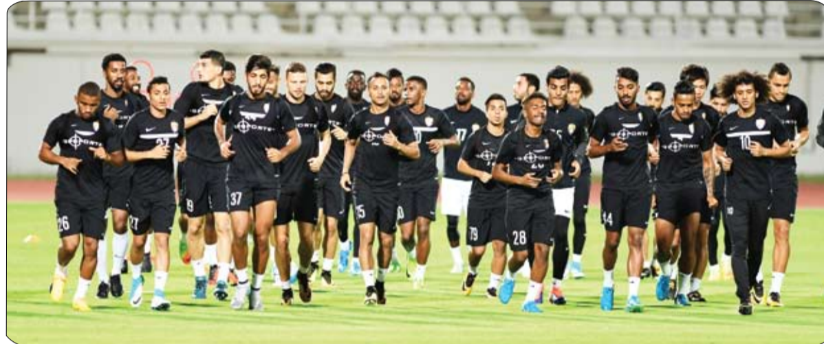
ورداً على سؤال حول مدينة العين، رائعة، هادئة وجميلة وشخصياً سعيد جداً بالعيش فيها والمؤكد فال: الحقيقة إن مدينة العين

أن درجة الحرارة هنا مرتفعة ولكنني أميل إلى الطقس الحار وشعوري إيجابي وانطباعي جيد لأن كل شيء في النادي مميز من ملاعب ومنشآت وامكانيات وقبل ذلك الإدارة والمدرّب ولللاعبين ورغبة الجميع قوية في تحقيق الأهداف المرجوة في الموسم الكروي الحالي على الصعيدين المحلي والقاري. وأكمل: اختتمنا قبل أيام قليلة مرحلة الإعداد الخارجي بصورة ممتازة والكل عمل في التمسك بالجدية المطلوبة وضاعفا من جهودنا لأجل الخروج من تلك المرحلة المهمة بالمكاسب المرجوة وشرك جيداً بأن الفريق بلغ درجة رائعة من الجاهزية التي ستمكنه من تحقيق أفضل النتائج خلال الموسم الكروي الجديد.