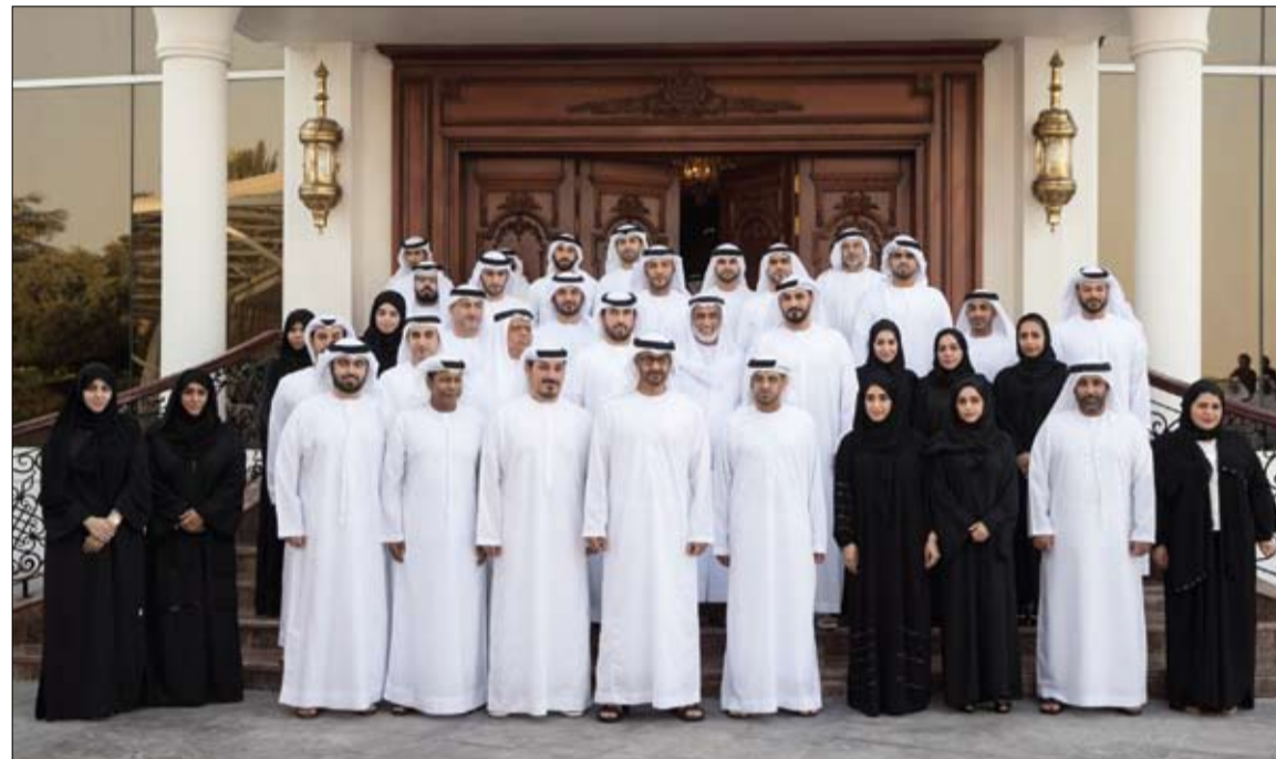
محمد بن زايد خلال استقباله وفد المؤسسة العليا للمناطق الاقتصادية المتخصصة