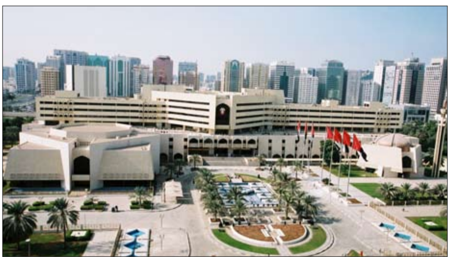
المشروع ب 650 مليون درهم، ويستهدف تحويل كورنيش الجدير بالذكر أن التصور الأولي للمشروع يشير إلى أنه سيتم تنفيذ على مساحة أرض تبلغ 160 ألف متر مربع، ويضم مساحات طابعية تقدر بنحو 74 ألف متر مربع، وتقدر كلفة

المستقبلية المقترحة في أبوظبي والرؤية الاستراتيجية لما يمكن تصحيحاً لما قامت به مؤخراً بعض وسائل الإعلام بنشرها خبراً حول قيام بلدية مدينة أبوظبي بتنفيذ مشروع لإنشاء تلفريك في المقطع وكورنيش الباهية، تؤكد دائرة الشؤون البلدية والنقل - بلدية مدينة أبوظبي أن المشروع المذكور ما يزال قيد الدراسة ولم يتم طرحه بشكل رسمي أمام القائلين. وأشارت دائرة الشؤون البلدية والنقل بهذا الصدد إلى أن مشروع التلفريك في المقطع والباهية قد تم عرضه طابعية تقدر بنحو المشاريع والفرص الاستثمارية