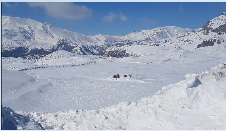
بحيرة باتابات متجمدة وتبدو وسطها الجزيرة المتحركة