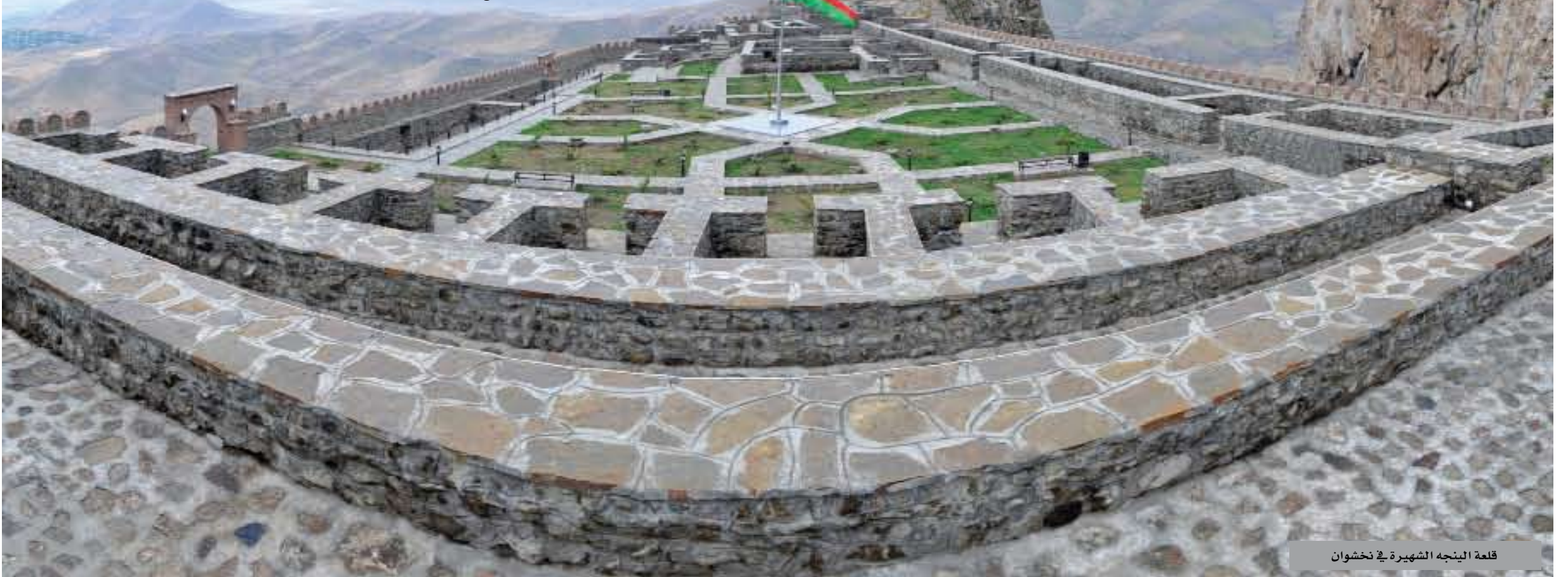
قلعة الينجه الشهيرة في نخشوان

منتجع أغبلاق (العين البيضاء) هو منتجع رائع يأتي