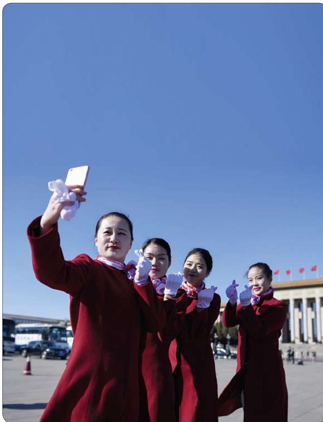
مجموعة من المضيفات تستخدم الهاتف المحمول لالتقاط صورة سيلفي أثناء الجلسة العامة الثالثة للمؤتمر الشعبي الوطني خارج قاعة الشعب الكبرى في بكين. (أ ب)