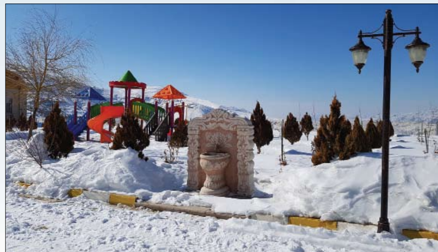
ألعاب للأطفال في المنتجع

اهتمامهم باستمرار بتطويره وفقا لرغبات الضيوف، بهم الآن يخططون لإعداد المكان لاستقبال الراغبين في ممارسة رياضة التزلج على الجليد.