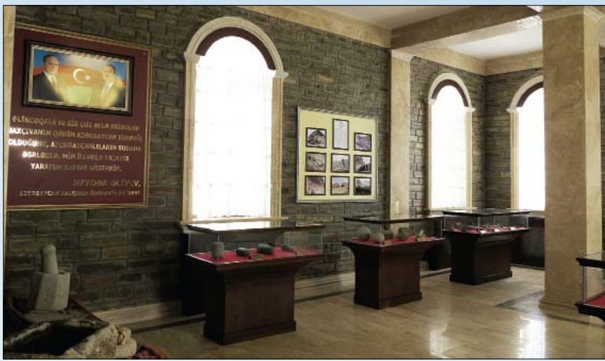
متحف قلعة الينجه