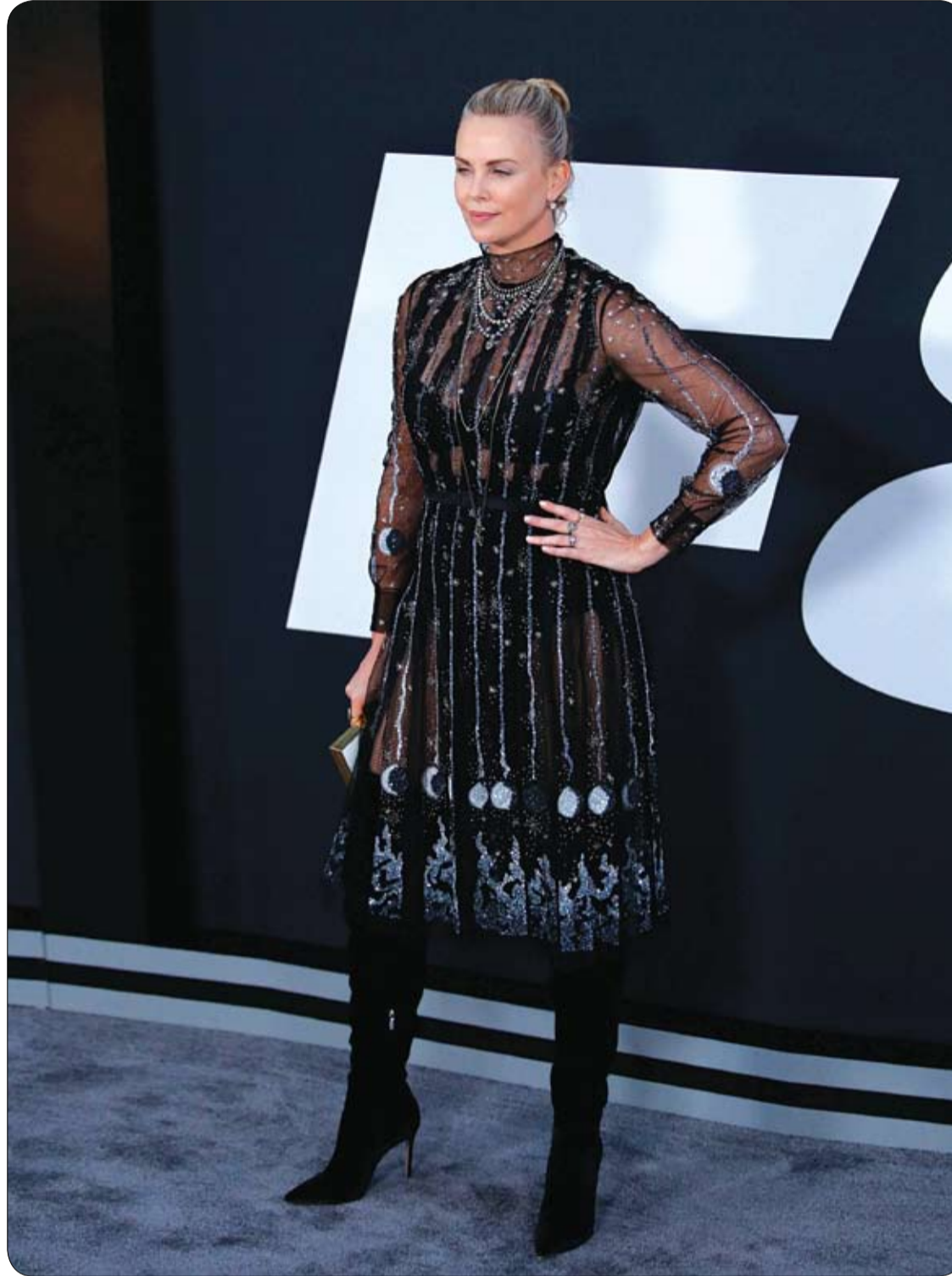
الممثلة تشارليز ثيرون خلال حضورها العرض الأول لفيلم "مصير الغضب" في نيويورك.

بدأت الأسواق البريطانية، تداول عقار جديد من الشوكولاتة تحت اسم BloodFlow عبارة عن كبسولة تحتوي على عناصر الكاكاو المضادة للأكسدة تقي من الإصابة بأمراض القلب والجطات الدماغية والخرف، وتعد أول أقراص مصممة بالكامل من الشوكولاتة في المملكة المتحدة تستهدف من يعانون مشكلات في القلب. وأشار باحثون بالدواء الجديد، موضحين أنه أول منتج يحتوي على مركبات "الفلافونول" المركزة المستخرجة من الكاكاو وله تأثير جيد على الصحة، مؤكداً أن الحفاظ على مرونة الأوعية الدموية أمر مهم، لافتين إلى أن ارتفاع ضغط الدم في منتصف العمر مرتبط بزيادة خطر الإصابة بأمراض القلب والجطات والخرف في مرحلة متقدمة، بحسب صحيفة "ديلي ميل" البريطانية. وتساعد مركبات (الفلافونول) المستخرجة من الكاكاو يمكن في علاج مستويات الكوليسترول وتدفق الدم، غير أن الحصول على جرعة كافية منها يحتاج إلى استهلاك 400 جرام من الشوكولاتة الداكنة وبالتالي أكثر من ألفي سعر حراري، حيث تشير الدراسات إلى أن الفلافونول يساعد على إنتاج أكسيد النيتريك والذي يعمل بدوره على ارتخاء عضلات جدران الشرايين ويحسن تدفق الدم بالجسم.