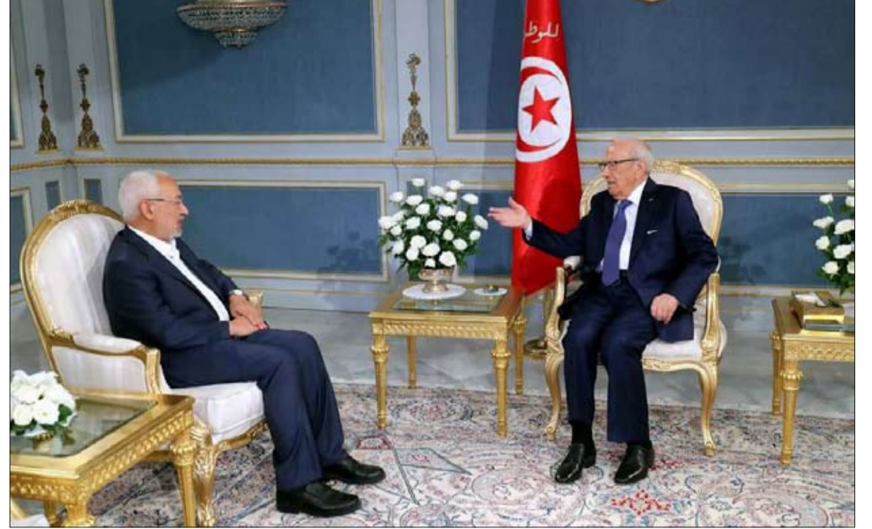
السبسي النهضة على طريق الوسطية