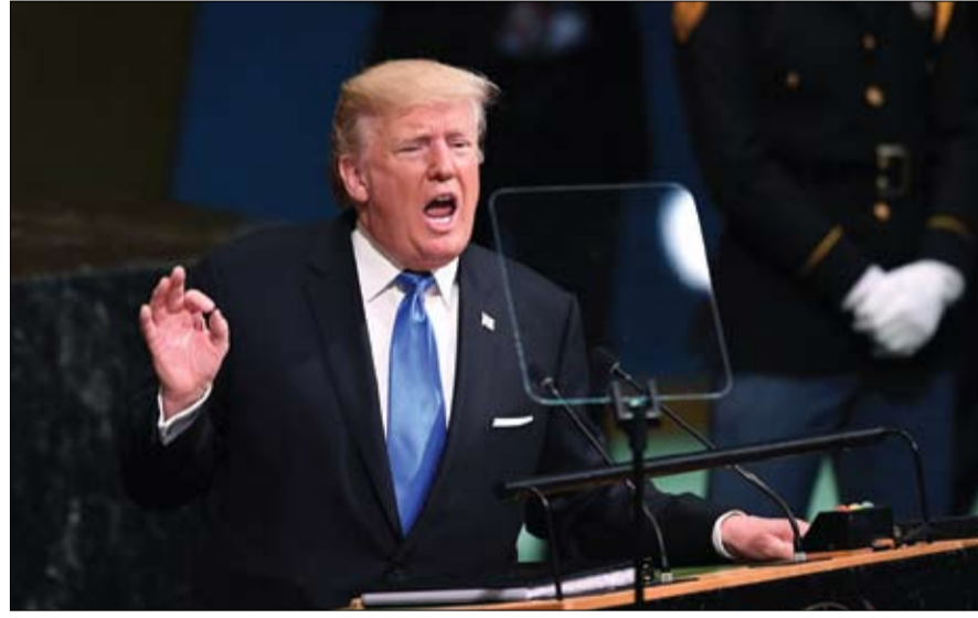
ترمب في أول خطاب له أمام الجمعية العامة للأمم المتحدة

محرج لنا، وأضاف ترمب: لن نقبل الاتفاق مع إيران إذا استخدم كغطاء لتطوير برنامج نووي، مشدداً على أن إيران عززت ديكتاتورية الأسد وقادت الحرب في اليمن. وشدد على أن واشنطن تسعى لعدم تصعيد الحرب في سوريا والتوصل لحل يلي مطالب الشعب. وقال الرئيس الأميركي إن ثروات إيران يتم استخدامها في تمويل حزب الله وتقويض السلام في الشرق الأوسط، مؤكداً أن على حكومة إيران وقف دعم الإرهاب والبدء في الاهتمام بشعبها. وأضاف الرئيس الأميركي أن دعم النظام الإيراني للإرهاب يتناقض مع جهود الدول العربية في محاربهته. وقال الرئيس الأميركي: علينا أن نحرم الإرهابيين من أي ملاذ أو دعم.. وعلينا التصدي للميليشيات التي تقتل الأبرياء مثل القاعدة وحزب الله. وأضاف: علينا حرمان الإرهابيين من أي ملاذ أو تمويل أو ممر آمن، مشيراً إلى أنه قد آن الأوان لمواجهة الدول التي تدعم الجماعات الإرهابية.