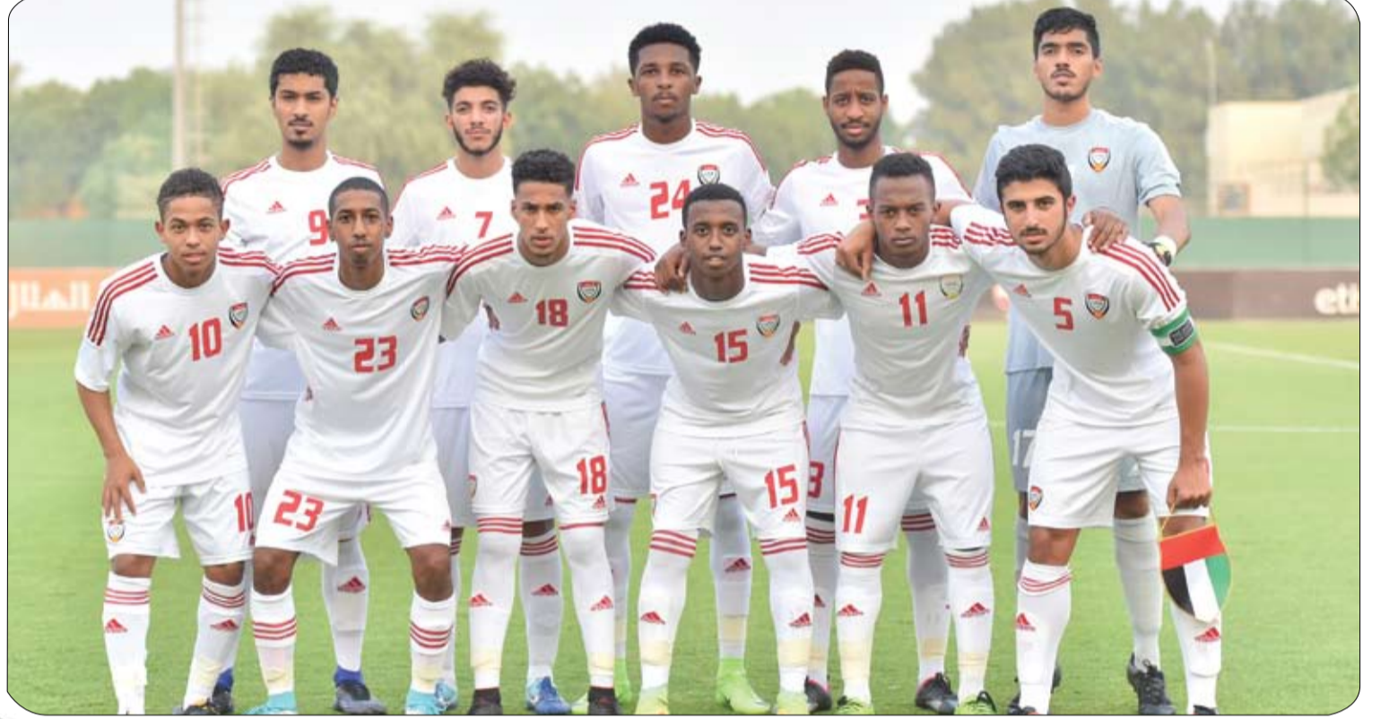
يلاقي غانا ومالي وغينيا وديا

سيغيب مانويل نوير حارس مرمى وقائد منتخب ألمانيا لكرة القدم ونادي بايرن ميونخ عن الملاعب حتى كانون الثاني يناير المقبل، بعد خضوعه لجراحة اخرى امس اثر تعرضه لكسر جديد في مشط قدمه اليسرى. وكان الحراس البالغ 31 عاما قد عاد إلى الملاعب في نهاية اب اغسطس الماضي، بعد كسر في القدم نفضها في نيسان ابريل الماضي خلال ربع نهائي دوري ابطال أوروبا ضد ريال مدريد الإسباني. وقال الرئيس التنفيذي لبايرن كارل-هاينتس رومينغه كانت الجراحة مثالية، وسيعود