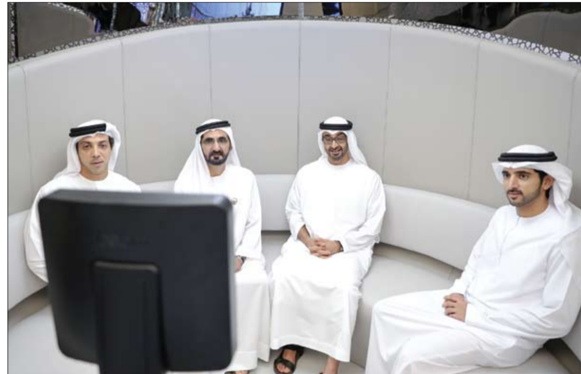
محمد بن راشد ومحمد بن زايد خلال زيارتهما مقر السرعات الحكومية بالإضافة إلى المركز النموذجي للخدمات الحكومية (وام)

جاء ذلك خلال حضور سموه إطلاق دليل التوازن بين الجنسين .. مجلس الإمارات للتوازن بين الجنسين، كأول دليل من نوعه على خطوات عملية للمؤسسات في الإمارات العربية المتحدة، الذي أطلقه مستوى العالم.