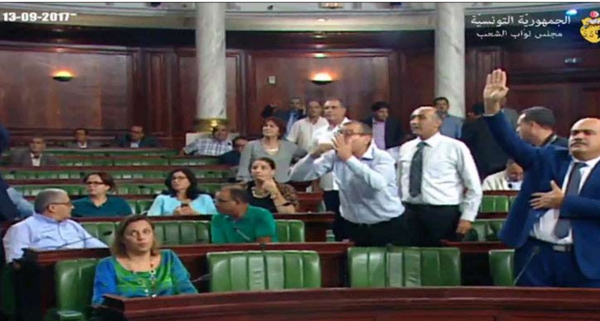
فوضى النواب عمل تخريبي