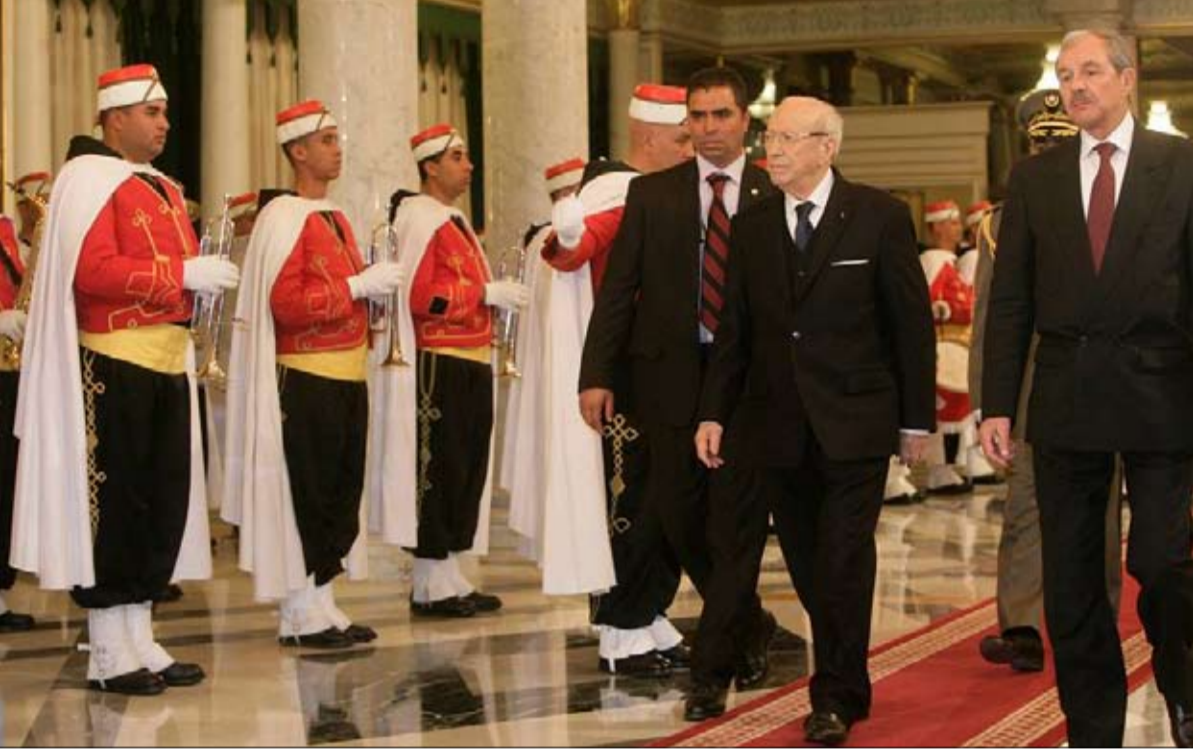
السبسي لن يغير الدستور