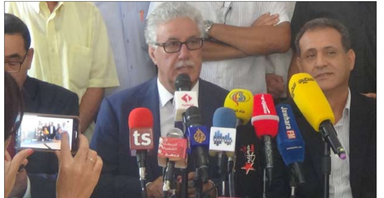
الجبهة الشعبية في مرمي نيران السبسي