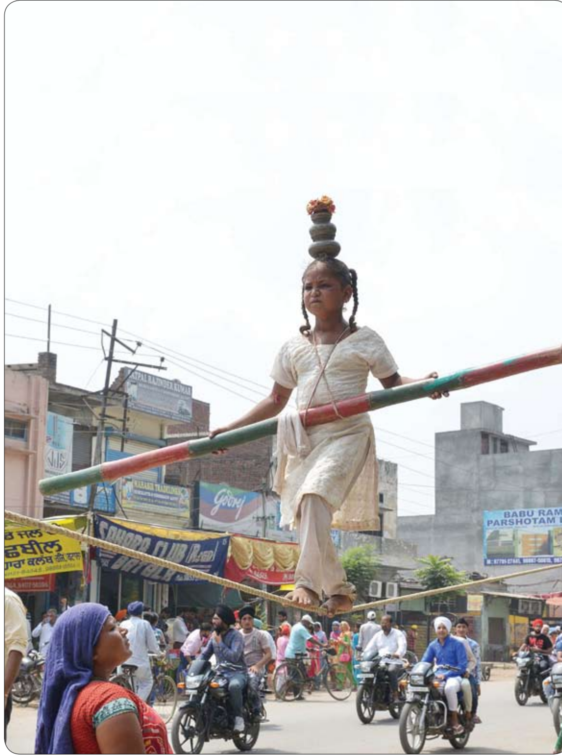
فتاة هندية تبلغ من العمر ثماني سنوات تقوم بعمل توازن على حبل أثناء عرض في أحد شوارع باتالا.

اكتشف العلماء أعراضاً جديدة يمكن أن تكون إشارة واضحة على الإصابة بسكتة قلبية وشيكة. وأكد فريق من العلماء والخبراء الطبيين في جامعة ولاية ميشيغان، أن الكوليسترول الذي يأتي في شكل بلورات، كان من المواد المسببة لتصلب الشرايين الناتجة عند عدد من المرضى. ووجد الباحثون هذا النوع الخاص من الكوليسترول، عند أكثر من 89% من حالات غرف الطوارئ. وبهذا الصدد، يقول الدكتور جورج أيبلا، أستاذ الطب في جامعة ولاية ميشيغان: "أظهرنا في الدراسات السابقة أنه عند تحول الكوليسترول من الحالة السائلة إلى الصلبة أو البلورية، فإنه يكبر في الحجم مثل الثلج والماء. ويؤدي هذا التوسع داخل جدار الشريان، إلى تمزقه ومنع تدفق الدم، ما يسبب السكتة القلبية". وقام الباحثون بفحص المرضى في أكثر من 240 غرفة طوارئ، في جميع أنحاء الولايات المتحدة، حيث تمكنوا من سحب بلورات الكوليسترول من أحد المرضى، لدراسة حجمها ودرجة صلابتها. واكتشفوا أن مجموعات كبيرة من البلورات تمكنت من اختراق جدران الشرايين، وحتى دخول القلب. وتسكن العلماء أيضاً من تأكيد أن هذه البلورات قد نجحت في إنتاج جزيئات الالتصاق، تسمى "إنترلوكين 1 بيتا"، أو الوسيط الداخلي في الكريات البيض، التي يمكن أن تؤدي إلى تفاقم الوضع. والآن، يعزز هذا البحث، فضلاً عن وجود فهم أفضل للأعراض الرئيسية قبل الإصابة بأزمة قلبية، فكرة أن الكثير من التمارين والخيارات الغذائية الجديدة، لديها القدرة على الحد من تشكل هذه البلورات.