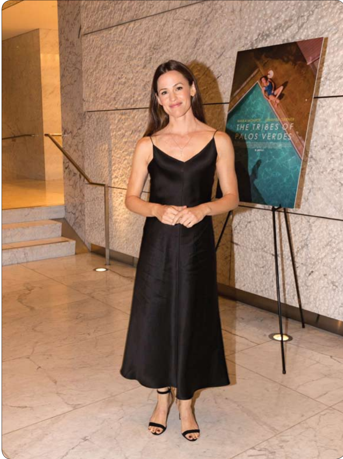
جينيفر غارنر خلال حضورها عرض فيلم "قبائل بالوس فيريديس" في مسرح راي كورتزمان في لوس أنجلوس.