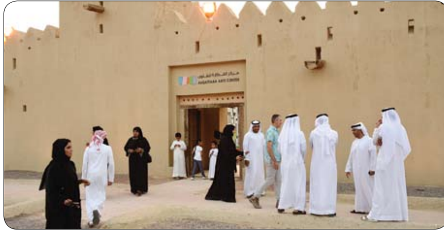
معرض جماعي يطرح الأعمال الفنية لثلاثة وعشرين فناناً إماراتياً ومقيماً