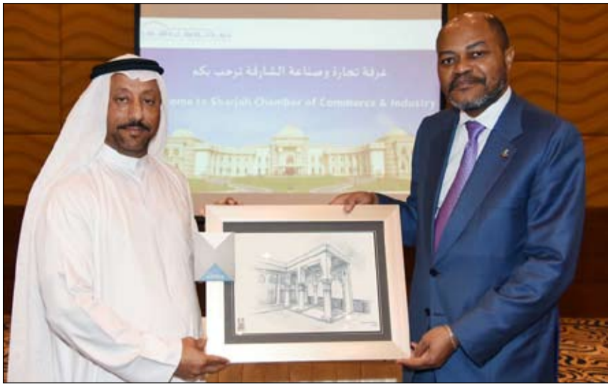
عبدالله سلطان العويس يستقبل وزير الاقتصاد الأنغولي