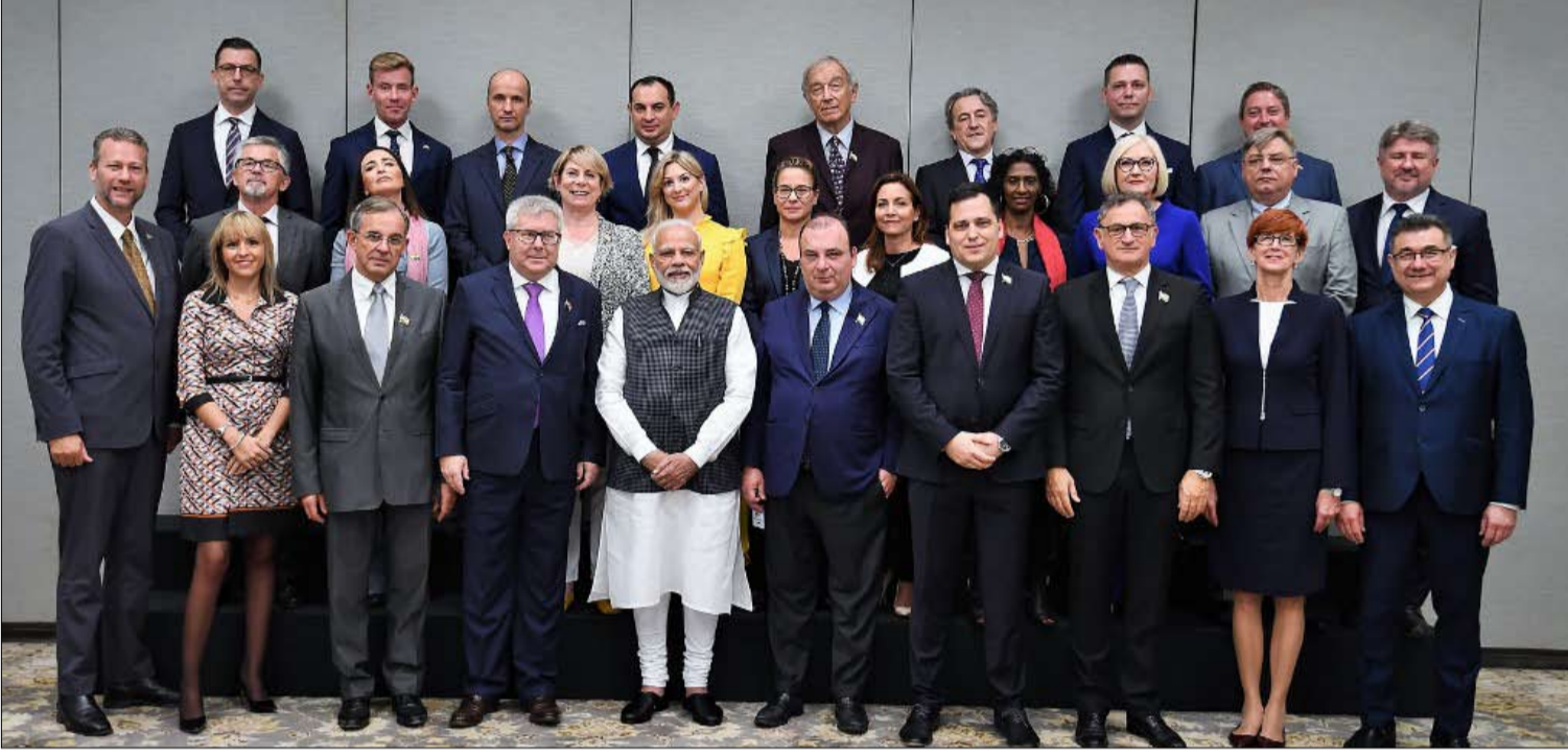
الوفد الأوروبي يحيط برئيس الوزراء الهندي ناريندرا مودي في نيودلهي

هذه الزيارة، هي أحدث دليل على الروابط القوية بين اليمين المتطرف الهندي والأوروبي، حيث تدور النقاش المشتركة حول كراهية السكان المسلمين، والمهاجرين، وتجنسد في مشاريع وطنية قومية.