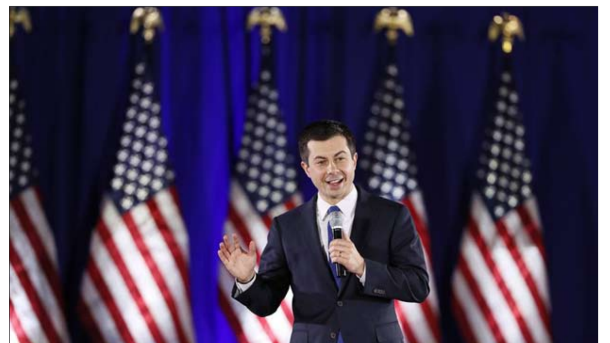
بيت مفاجأة التمهيدية