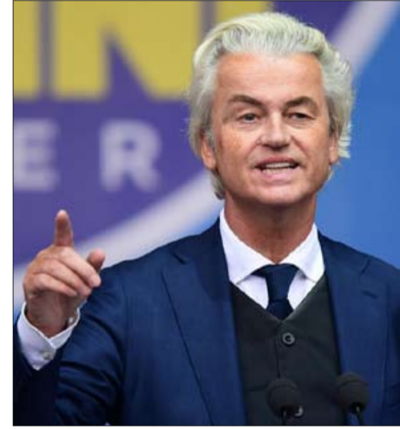
خيرت فيلدرز من مساندي مودي

واتهم لارس باتريك بيرغ، النائب الأوروبي عن حزب البديل من أجل ألمانيا، وسائل الإعلام بنعتهم "بالتنازير الذين يكرهون المسلمين"، ودعا كل من مارياني وبييرغ إلى زيادة الأمن على حدود الاتحاد الأوروبي، وربط بين المهاجرين وهجمات إرهابية إسلامية محتملة.