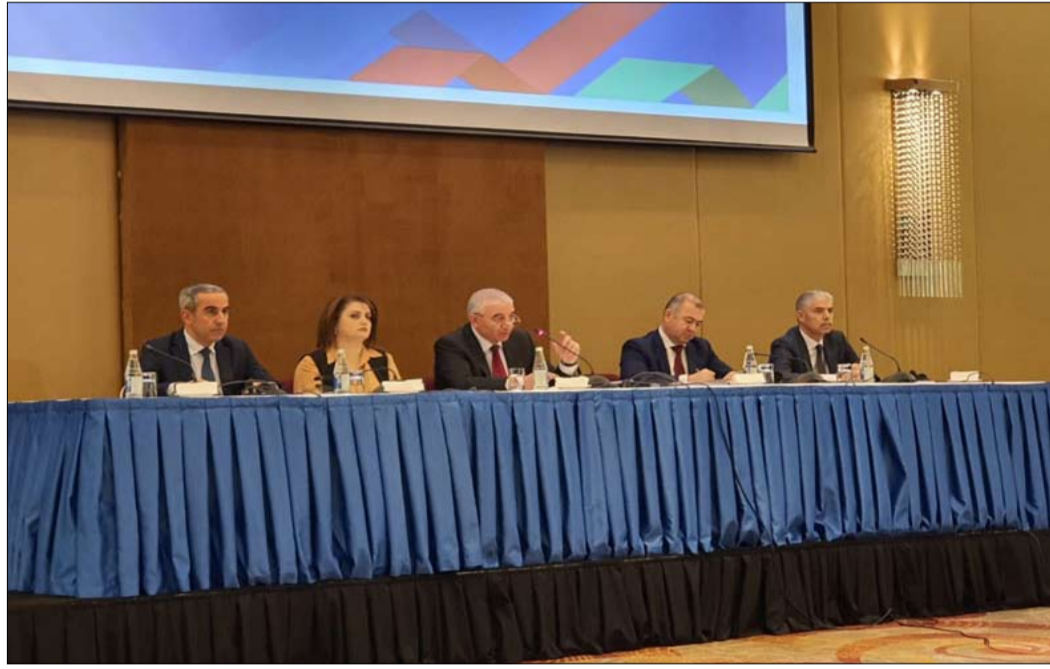
رئيس لجنة الانتخابات الأذربيجانية خلال مؤتمره الصحفي

أن أوصل مهامه كمفوض للحكومة. ويطلب منها قدمت استقالتي من مهامه، ويأتي هذا بعد تعرضه للقتل لعدة أيام. وطالب الحزب الاشتراكي الديمقراطي شريك ميركل في الحكومة المركزية، بإقالة هيرتي الذي اعتبر أنه "لا يمكن الاستمرار في الدفاع عنه". سببت انتخابات ولاية تورنغن زلزالاً في البلاد، لأنها كسرت إحدى المحرمات السياسية في تاريخ ألمانيا بعد الحرب: رفض اليمين المعتدل لأي تحالف مع اليمين المتطرف.