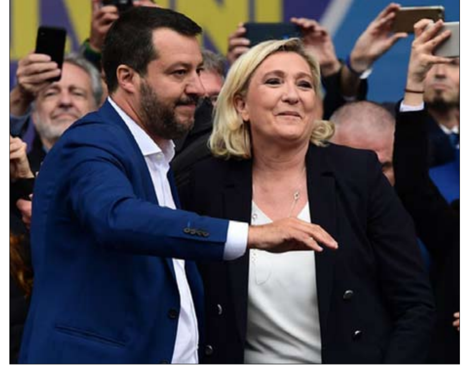
اليمين الأوروبي المتطرف يستلم من المدرسة الهندية

أهداف أوسع. لقد سعى القوميون الهنديون منذ فترة طويلة إلى توسيع الامتداد الإقليمي لبلدهم لاستعادة بعض ما كان ذات يوم الهند تحت الحكم البريطاني - وهي مناطق لا تشمل كشمير - بل باكستان وبنغلاديش أيضاً... ومناطق أخرى في جنوب آسيا.