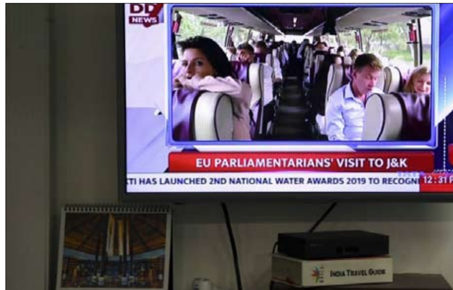
التلفزيون الهندي يتابع زيارة الوفد البرلماني الأوروبي إلى كشمير