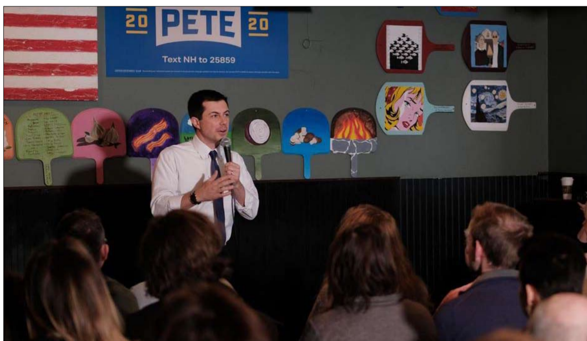
شخصية تجمع بين التقدمية والمحافظه