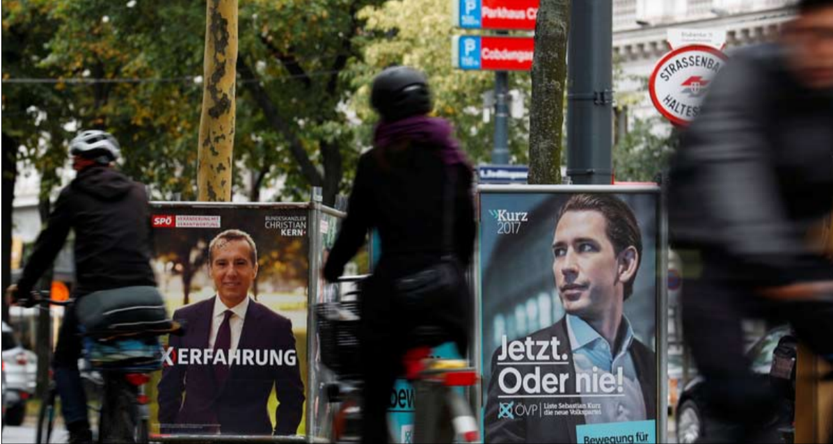
انتخابات قد تشكل متعرجاً تاريخياً في النمسا

يضع حزب المحافظين الحاكم، والمرشح للوزراء التشريعية يوم الأحد القادم، يضع في اعتباره إمكانية التحالف مع حزب الحرية القومي المتطرف. وهذه هي الأولى في النمسا منذ 17 عاماً.