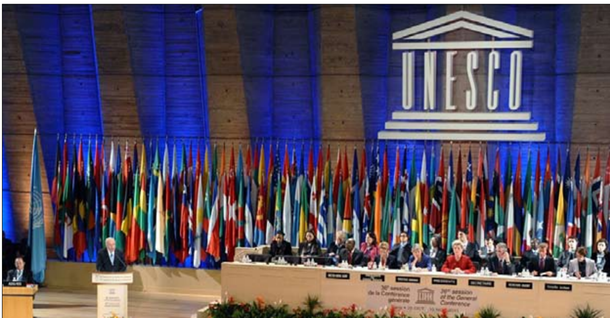
الانسحاب الأمريكي يعيق ولا يتقفل