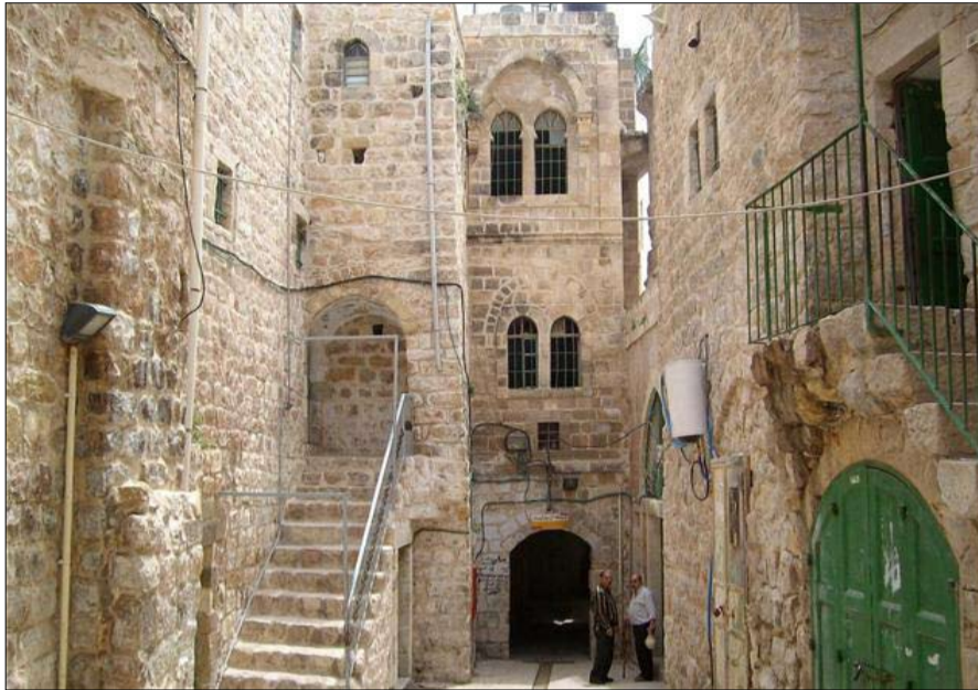
البلدة القديمة بمدينة الخليل جذر المشكلة