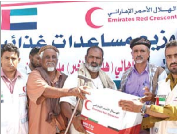
الهلال الأحمر يسلم المساعدات على أهالي شبوة (وام)

عواصم - وكالات: شن طيران النظام السوري صباح أمس، عدة غارات على أحياء تحت سيطرة المعارضة السورية جنوب العاصمة دمشق. وشنّت طائرات النظام عشر غارات استهدفت منطقة الحجر الأسود جنوب العاصمة دمشق، وغطت سحب الدخان المنطقة، التي تعرضت للقصف بعد حوالي عام من حالة هدوء، التي تعيشها المنطقة، ولم تتعرض للقصف بسلاح الطيران. وقالت مصادر في المعارضة السورية إن قيام الطيران الحربي في قصف الأحياء الواقعة تحت سيطرة المعارضة جنوب دمشق، جاء بعد تعثر ملف خروج المسلحين من إدلب باتجاه محافظة إدلب ومدينة جرابلس في ريف حلب الشرقي. وأكد المصدر أن قوات النظام السوري وفصائل مسلحة موالية تلك الأحياء باتجاه محافظة إدلب ومدينة جرابلس في ريف حلب الشرقي. وأكد المصدر أن قوات النظام السوري وفصائل مسلحة موالية مقاتل من القوات السورية الديمقراطية يتفقد موقعا مدمرا في الحسكة له، بدأت عملية عسكرية للضغط على مسلحي تلك المناطق للخروج باتجاه شمال سوريا. من جانب آخر قال الجيش التركي، امس الجمعة، إن هذا نشر نقاط