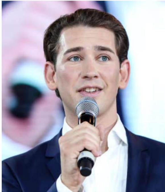
سيبستيان كورز على خطى ماكرون