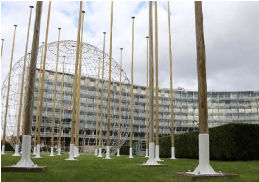
اليونسكو في عين الاعصار