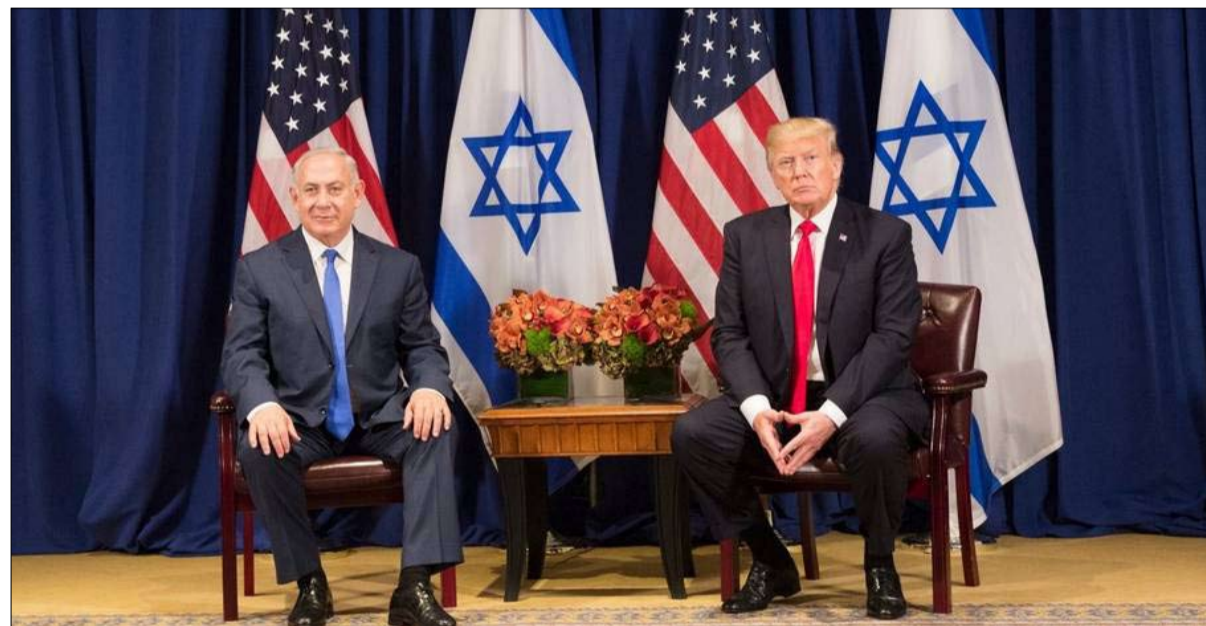
انسحبا معا من البيت الثقافي الاممي