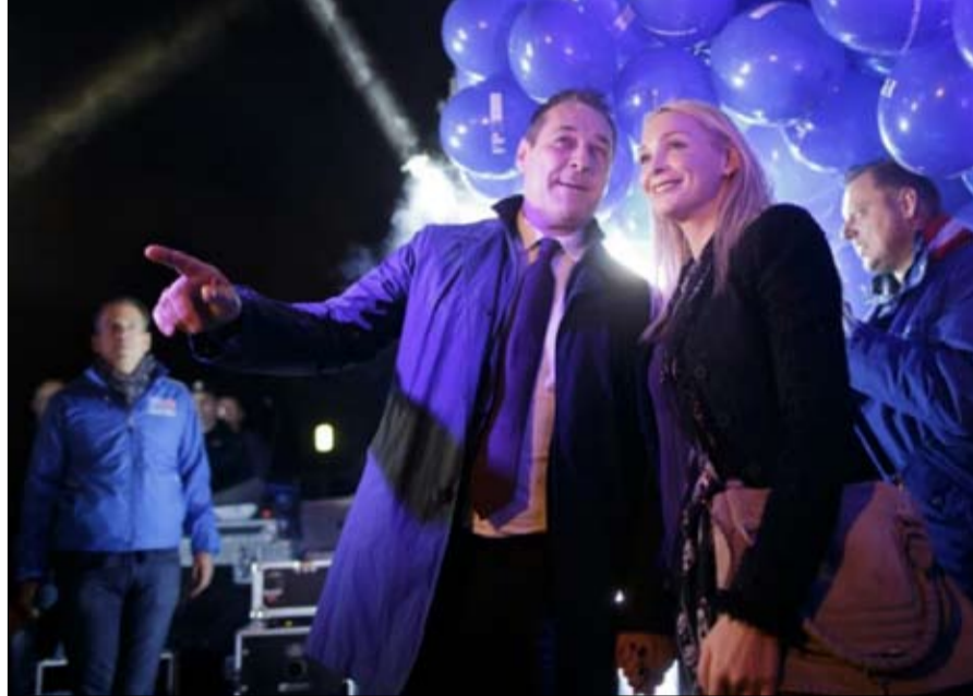
اليمين المتطرف يطرق باب الحكومة بعنف

قد يكون الاقتراع تاريخياً إذا كتب نهاية نظام الائتلاف الكبير الذي سيطر على الحياة السياسية منذ عام 1945