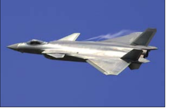
طائرة شبح صينية