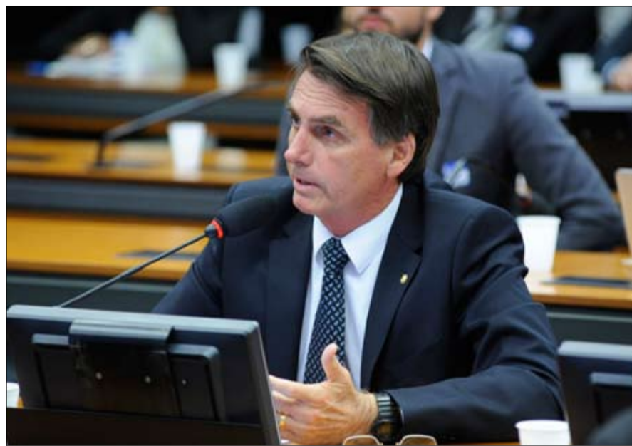
أغوى خطاب جايرو بولسونارو شريحة متزايدة من الناخبين