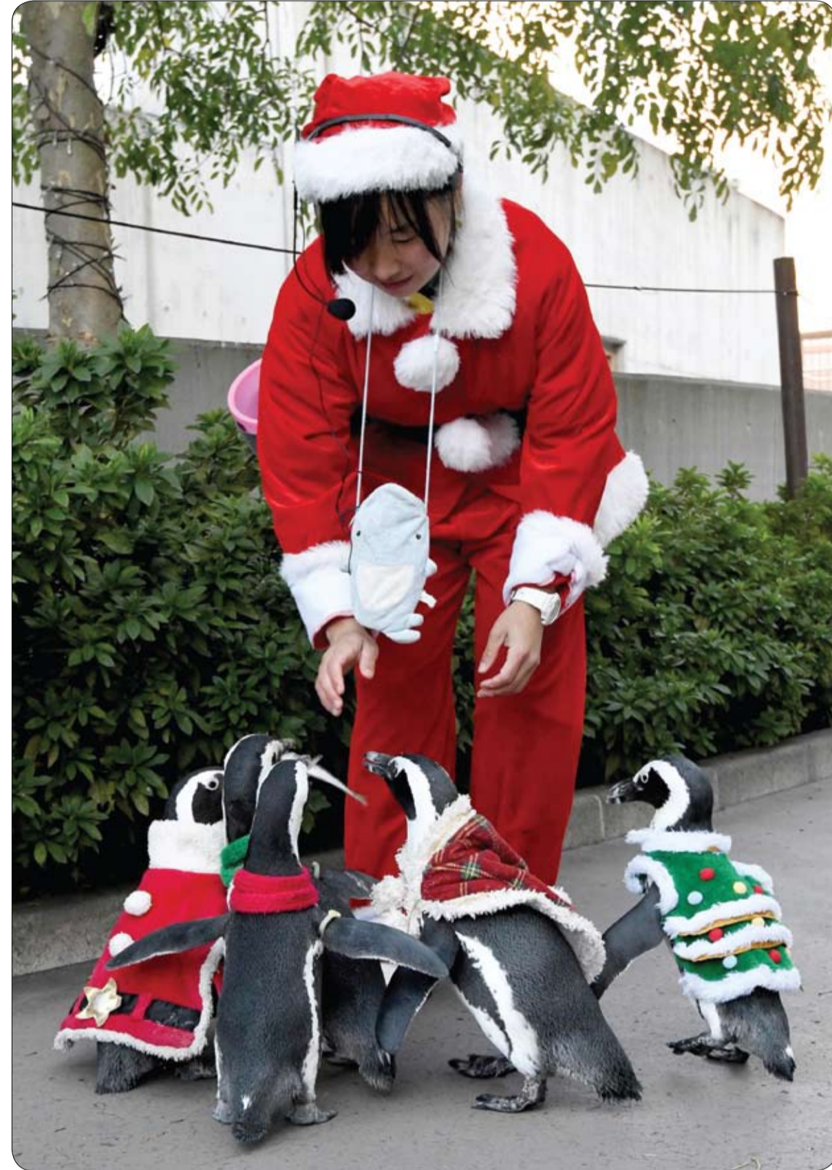
طيور البطريق الأفريقية ترتدي ملابس عيد الميلاد خلال نزهة مع حارستهم في متنزه هاكيجيما سي