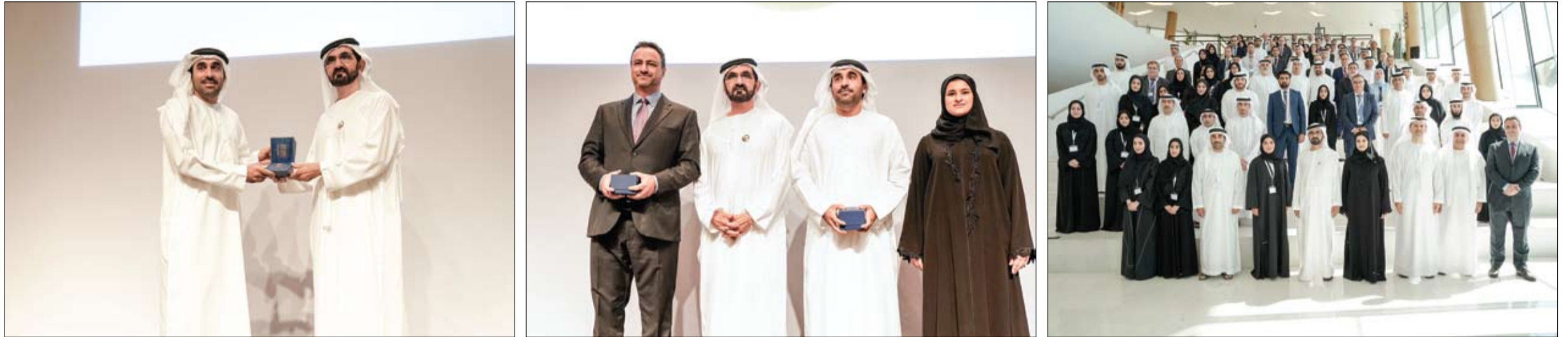
شهد أول اجتماعات مجمع العلماء وكرم الفائزين بميدالية التميز العلمي