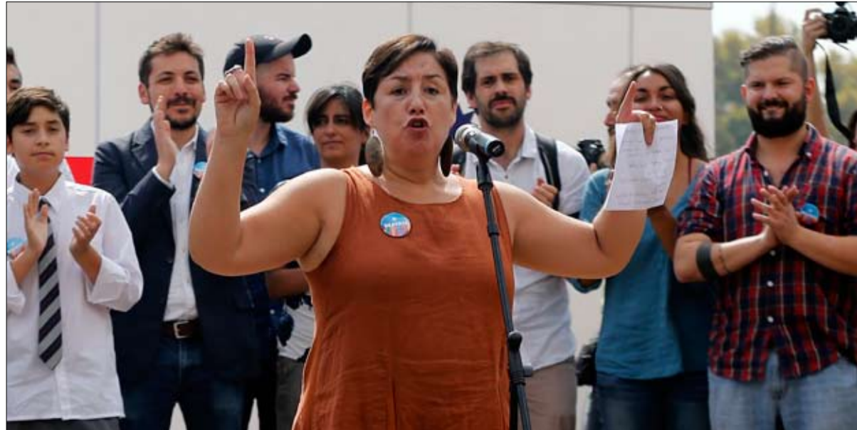
بياتريس سانشيز، رئيسة حزب يساري جديد