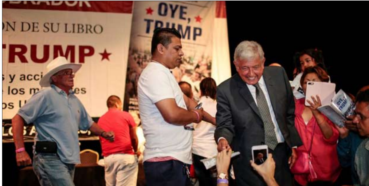
اندريس مانويل لوبيز أوبرادور الاوفر حظا في المكسيك

حسم المباراة لا يزال بعيدا قبل ستة أشهر من الانتخابات، ولكن العمدة السابق لمكسيكو سيتي اندريس مانويل لوبيز أوبرادور المعروف باسم "أملو"، والرئيس البرازيلي السابق يتصدران استطلاعات الرأي. إمكانية انتصار أملو في محاولته الثالثة أو العودة إلى السلطة بالنسبة للولا، رغم إدانته بالسجن تسعة سنوات ونصف بتهمة الفساد، توضح قوة الحركة المناهضة للاستبداد التي تخترق معظم القارة جراء الفساد والعنف والشعور العام بالإحباط بين السكان الذي يغذي رفض الطبقة السياسية التقليدية. البرازيل والمكسيك هما إلى حد بعيد أكبر اقتصادين في المنطقة، إلا أن ما يقارب ثلثي الناخبين في أمريكا اللاتينية سيدعون إلى صناديق الاقتراع بنهاية العام المقبل. ومن المنتظر إجراء ما يقرب العشر انتخابات في المنطقة خلال الاثني عشر شهرا المقبلة في أعقاب الانتخابات الرئاسية التي جرت في شيلي الأحد الماضي، والانتخابات البرلمانية التي جرت في أكتوبر في