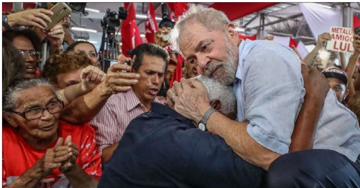
لولا يتصدر استطلاعات الرأي في البرازيل رغم متابعيه القضائية