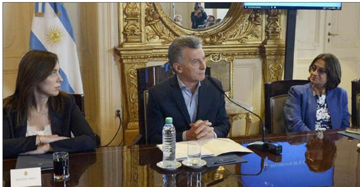
موريسيو ماركيز عزز سلطته في الأرجنتين