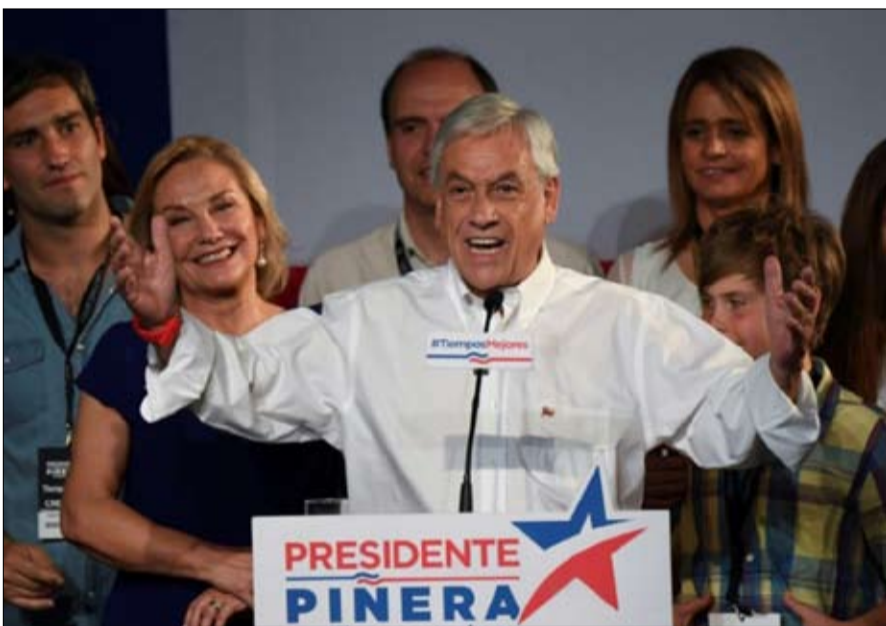
سيباستيان بينيرا جولة ثانية حامية في شيلي